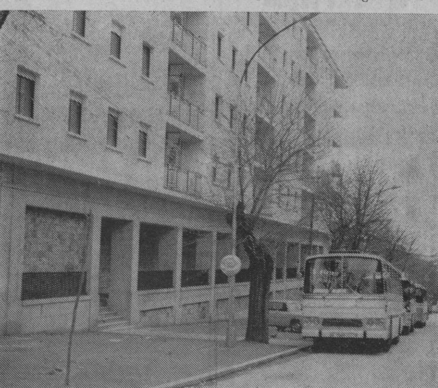
Los autobuses están en la calle. ¿Buscan la entrada a la estación o estacionamiento? ¿O es que no van a tener sitio dentro de la instalación que se había proyectado para ellos?

las de que el adjudicatario del solar vendría obligado a la construcción de un estacionamiento abierto para todos los coches de línea que afluyesen a la capital, con una capacidad mínima de 25 aparcamientos simultáneos, y dotado de un andén cubierto para las personas; en el perímetro del patio de estacionamiento se montarían las agencias de los concesionarios de líneas de transporte con sus taquillas, locales para oficinas, consignas y salas de espera, et-