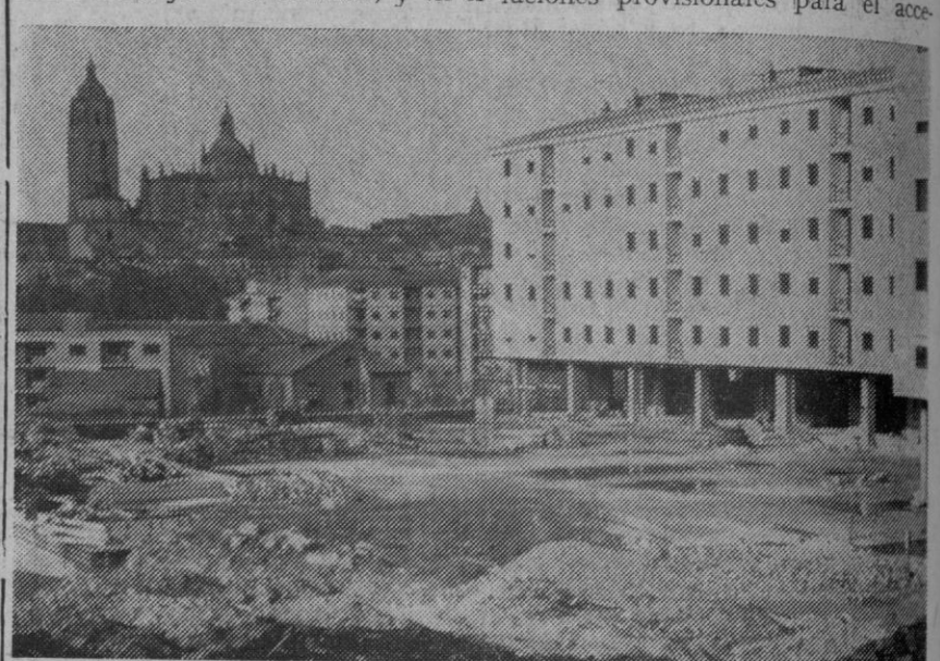
Parte posterior de la estación o estacionamiento. Ese inmenso solar, ¿qué va a ser? ¿Lugar de "protección" para los niños de los vecinos, o zona para situar vehículos?

En el año 1965 volvió a hablarse de estación de autobuses. En el pleno de febrero se replanteó—¿qué número hacía ya?—la cuestión, y en el