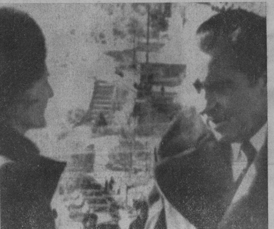
Pekín.—El presidente Nixon y su esposa realizan una visita a la muralla china y atienden a las explicaciones de sus guías. Estuvo presente el secretario de Estado, William Rogers.

Sin embargo, también es cierto que Chu En Lai le manifestó el pasado agosto a James Reston, columnista de "The New York Times", que personalmente le gustaría discutir con Nixon la posibilidad de llegar a un pacto de no agresión.