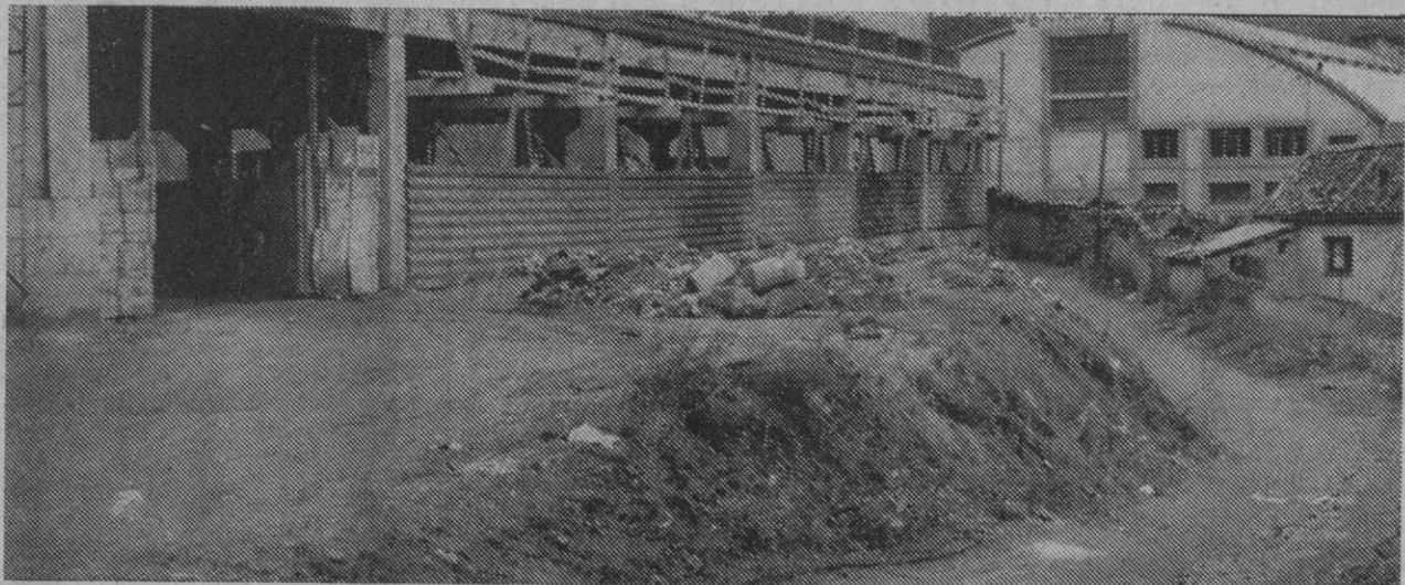
¿Es esta la "carretera" de acceso a las plantas bajas?

Por último, en 1971, el día 13 de abril, nuestro periódico recogía la noticia de que iban a aplicarse soluciones provisionales para el acce-