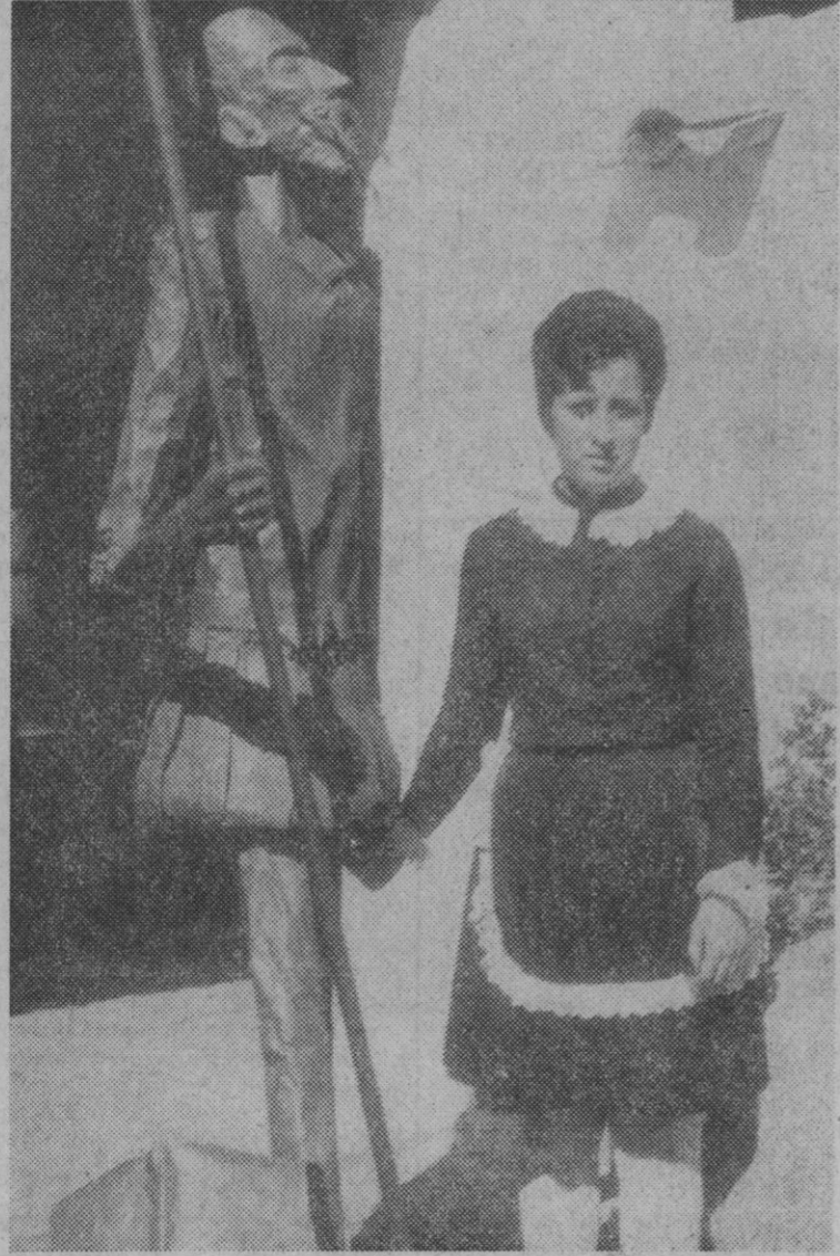
Puerto Lápice.—1972 será el «Año Nacional del Quijote». En torno a la famosa novela cervantina girará gran parte de la captación turística. Puerto Lápice, antiguo lugar de ventas y hoy gran centro turístico, prepara estas ceremonias con un monumento al Hidalgo, y la colaboración gentil de las «Dulcineas».

Ayer, un portavoz de la Alta Comisaría de Ghana dijo que el doctor Busia, que visitaba a un oculista, en Londres, regresaría a Accra el viernes.—Efe-Reuter.