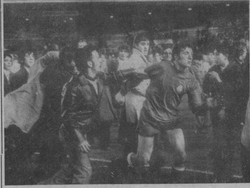
Madrid.—Disputado en el Estadio Bernabéu el encuentro España-Hungría resultó vencedora la selección española, que atacó con gran ardor y rapidez sobre el marco húngaro. El resultado fue de 1-0. Los aficionados muestran su alegría tras el encuentro.