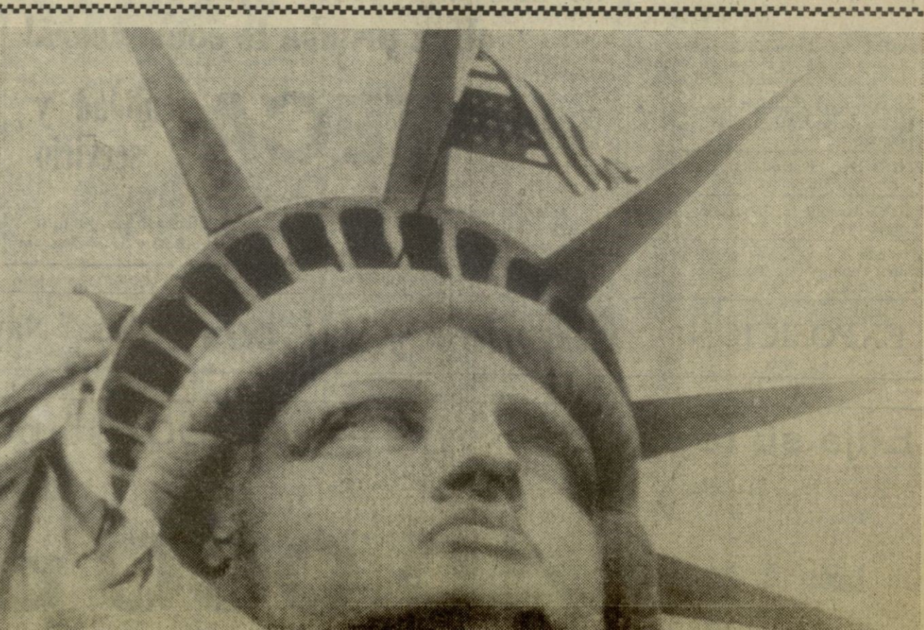
Veteranos de la guerra se concentran en dentro de la Estatua de la Libertad en Nueva York para protestar contra la violencia.