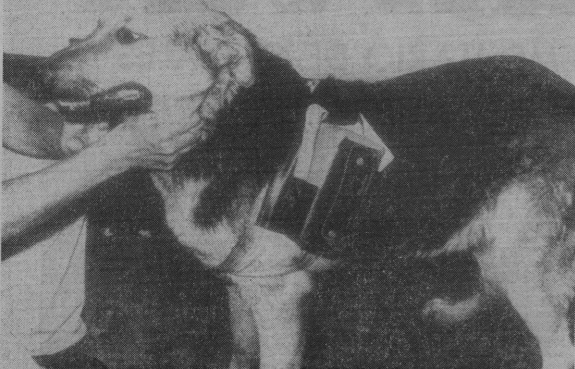
El perro, ese gran amigo del hombre, fue una vez protagonista decisivo de un acontecimiento científico de primera magnitud: el descubrimiento de la insulina, hace ahora 50 años y que, desde entonces, sigue siendo el mejor remedio contra la diabetes. Se logró mediante ensayos y estudios en perros a quienes previamente se les había extraído el páncreas. Lo descubrieron dos jóvenes canadienses: Fred Banting y Herbert Best.

El viernes, día 31 de diciembre, hubo siete accidentes, que ocasionaron nueve muertos; el sábado, día primero de año, siete accidentes, con siete muertos, un herido grave y tres de menos pronóstico, y el domingo, día 2 de enero, también siete accidentes, con un balance de nueve muertos y nueve heridos, tres de ellos graves.—Cifra.