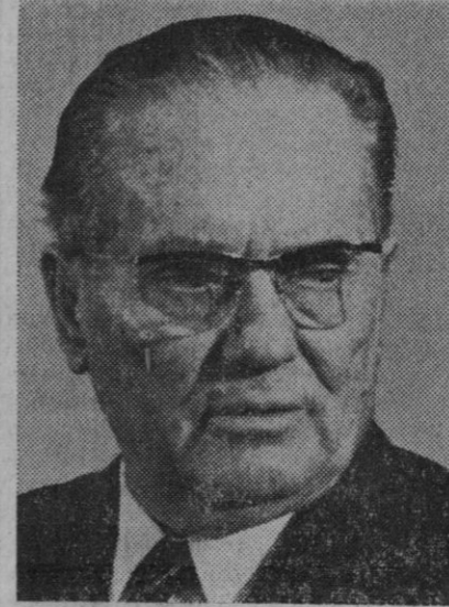
Joseph Broz, Tito, presidente de Yugoslavia, que se enfrenta ahora al problema separatista de Croacia