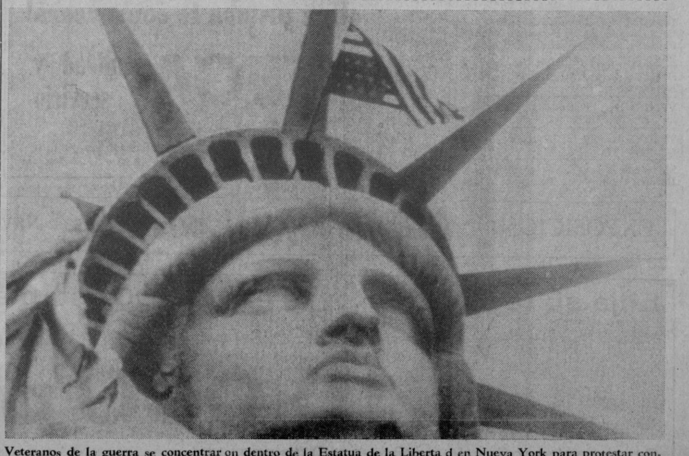
Veteranos de la guerra se concentran en dentro de la Estatua de la Libertad en Nueva York para protestar contra la violencia.

Barcelona, 3.—Más de treinta y siete millones de cartas fueron enviados por los barceloneses entre los días 20 y 24 de diciembre pasado. El día de máximo reparto, fue el 24, en que fueron entregados por carta 1.200.000 envíos por correspondencia.—Cifra.