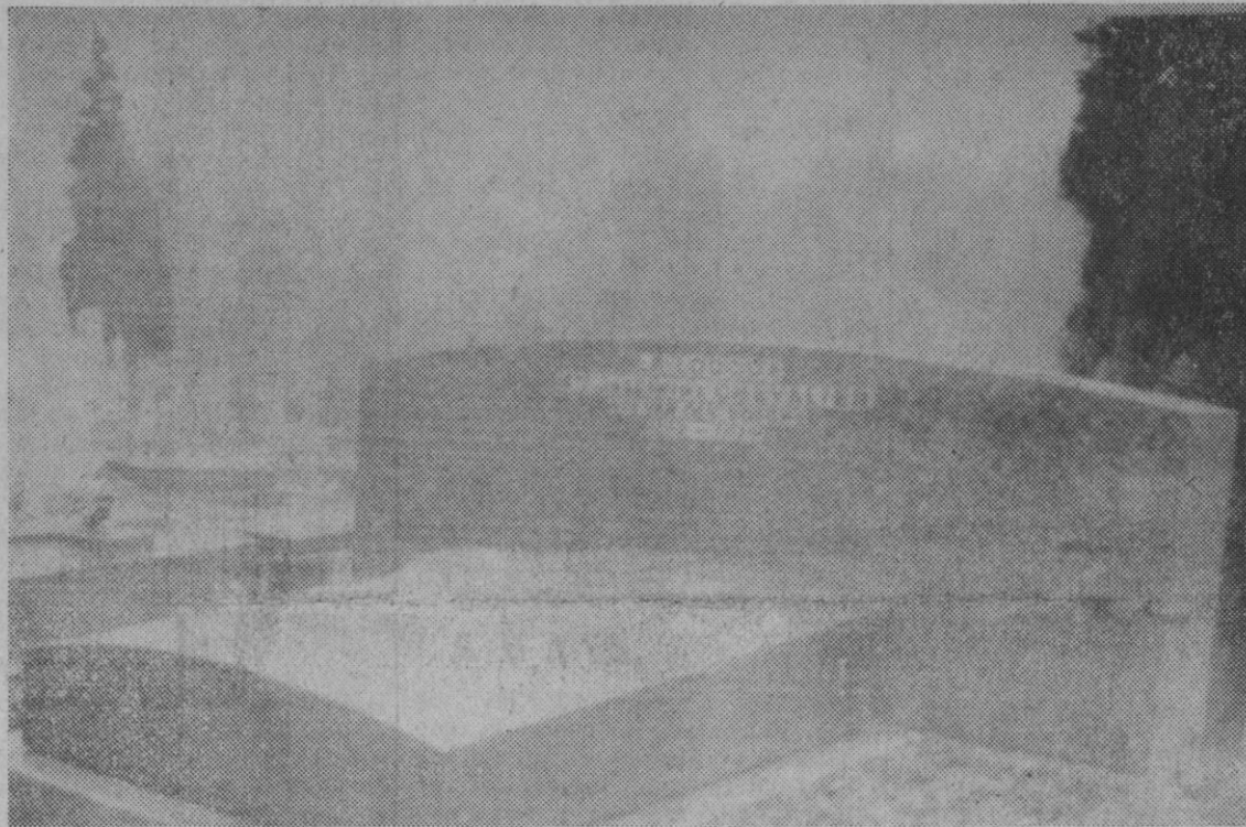
Marne la Coquette (Francia).—Esta es la tumba donde será enterrado el famoso cantante francés, Maurice Chevalier, el próximo miércoles.

León, 3.—Unas tablas antiguas valoradas en más de cincuenta mil pesetas, fueron robadas, por personas hasta ahora desconocidas, de la casa solariega que perteneció al poeta Leopoldo Panero, en el pueblo de Castrillo de las Piedras.