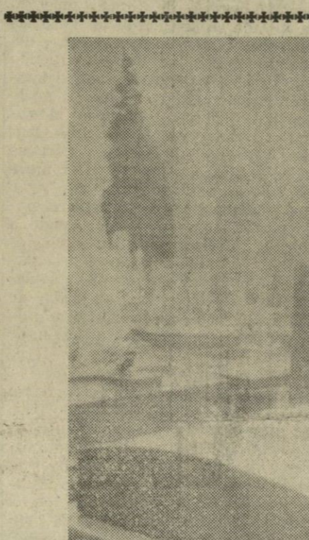
Marne la Coquette (Francia).—Esta es la tumba donde será enterrado el famoso cantante francés, Maurice Chevalier, el próximo miércoles.

León, 3.—Unas tablas antiguas valoradas en más de cincuenta mil pesetas, fueron robadas, por personas hasta ahora desconocidas, de la casa solariega que perteneció al poeta Leopoldo Panero, en el pueblo de Castrillo de las Piedras.