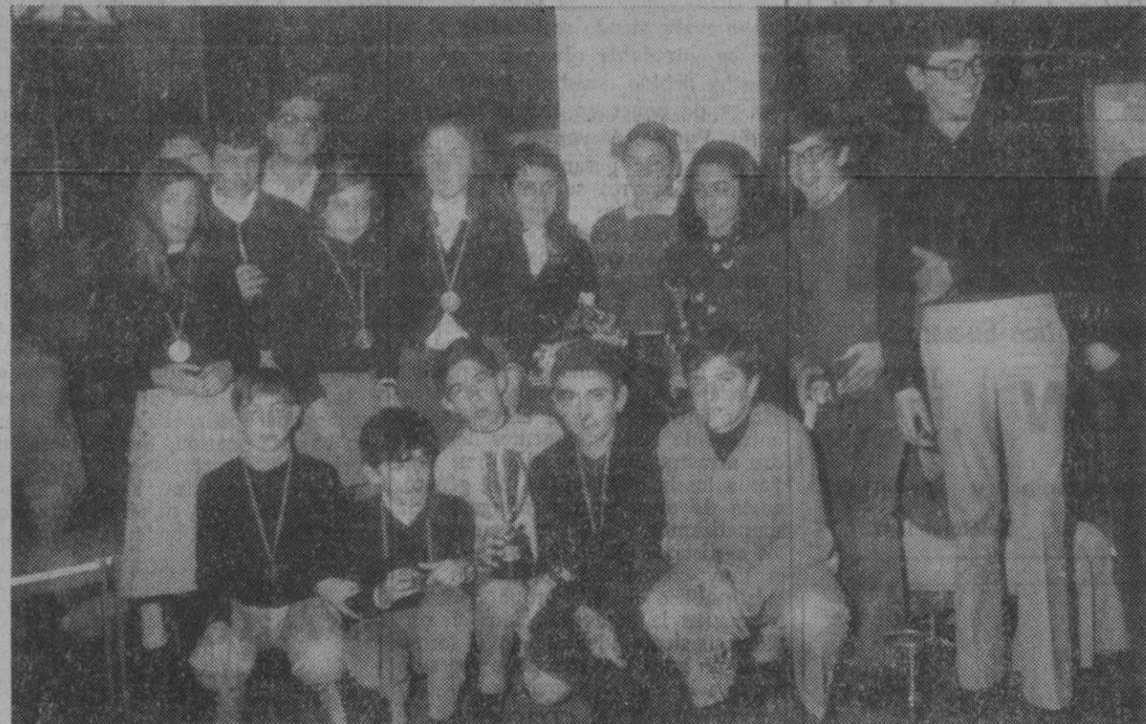
Los ganadores, con sus trofeos.

Muy simpática resultó la fiesta — con nutridísima asistencia — que a última hora de la tarde de ayer se organizó en «Showking», con motivo de la entrega de premios de las pruebas de esquí que la Deportiva Alpina Segoviana celebró en la última temporada.