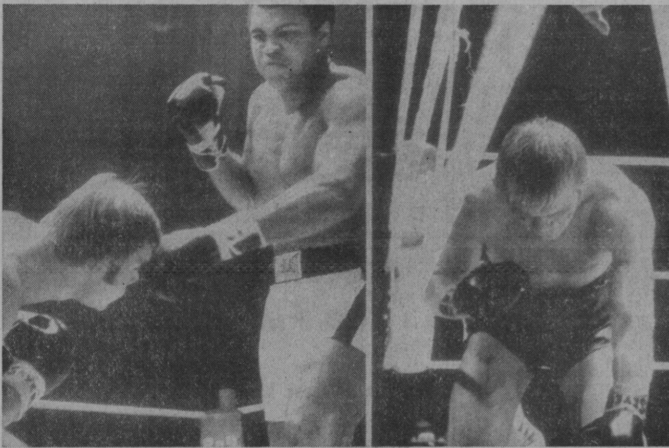
Jurgen Blin perdió por K. O. ante Cassius Clay. A la izquierda, un golpe del americano, y a la derecha, Blin caído.

Los Estados Unidos y Vietnam del Norte cancelaron de nuevo esta semana la reunión del jueves en París, después de intercambiar protestas sobre la «escalada» de la guerra en Vietnam.—Efe.