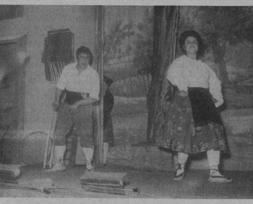
Una escena de «La del Soto del Parral» en escenificación realizada por el Cuadro Artístico «Julián Gayarre»

La representará el cuadro «Julián Gayarre», próximamente