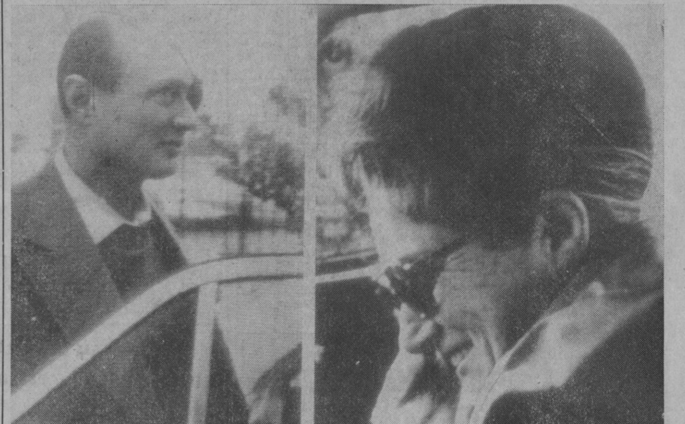
La foto muestra, a la izquierda, al ministro de Defensa israelí, Moshe Dayan, y a la derecha, su ex-esposa, Ruth Dayan, saliendo de la casa del jefe de los rabinos de Tel Aviv momentos después de divorciarse, tras 36 años de matrimonio.—(Telefoto AP-Europa Press)

El torero, que hoy recibirá la «placa de plata» del citado rotativo barcelonés, ha indicado que este año ha sido uno de los mejores de su vida taurina y desde luego, la mejor temporada que había desarrollado nunca en Barcelona.—Cifra.