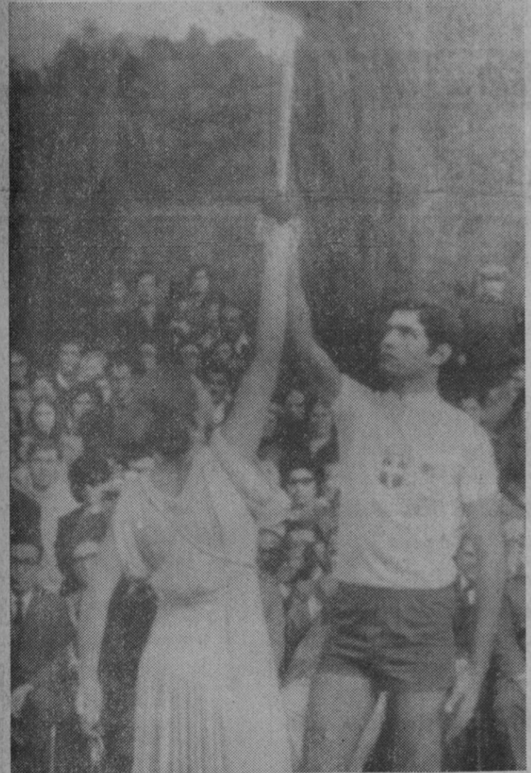
Olimpia (Grecia).—He aquí el momento en que una bella muchacha, ataviada de «diosa» griega, entrega el fuego olímpico que iluminará los Juegos Olímpicos Invernales en febrero en Sapporo (Japón).

Según se afirma en dicho artículo, los productos de frutos secos de Estados Unidos y de Turquía, los dos más importantes centros competidores de España en este terreno, resultarán grandemente beneficiados por la nueva paridad del dólar.