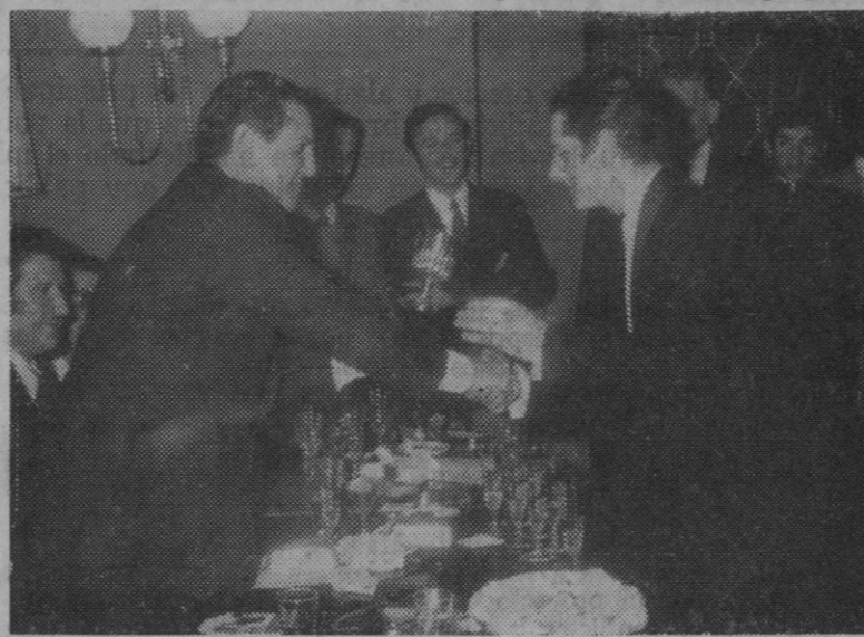
El delegado de Información y Turismo entrega el trofeo del ministro al vencedor del concurso.

SIRENAS.—Hoy, 7,30: DOCTOR TERROR, scope, color, Peter Cushing, Christopher Lee, mayores 18 años. Mañana, estreno: EL CONDE DRACULA, Hebert Holm.