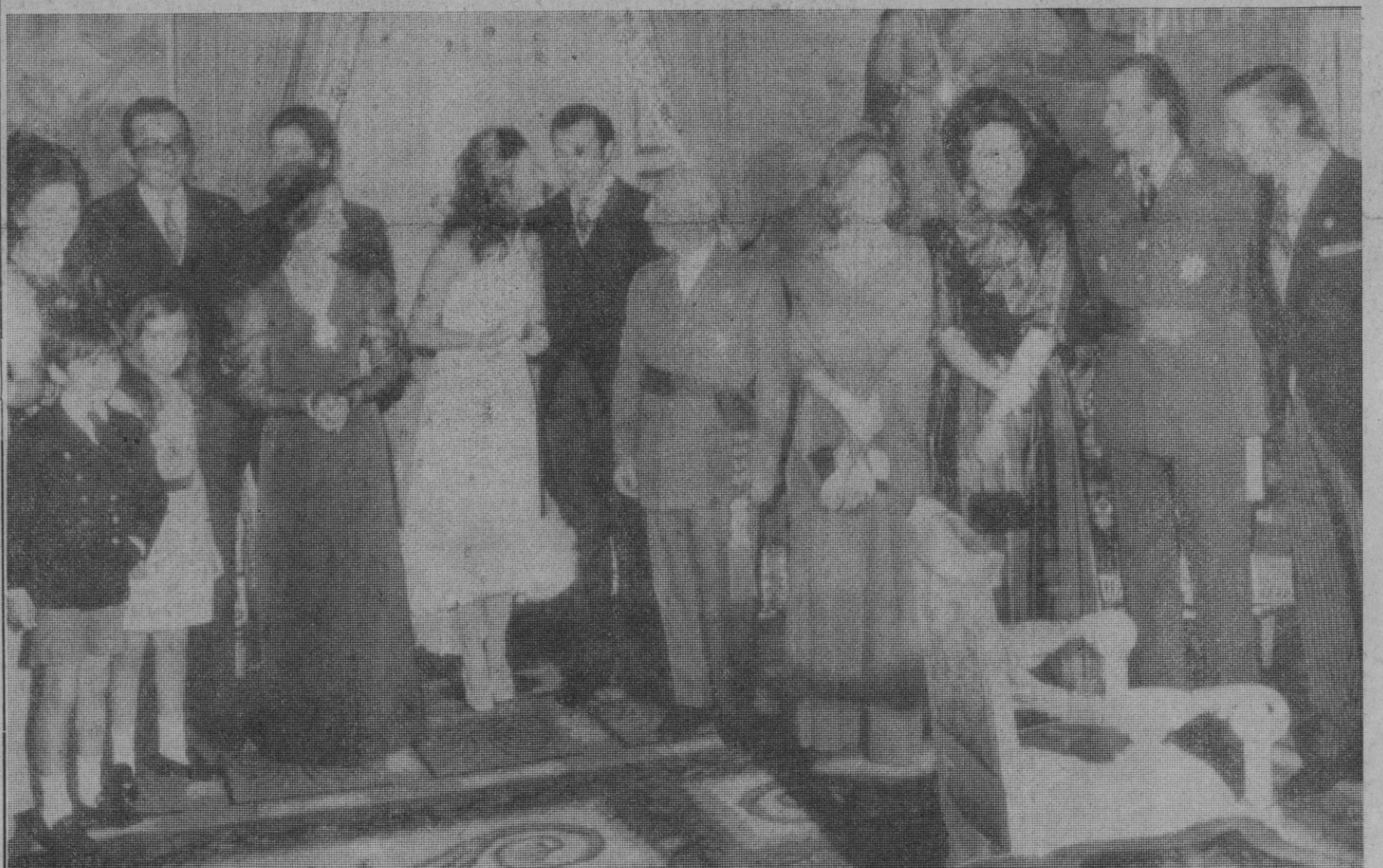
Minutos antes de que se anunciase oficialmente el compromiso matrimonial entre don Alfonso de Borbón Dampierre y la señorita María del Carmen Martínez-Bordiú Franco, en el palacio de El Pardo, se obtuvo este grupo familiar que encabeza Su Excelencia el Jefe del Estado y su esposa, doña Carmen Polo, abuelos de la novia, y en el que también figuran los Príncipes de España, duquesa de Segovia, marqueses de Villaverde y otros familiares.

Apoyaron oficial y públicamente su candidatura, además de su partido, los bloques social-democrático, liberal y republicano.—Efe.