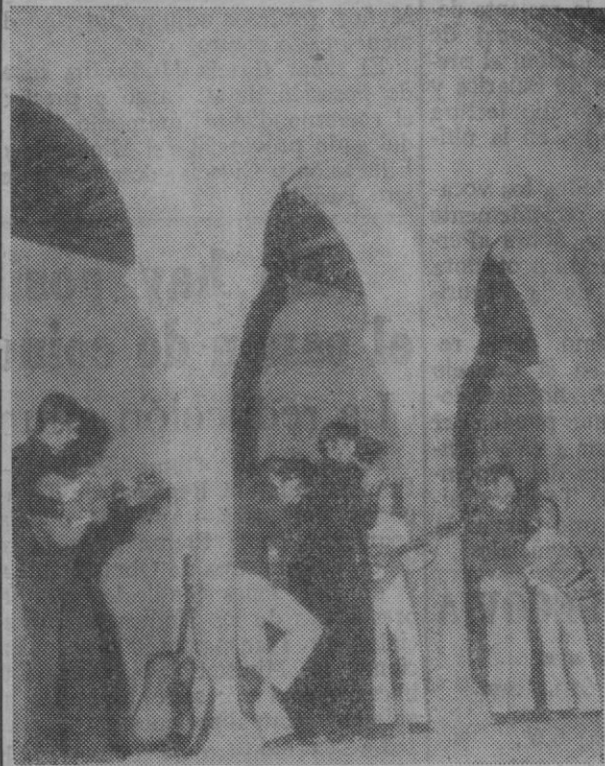
Nuestro fotógrafo, Antonio, obtuvo esta bella imagen de "Nuevo Mester de Juglaría" cuando el grupo actuó en la plaza de la Trinidad en honor de los asistentes al V Congreso Nacional de Arquitectura Típica Regional

—Para llegar a una importante, vamos parcelando nuestro camino en metas a más corto plazo. No es colocar una de nuestras canciones en el primer puesto del Hit-Parade (lo que por cierto nos gustaría sólo por comprobar cómo así había sido superado lo no "folk"), sino demos-