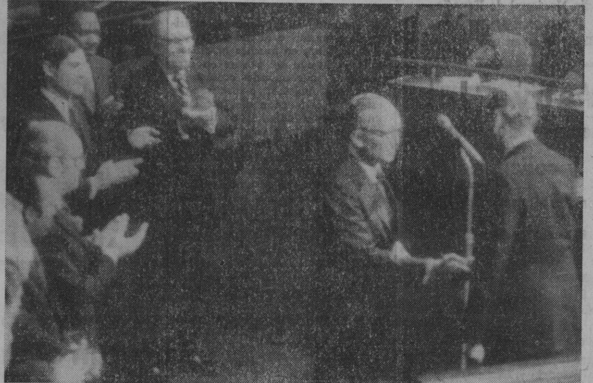
Naciones Unidas.—El hasta ahora secretario general de la O. N. U., U Thant, estrecha la mano a su sucesor, el austriaco Kurt Waldheim, en la ceremonia de toma de posesión celebrada ante la Asamblea General.

Sobre contratos: tarifas y pago de siniestro, de la entidad aseguradora, del Comité de Seguros de Crédito a la Exportación, el seguro por cuenta del Estado y del reaseguro.