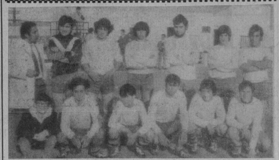
Equipo de fútbol de Fuenteauco.

Posteriormente, el Real Madrid se impuso a la Unión Española de Chile, por 107-90.