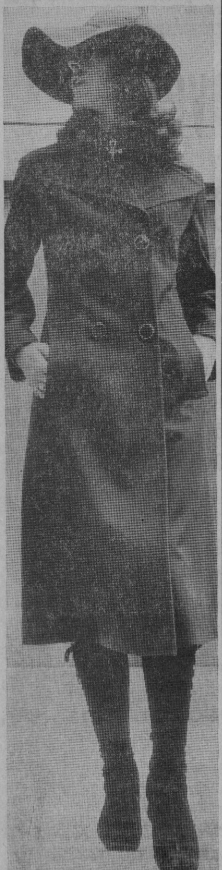
Una prenda de lluvia, estilo redengot, realizada en artículo mezcla lana y poliéster, ligado whipcord, de color rebín oscuro. Se acompaña con pame. la del mismo color y género, siendo el detalle de originalidad las grandes solapas y los gruesos botones de cuero y metal.—(Modelo Condal)

El fiscal general del estado de Punjab ha dicho que el vicepresidente general de la policía presidirá la Comisión designada para investigar la verdad de las acusaciones, cuya índole y fundamentos no se especifican.—Efe-Reuter.