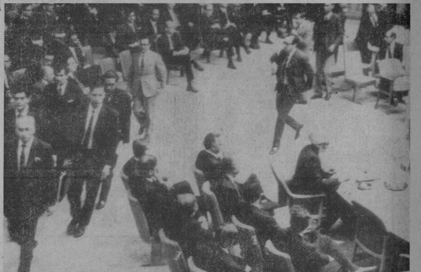
Naciones Unidas.—Zulfiqar Ali Bhutto, delegado de Pakistán en las Naciones Unidas, abandona el Consejo de Seguridad durante la reunión de anoche, acusándolo de «fraude». En primer plano aparece sentado el delegado indio Swaran Singh.

Hong Kong, 16.—China ha acusado hoy a las fuerzas armadas indias de haber cruzado la frontera entre China y Sikkim por Sese-La, y de haber entrado en territorio chino para efectuar reconocimientos, según informa Radio Pekín.—Efe-Reuter.