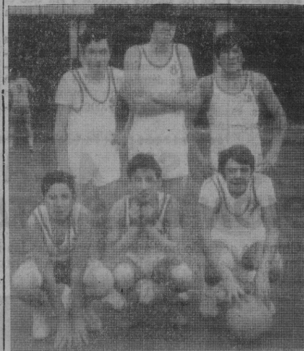
Equipo de baloncesto de O. A. R. «B».