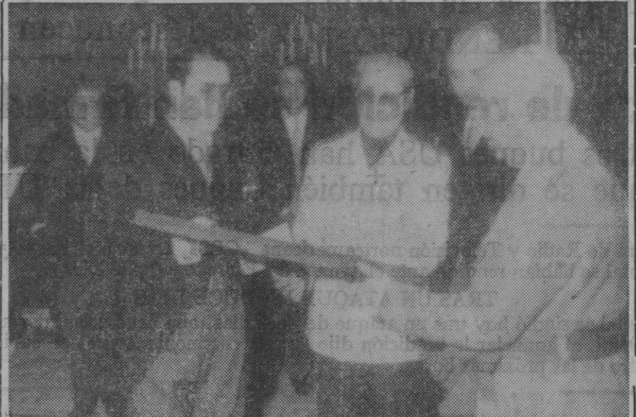
El gobernador civil y el presidente de la Diputación entregan al Caudillo su título de presidente de honor del V Congreso Nacional de Arquitectura Típica Regional.

Junto a todos estos deseos os expresamos nuestro respetuoso afecto,