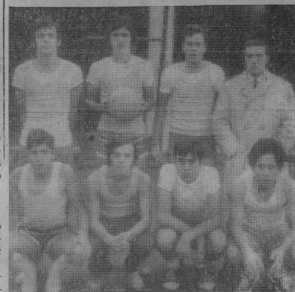
Equipo de baloncesto Smikt.