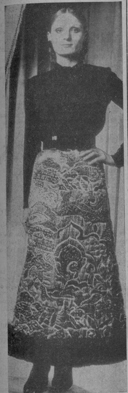
ELEGANCIA Y SOBRIEDAD

Tampoco se trata de hacer grandes gastos, y quizás alguno de los trajes del guardarropa personal con un pequeño arreglo, con un adorno distinto puede adaptarse espléndidamente a la ocasión.