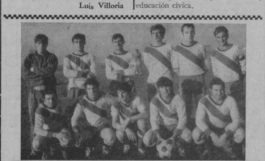
Equipo de fútbol del Monteresma-DYC.

La entrevista entre el delegado nacional y los jugadores de los dos clubs madrileños se desarrolló en un ambiente de franca cordialidad.