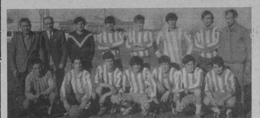
Equipo de fútbol de El Espinar.