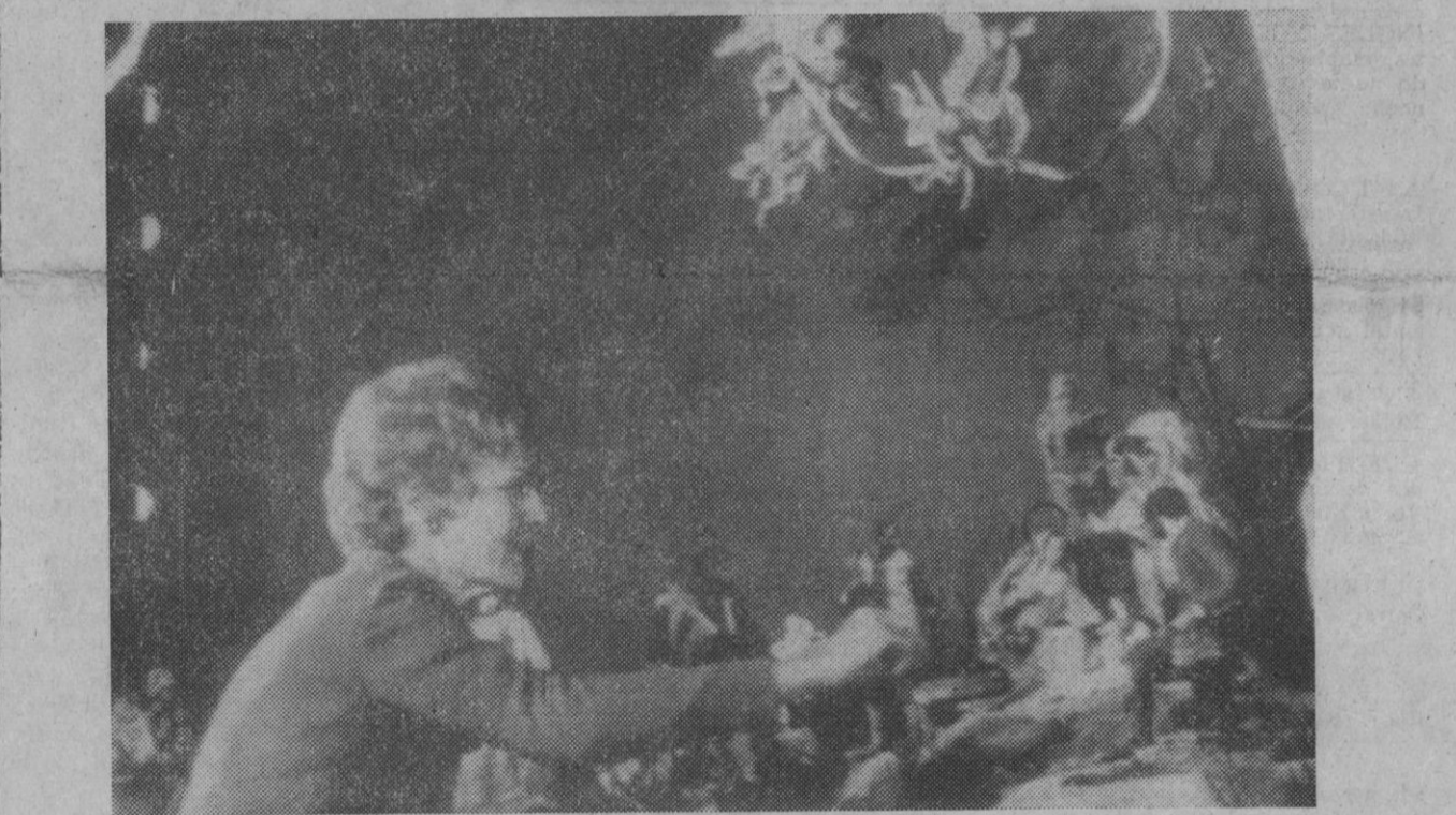
Washington.—Pat Nixon está decorando personalmente la Casa Blanca para las Navidades. Un árbol de dos metros se ha instalado en uno de los salones; pero en lugar preferente de la casa, Pat ha dedicado especial cariño a la colocación de un Belén. Este es el primer año que se instala un Belén en la Casa Blanca.

No habiendo alcanzado el «quorum» ningún candidato, el presidente de la asamblea convocó a los «grandes electores», para una nueva votación, la décima, esta tarde a las 17,30 hora local (15,30 hora de Madrid).