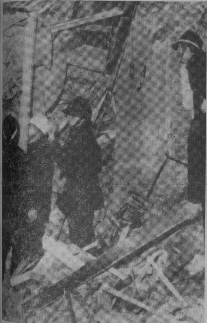
Strabane (Irlanda del Norte).—Los bomberos buscan entre los escombros de la vivienda del senador William Barnhill, poco después de la explosión de una bomba terrorista en la casa. Fuentes oficiales informan de que los terroristas le mataron a tiros y después colocaron la bomba junto a su cuerpo. Su esposa tuvo dos minutos para abandonar la casa.

Se opina que los más prometedores a este respecto son los fondos marinos y oceánicos, pues allí el manto superior está más próximo a la superficie de la tierra.—Efe.