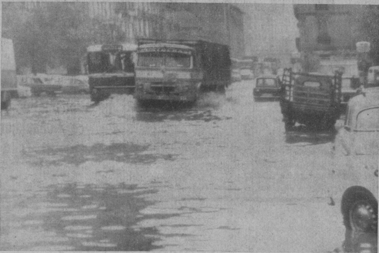
Valencia.—Así amanecieron las calles de la capital levantina esta mañana después de las torrenciales lluvias caídas durante la noche. La carretera de Madrid era una de las zonas más afectadas.