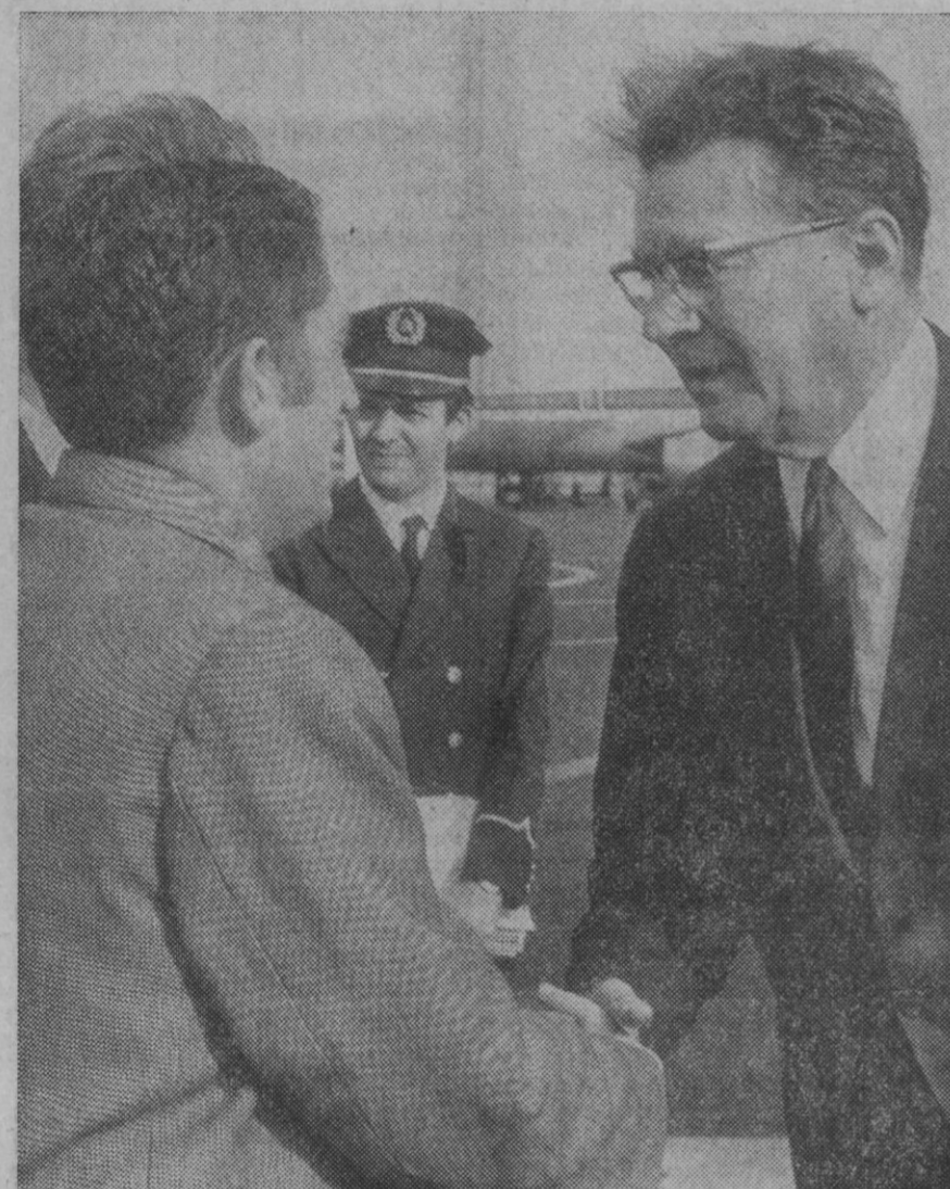
Madrid.—Ha llegado a Madrid, camino de Cuba, el vicepresidente del Gobierno húngaro, señor Ajtal, acompañado de los viceministros de Negocios Extranjeros y Comercio Exterior. En el aeropuerto fue recibido por el encargado de Negocios de Hungría en España.

Según las informaciones que circularon anoche, al fracasar el complot, Lin Piao y alguno de los conspiradores que secundaron su acción, intentaron escapar a la Unión Soviética en un avión de las fuerzas aéreas, el cual se estrelló en la República de Mongolia.—Efe-Upi.