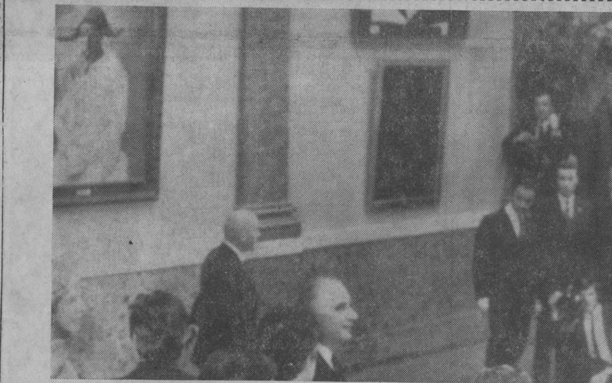
París.—El presidente Georges Pompidou y su esposa asisten en el museo del Louvre a la inauguración de la exposición de obras de Picasso con motivo del 90 cumpleaños del famoso pintor. Es la primera vez que un pintor en vida expone en dicho museo francés.—(Telefoto AP-Europa Press)

Madrid, 23.—Queda prohibida la pesca de la trucha marina o «reo» (salmotrutta trutta), así como su circulación y venta en todo el territorio nacional, durante el período de veda de pesca fluvial de la indicada especie, según orden del Ministerio de Comercio que inserta hoy el «Boletín Oficial del Estado».—Cifra.