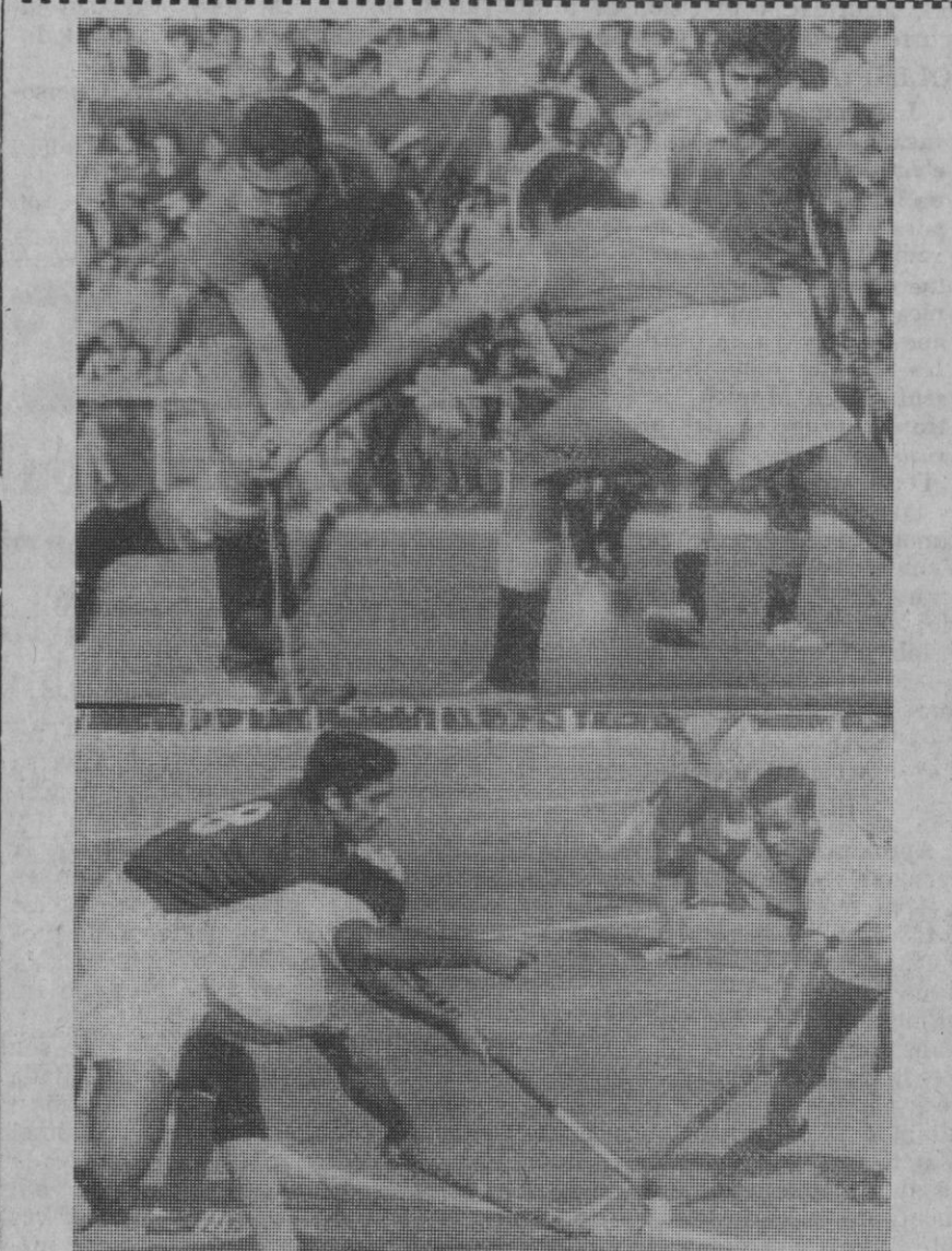
Barcelona.—Arriba, un momento del encuentro de hockey sobre hierba entre las selecciones de España y Kenia. Venció España por 1-0. Abajo, partido Pakistán-India, que se adjudicaron los paquistaníes por 2-1. Mañana, domingo, por la mañana españoles y paquistaníes jugarán la final de esta primera copa del mundo de hockey.

Ciudad del Vaticano, 23.—La 26 sesión plenaria del Sínodo de los obispos se inició esta mañana a las nueve con la presencia del cardenal ecuatoriano Muñoz Vega. El Papa Pablo VI está hoy presente en el aula sinodal. La asamblea escuchará en la jornada nuevas exposiciones sobre el tema "La justicia en el mundo" sobre el cual hay todavía 49 oradores en lista.—Efe.