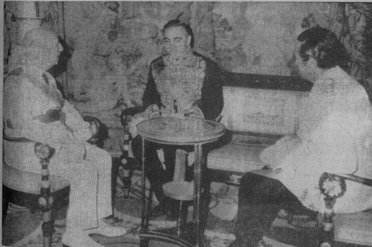
Madrid.—El Jefe del Estado, Generalísimo Franco, conversa con el nuevo embajador de Persia en Madrid, capitán general Fereydoun Djan, después de la presentación de cartas credenciales, en el palacio real de Madrid.

Mao, aquejado de una grave dolencia cerebral, según se dice en Hong Kong