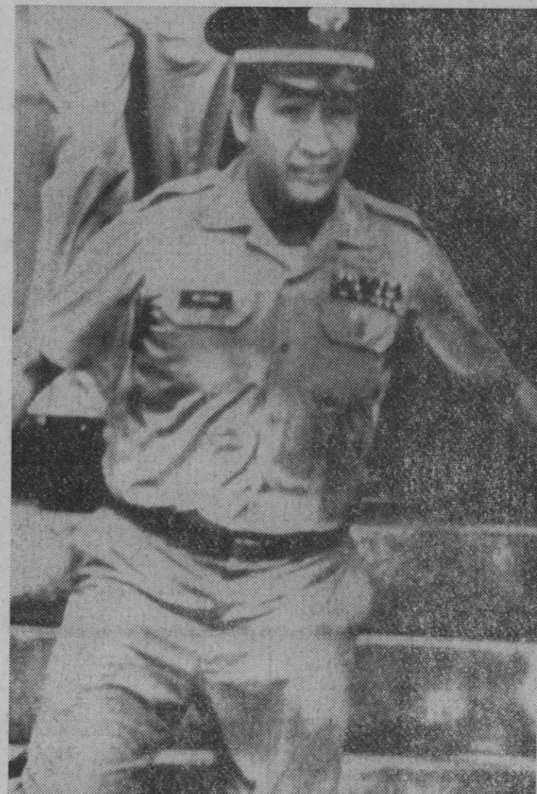
Fort MacPherson.—El capitán Ernest Medina sale hacia la tribuna militar para oír el veredicto en el juicio que contra él se sigue. Medina fue declarado inocente y descargado de toda culpa en la masacre de My Lai. Se van descubriendo inocentes pero, sería mucho pedir saber quién tiene la culpa.

En las mismas fuentes se indica que la suspensión de las importaciones es una congelación que afecta a todos los productos.