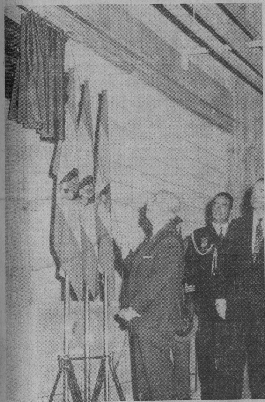
Burgos.—Su Excelencia el Jefe del Estado en la inauguración de la nueva central nuclear de Santa María de Garoña (Burgos), cuyo reactor nuclear es el de mayor potencia de la Europa occidental (460.000 kilowatios). Acompañaban al Jefe del Estado los ministros de Industria, Obras Públicas y comisario del Plan de Desarrollo, así como las primeras autoridades burgalesas.—(Telefoto Europa Press)

RELACIONES La entrevista Sánchez Bella-Masmudi, celebrada en el palacio gubernamental de La Casbah, duró aproximadamente una hora, efectuando ambos un amplio "tour d'horizon" sobre las relaciones hispano-tunecinas y los problemas de interés común.