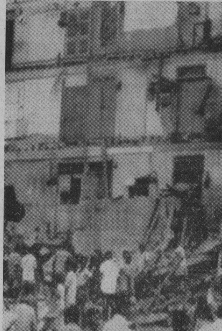
Bombay.—Una casa de principios de siglo se ha hundido en Bombay, matando a 22 personas (que se encontraban durmiendo) e hiriendo entre los escombros a otras 17. Cuatro personas están aún bajo los cascotes (se supone que también muertas)

Madrid, 22.—El próximo sorteo de la Lotería Nacional, que se realizará por el sistema tradicional, tendrá lugar el día 28 de septiembre, a las nueve de la mañana, en Madrid. Constará de trece series de 60.000 billetes cada una, al precio de 500 pesetas el billete y se distribuirán 21.000.000 de pesetas en 8.724 premios para cada serie.