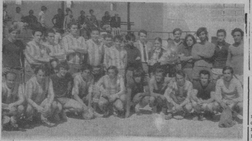
Por la mañana, dentro de los actos programados en honor de Santa Marta, un equipo de camareros se enfrentó al C. C. V. de San Rafael en partido de fútbol.