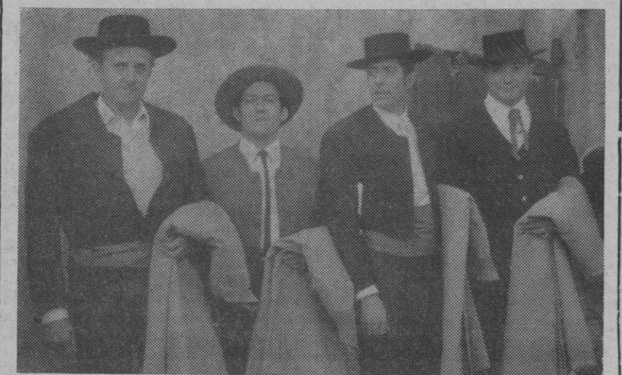
Los cuatro matadores «serios» de la becerrada de ayer