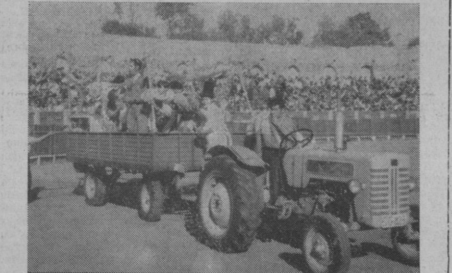
En vez de una carroza tirada por caballos, los de la «Bufa» desfilaron por el ruedo sobre este remolque