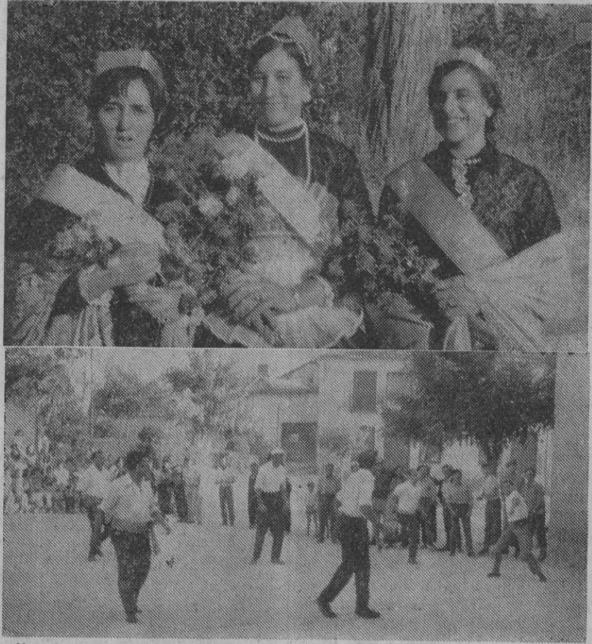
Arriba, la «reina» de las fiestas y sus damas de honor; abajo, un momento del partido de pelota a mano que se jugó en el frontón de Valverde.