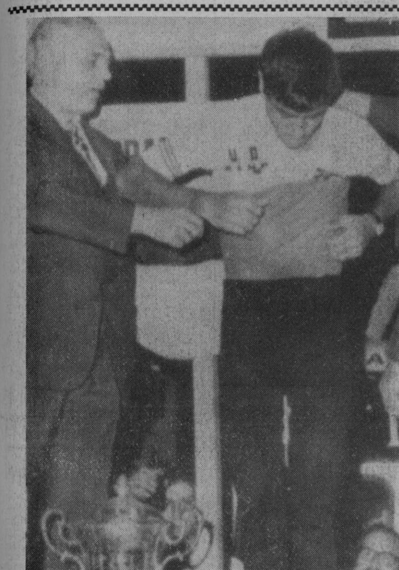
Barcelona.—El español Luis Ocaña, que se impuso en el tramo contra reloj de la última etapa de la Vuelta a Cataluña, ha sido el ganador de la prueba, desbancando en última instancia al francés Labourdette.—(Telefoto Europa Press)

San Sebastián, 20.—El Jefe del Estado y su esposa, ofrecieron a primera hora de esta tarde, en el palacio de Ayete, un almuerzo a las primeras autoridades de Guipúzcoa, que asistieron acompañadas de sus esposas.