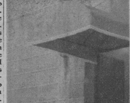
Los dos protagonistas de la película

En síntesis, lo que está previsto que «ocurra» a lo largo de la película será, poco más o menos, esto: «Ella» y «El», turistas americanos, vienen a España, formando parte de una excursión que va a realizar un gran «tour» por nuestro país; ambos son estudiantes. «Ella» es una mujer que va dejando atrás su juventud, y «El» es casi un «boy». Por una serie de circunstancias fortuitas, la mujer y el hombre abandonan, por separado, la expedición. Pero se encuentran en el interior de un autocar. Entonces interviene «Cupido», hace una de las suyas, y ¡zas!, flechazo al canto. A partir de ese momento, ambos inician una vida nueva por el resto de España que aún les falta por conocer; el amor crece... y llega el «terrible» momento de tener que confesar, «Ella», que está gravemente enferma... A partir de este momento la pantalla reflejará algunas escenas que harán tener al espectador el convencimiento de que la mujer ha muerto... De ahí el título—ya decimos que provisional—de «El viudo».