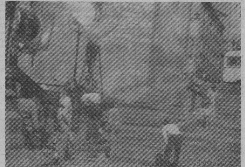
Un momento del rodaje

manecer en nuestra provincia hasta el martes o miércoles próximo, para captar escenas en la capital, en Pedraza y en Collado Hermoso. Los interiores se realizarán en los estudios «Verona», de Madrid, y ya se han tomado otros exteriores en pue-