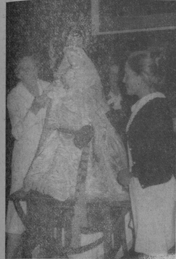
Varias de las camareras de la Virgen de la Fuencisla, proceden a vestir la imagen minutos antes de que ésta fue trasladada desde su santuario a la catedral, en la que permanecerá hasta el próximo día 26

minutos antes de las siete y media, portada por dos de sus camareras y miembros de la Cofradía de su nombre. Después fue instalada en un coche descubierto, que cubrió el reco-