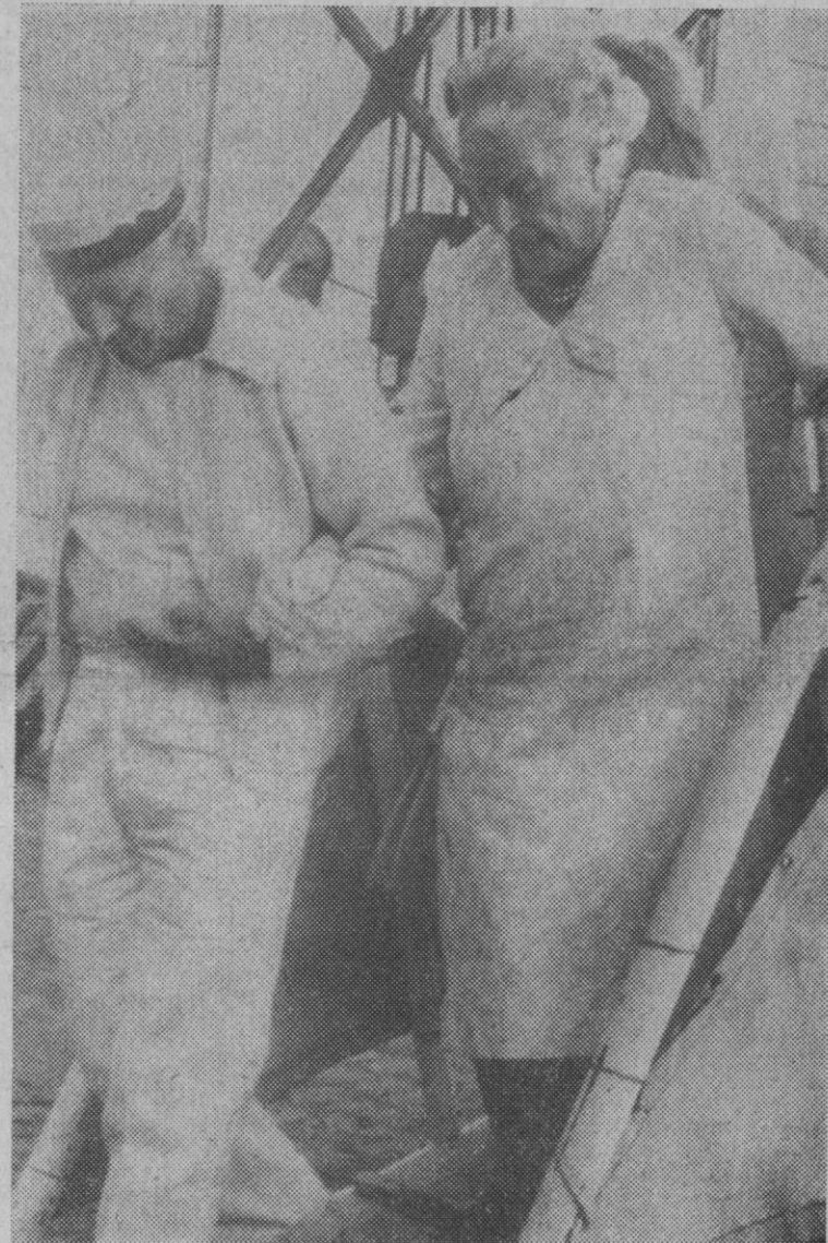
Vigo (Pontevedra).—Llegó a Vigo, a bordo del buque «Chusan», de bandera inglesa, la baronesa Clementina Spencer, viuda de Winston Churchill. En la foto en el momento de bajar a tierra, del brazo de uno de los marinos de la dotación del barco.

Temperaturas extremas de España: Máxima de 37 grados en Córdoba y Badajoz, y mínima de 10 grados en Lugo y Vitoria.—Cifra.