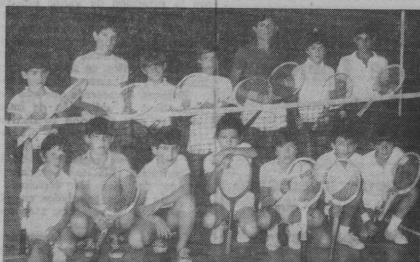
Grupo de alumnos que han asistido al primer cursillo sobre tenis

El delegado provincial de la Juventud clausuró ayer los dos últimos cursillos de verano de promoción deportiva, organizados por la Sección de Actividades Deportivas de la Juventud.