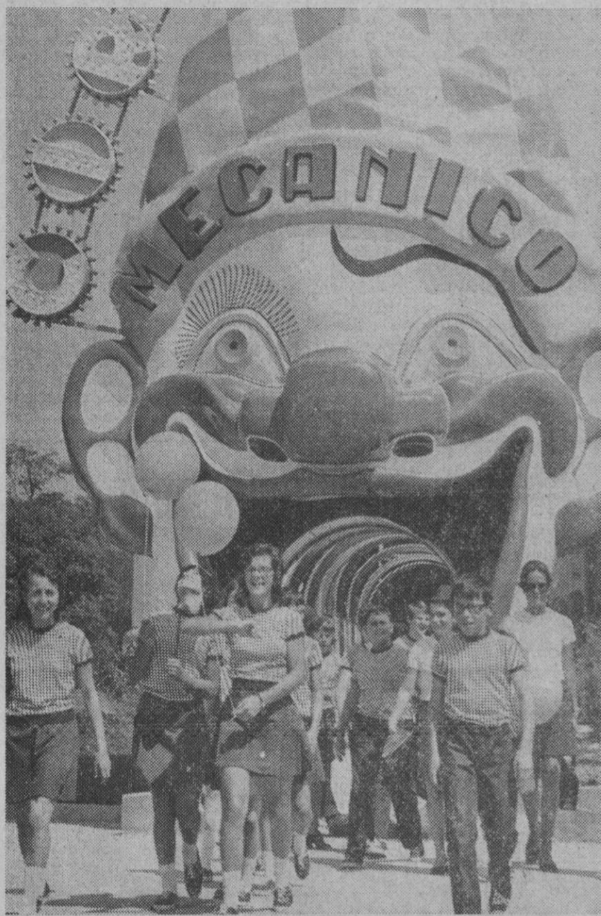
Madrid.—Nuevamente los pequeños «héroe» que este año componen la IX edición de la Operación Plus Ultra han visitado el Parque de Atracciones de Madrid y aquí les vemos contentos y felices al iniciarse su viaje, ya todos reunidos. Mañana será su presentación.

OBJETIVO: Proseguir la exploración del satélite de la Tierra