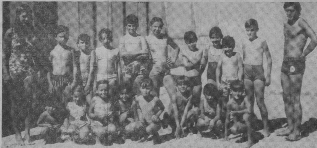
Los nuevos «tritonos» posan para el fotógrafo.