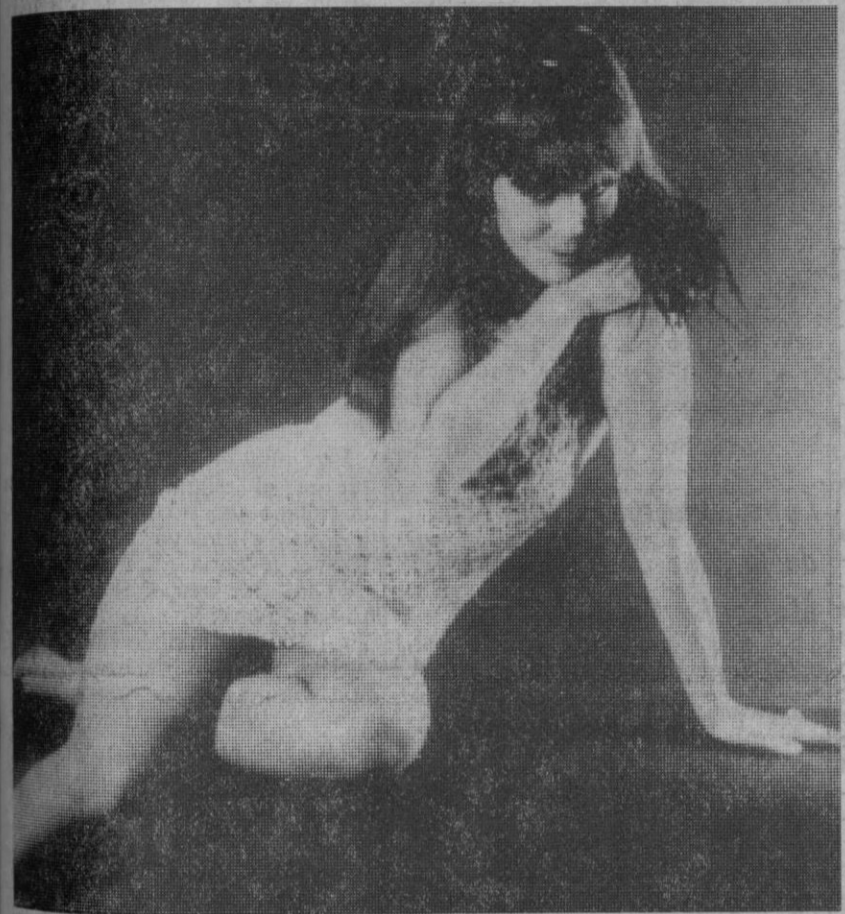
Ella es Ann Margret, que había caído en la pendiente del olvido, después de ser descubiertas sus piernas en «Cita en Las Vegas» y su talento en «El último homicidio». Había olvidado sus películas mediocres y quiso apartarse del cine. Ahora, y gracias a Mike Nichols, ha vuelto a lograr un rotundo éxito en el rodaje de «Conocimiento carnal».

Según ella, las Facultades de Ciencias de la Información podrán impartir las enseñanzas correspondientes a Periodismo, Cinematografía, Televisión, Radio y Publicidad. Cuanto abarque la totalidad de estas enseñanzas estará dividida en tres secciones o ramas que se denominarán respectivamente: de Periodismo, de Ciencia de la Imagen Visual y Auditiva y de Publicidad.—Cifra.