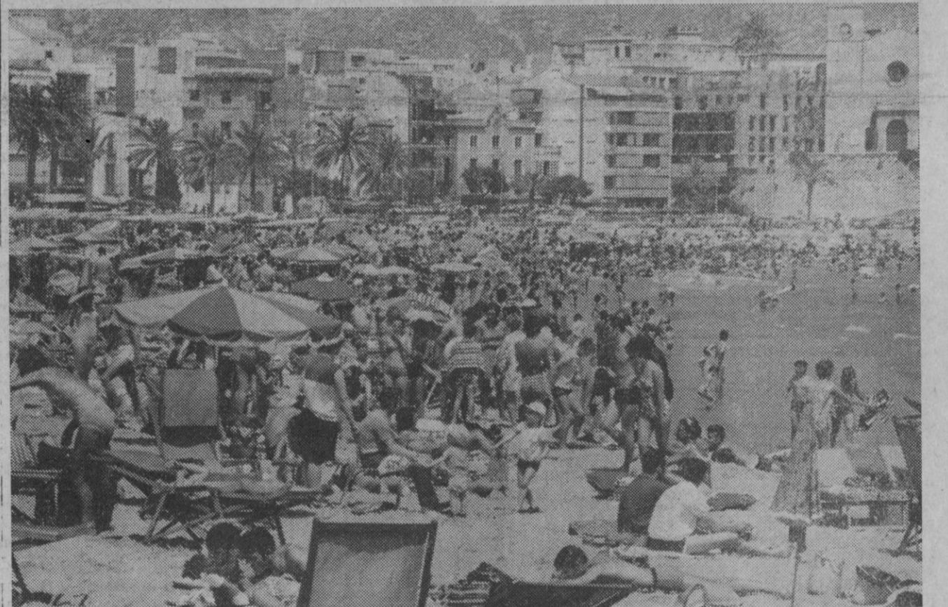
España es, junto a Grecia, el país más barato de Europa para el turismo. Prueba de ello son los millones de visitantes que todos los años llegan a nuestro país. Fotos como esta de la playa de Sitges, en la Costa Brava, son fáciles de obtener en cualquiera de las de nuestro litoral.

Madrid, 26.—La comisión permanente del Episcopado español se ha reunido a las once de esta mañana en la residencia de las operarias paraguayas de Madrid bajo la presidencia del cardenal arzobispo de Toledo y administrador apostólico de la diócesis madrileña, doctor Vicente Enrique y Tarancón. El objeto de esta reunión es el estudio de la temática y metodología de la asamblea nacional conjunta de obispos y sacerdotes que del 13 al 18 de septiembre se celebrará en el Palacio de Congresos y Exposiciones del Ministerio de Información y Turismo.—Cifra.