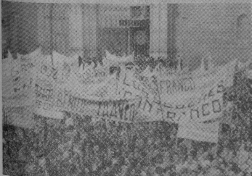
Toledo.—El jefe del Estado convivió con los toledanos después de inaugurar y visitar diversas realizaciones como un nuevo centro emisor instalado en Noblejas y el polígono industrial de la nueva factoría Standard. Los toledanos le tributaron una calurosísima acogida.