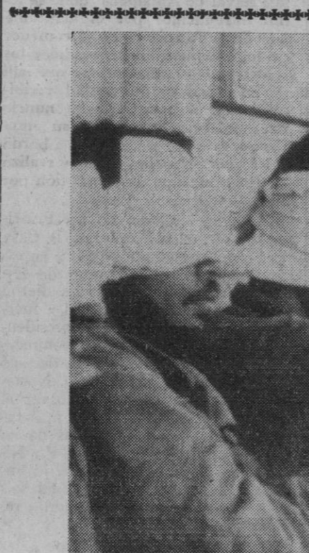
Israel.—Un grupo de soldados de las guerrillas árabes, con los ojos vendados, son vigilados por un soldado israelí. Los guerrilleros fueron capturados cruzando la frontera israelí cuando, aparentemente huía del duro ataque de las tropas de Hussein sobre los guerrilleros palestinos y en el norte de Jordania.—(Telefoto Europa Press)

La factoría Standard Eléctrica, S. (Continúa en la página 4)