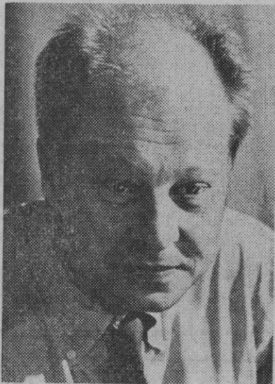
Krister Wickman, nuevo ministro de Asuntos Exteriores de Suecia