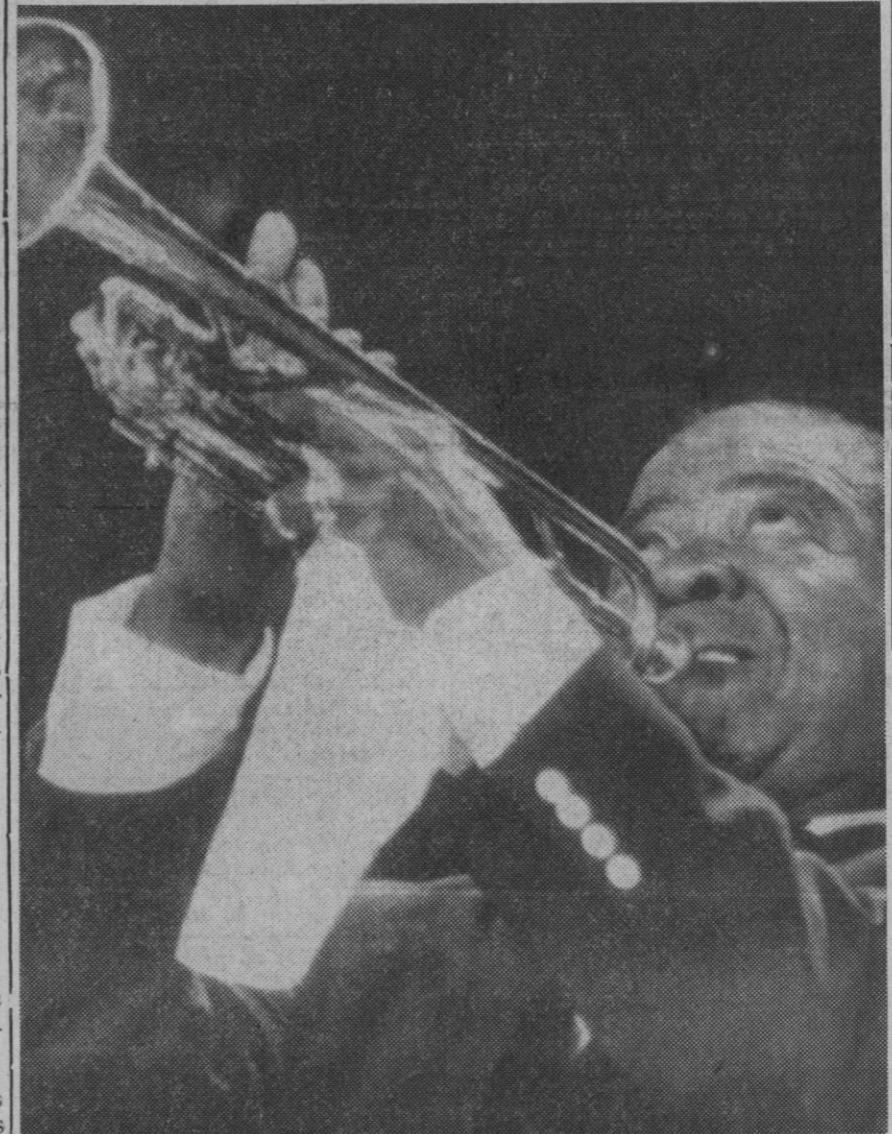
«El rey de la trompeta» ha muerto. Louis Armstrong llevaba varios meses enfermo. Ahora ha muerto el famoso músico en Nueva York.

La entidad bancaria ha encargado a un grupo de catedráticos de la Facultad de Veterinaria de León, que estudie el reglamento y temas concretos de investigación, que en breve será dado a conocer.—Cifra.