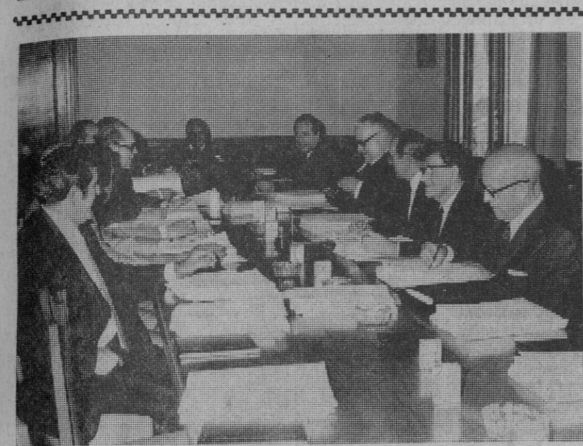
Según informamos en la sección de local, hoy se han reunido en nuestra ciudad los componentes de la comisión del Consejo de Administración del I. N. P. La fotografía corresponde a uno de los momentos de la sesión de trabajo celebrada.

Londres, 7.—El Gobierno británico expuso su convencimiento de que el destino de Gran Bretaña se encuentra en Europa en el Libro Blanco (documento oficial) publicado hoy que contiene los pormenores de las condiciones y beneficios que reportará el ingreso de este país en el Mercado Común Europeo.