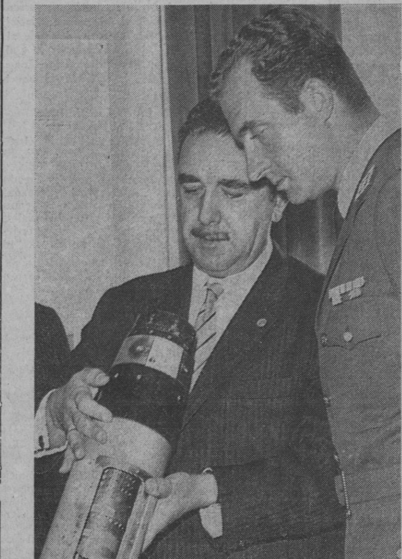
Madrid.—El Príncipe de España, a quien acompañaba entre otras personalidades el ministro del Aire, teniente general Salvador y Díaz Benjumea, ha recorrido detenidamente, como ayer informamos, las instalaciones del Instituto Nacional de Técnica Aeroespacial (INTA).

La razón de ello se apoya en la disposición transitoria 2-ª de la ley general de Educación, según la cual los estudios específicos mercantiles serán desarrollados en todos los ciclos universitarios.