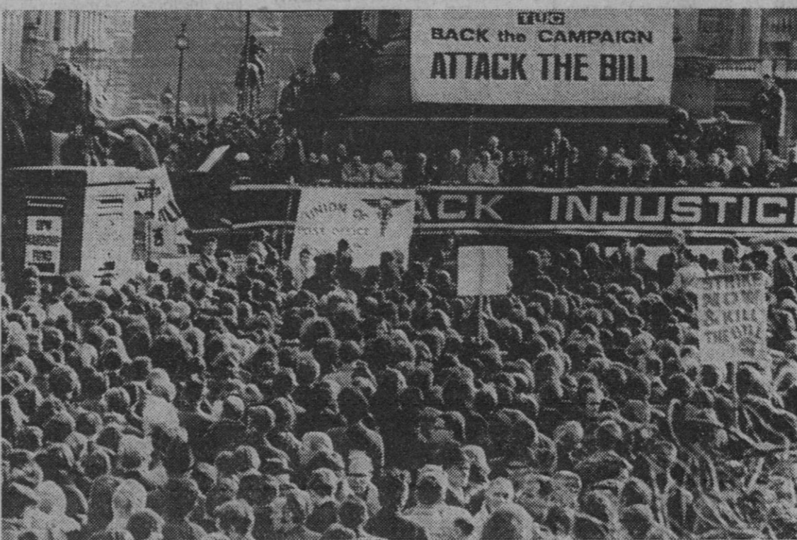
Londres.—Una gigantesca manifestación ha tenido lugar en Trafalgar Square, donde se protestaba por las medidas industriales del Gobierno.

Aunque se han manifestado alrede- (Continúa en la página 4.)