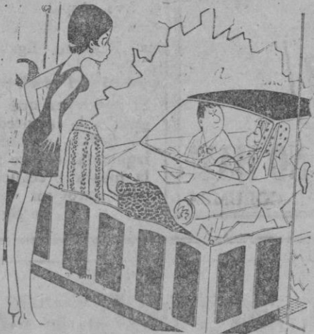
—Podríamos aprovechar para comprar algo...

Distribuidor exclusivo: Casa Solera. Corpus, 7