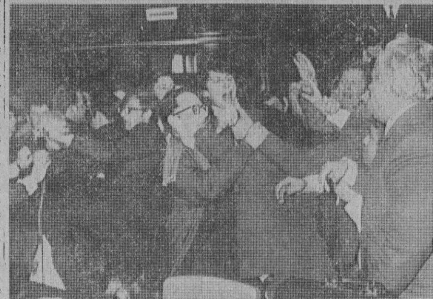
Bruselas.—Arriba, una de las vacas que los agricultores introdujeron en la reunión de ministros de Agricultura de la CEE, en señal de protesta por la política de la Comunidad en este sector. Abajo, pérdidas las buenas maneras, el salón de sesiones de Bruselas se convirtió en un "ring". Vacas, puñetazos y otras lindezas. Ciertamente esta fue una reunión "muy europea" de la Comunidad.