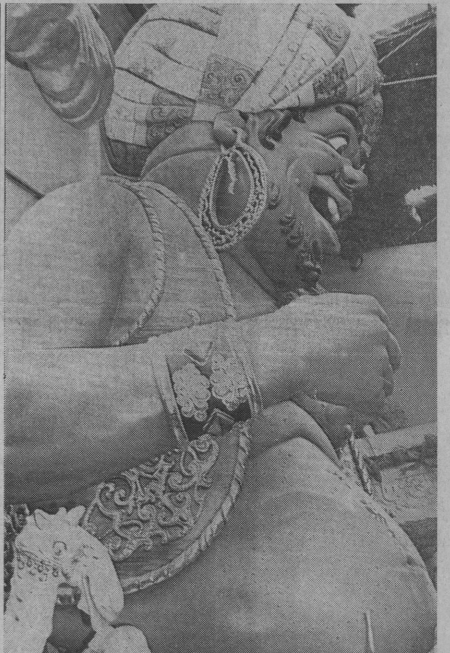
Valencia.—Esta es una de las fallas que están tomando cuerpo en los talleres falleros de los diferentes barrios de Valencia. La idea satírica de los artistas falleros va plasmada en esta tangible realidad para la noche de San José.

Madrid, 17.—El Príncipe de España ha presidido en la mañana de hoy un ejercicio táctico en la Escuela de Estado Mayor del Ejército. El ejercicio, desarrollado por los alumnos del centro, versaba sobre funcionamiento de un Estado Mayor. Presenciaron asimismo el ejercicio táctico los coronales que asisten al sexto curso de mandos superiores del mencionado centro.—Cifra.