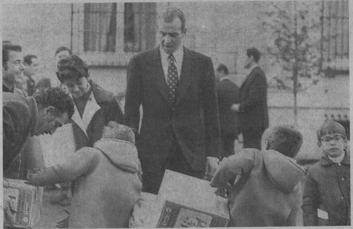
Madrid.—Con motivo de la Feria del Juguete, de la que la princesa Elena hija de los Príncipes de España, fue reina, se han recibido en el palacio de la Zarzuela un camión cargado de regalos para los principitos. Estos han decidido repartir los juguetes con los niños de todo el personal que presta servicio en el palacio. Esta mañana se ha celebrado el simpático acto.

El popular diario londinense «Daily Mirror» publicó en su primera página de hoy una fotografía de lord Snowdon acompañado a lady Jacqueline, que tiene 24 años. Esta es la segunda vez en dos semanas que la prensa norteamericana ha informado sobre dificultades en el matrimonio de la Princesa Margarita y lord Snowdon.