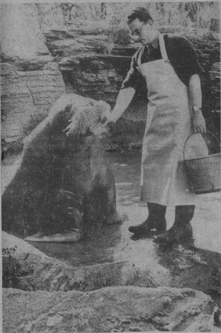
Esta es una morsa que toca armónica. Pero sólo antes de que la den la comida. Pensará que si no lo hace, se quedará en ayunas. El animal es uno de los inquilinos del "zoo" de Hamburgo.

cerebro", donde se realizan directamente todas las operaciones de análisis, en vez de como se hizo en la primera etapa, remitir los datos a París, hacen que todo haga suponer que la explotación va a ser rentable, aún no siendo de óptima calidad el petróleo que exista en estos terrenos.—Cifra.