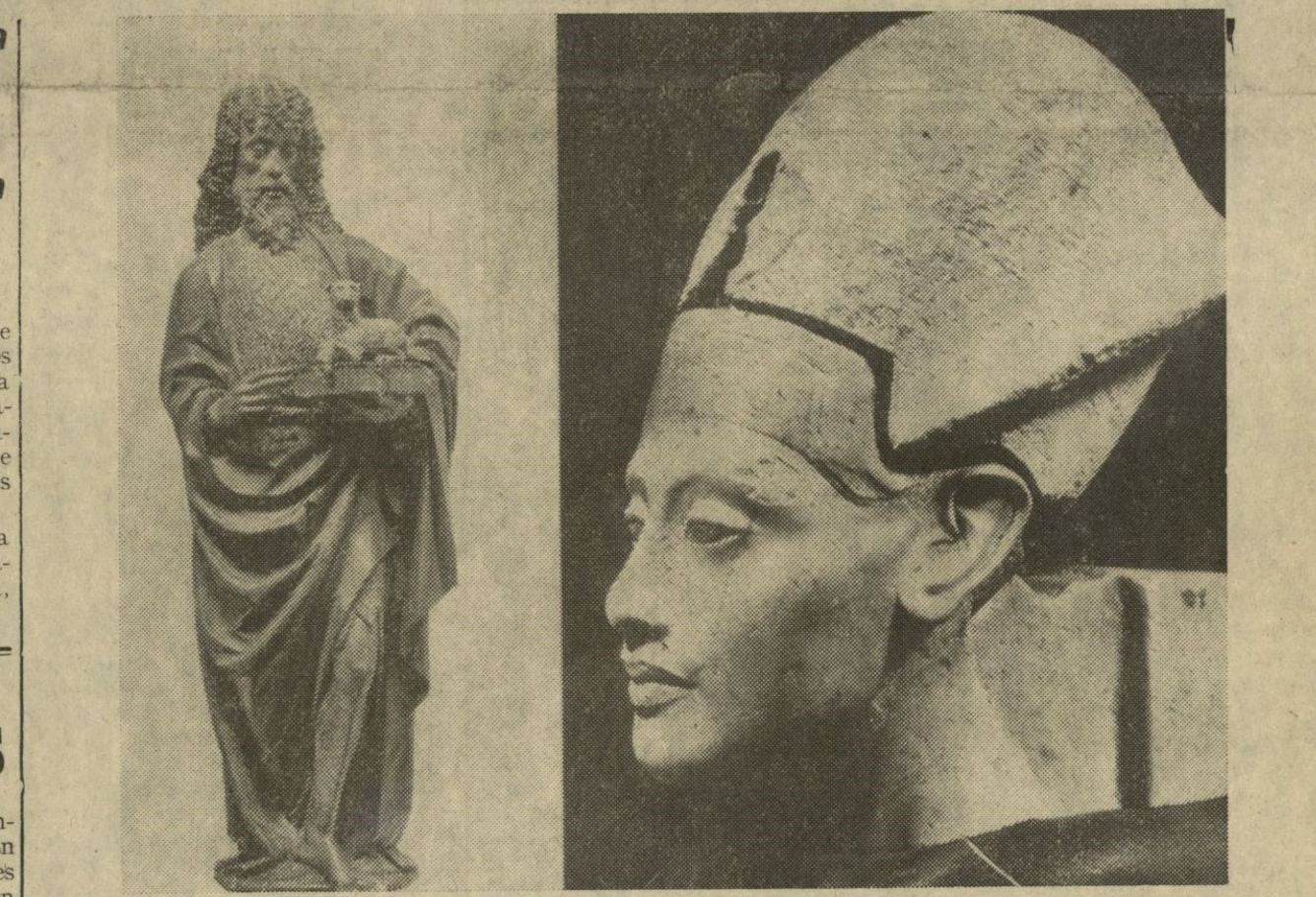
Munich.—Por quinceava vez tuvo lugar en Munich la Feria Alemana de Arte y Antigüedades, que en el transcurso de los años se transformó en la exposición de venta más importante para coleccionistas y comerciantes internacionales en la República Federal de Alemania. El objeto más precioso de la feria jubilar fue la escultura de piedra, pintada, de veintidós centímetros de altura, que representa al rey egipcio Amenofis IV, Akhenatón, con la corona azul, de la dieciochava dinastía, 1365 antes de J. C. (foto derecha). Con quinientos mil marcos fue la pieza única más cara jamás ofrecida en Munich. Entre las rarezas a precios razonables de la región meridional de Alemania figuraba San Juan Bautista (a la izquierda), de 99,5 centímetros de altura, figura tallada de madera de tilo alrededor del año mil quinientos.

Escasos minutos antes de que comenzasen las doce campanadas, comenzó a nevar y siguió nevando durante una hora. Más tarde llovió y el agua barrió en parte la nieve de las calles.—Cifra.