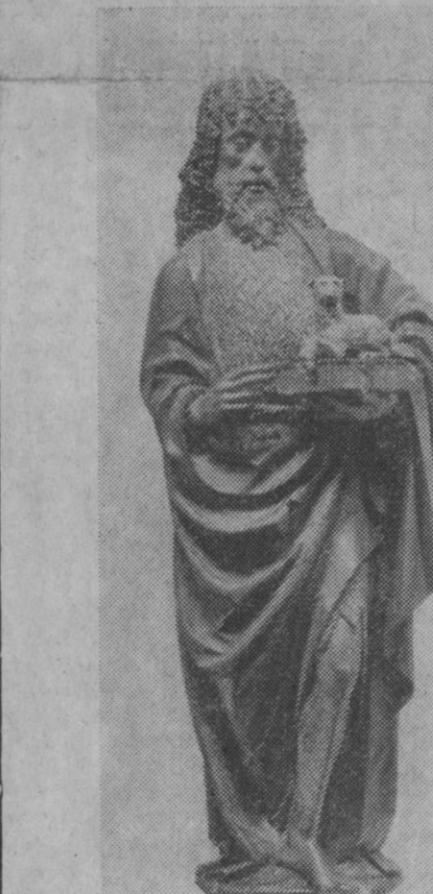
Munich.—Por quinceava vez tuvo lugar en Munich la Feria Alemana de Arte y Antigüedades, que en el transcurso de los años se transformó en la exposición de venta más importante para coleccionistas y comerciantes internacionales en la República Federal de Alemania. El objeto más precioso de la feria jubilar fue la escultura de piedra, pintada, de veintiséis centímetros de altura, que representa al rey egipcio Amenofis IV, Akhenatón, con la corona azul, de la dieciochoava dinastía, 1365 antes de J. C. (foto derecha). Con quinientos mil marcos fue la pieza única más cara jamás ofrecida en Munich. Entre las rarezas a precios razonables de la región meridional de Alemania figuraba San Juan Bautista (a la izquierda), de 99,5 centímetros de altura, figura tallada de madera de tilo alrededor del año mil quinientos.

Escasos minutos antes de que sonasen las doce campanadas, comenzó a nevar y siguió nevando durante una hora. Más tarde llovió y el agua barrió en parte la nieve de las calles.—Cifra.