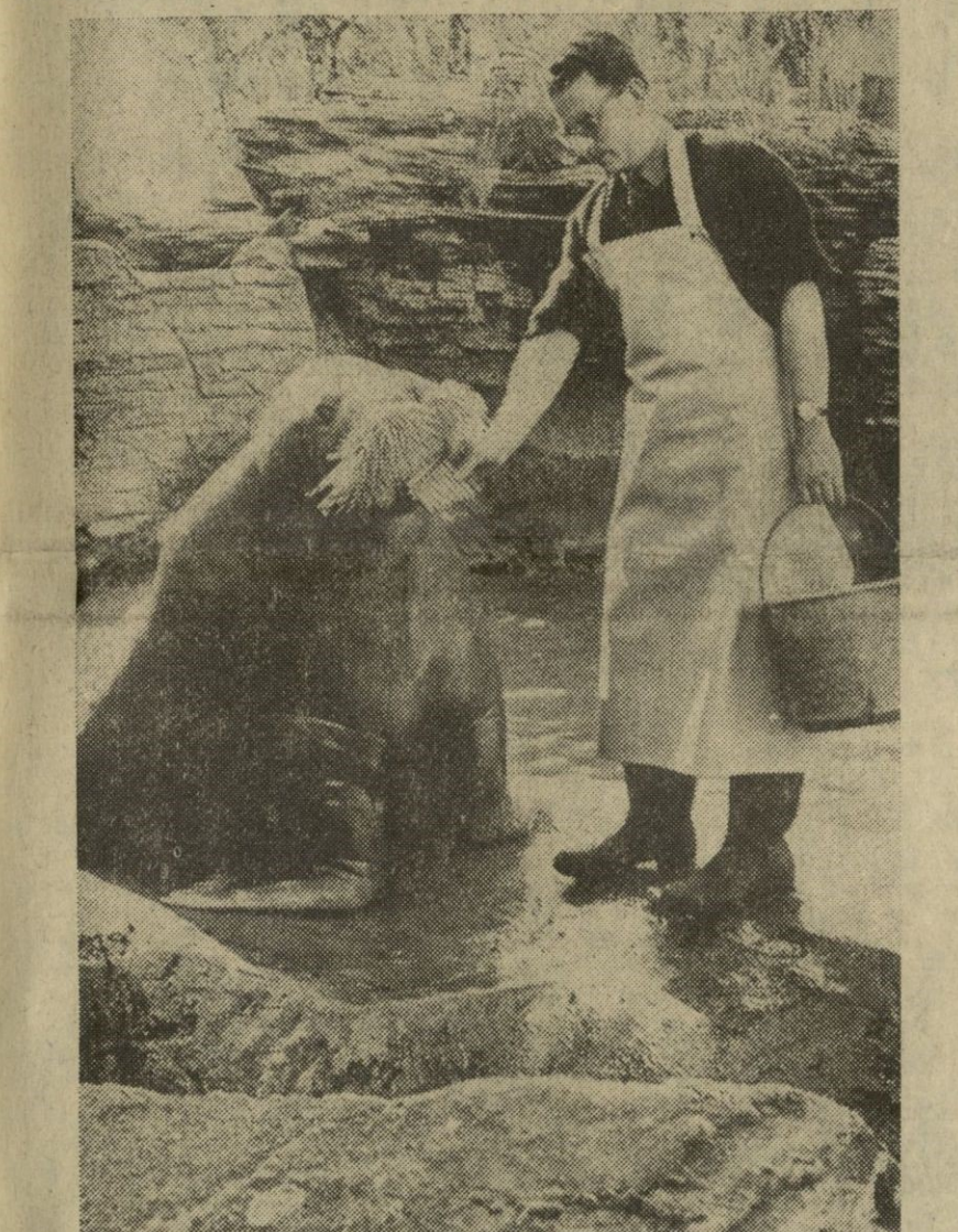
Esta es una morsa que toca armónica. Pero sólo antes de que la den la comida. Pensará que si no lo hace, se quedará en ayunas. El animal es uno de los inquilinos del "zoo" de Hamburgo.