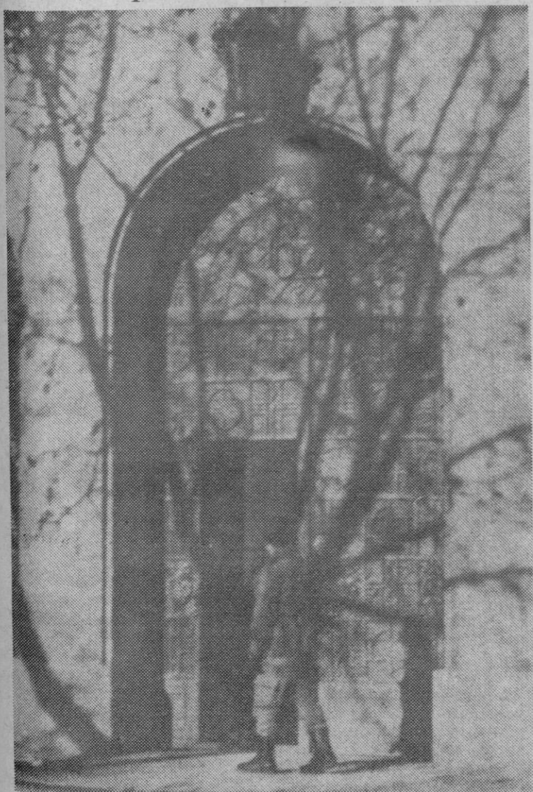
Burgos.—Un soldado monta guardia ante el edificio en el que el jurado del Consejo de Guerra se encuentra deliberando para dar su veredicto sobre los 16 activistas de la ETA que han sido juzgados.

San Sebastián, 12.—Los abogados defensores en el Consejo de Guerra de Burgos, no han recibido, hasta el momento, la citación para conocer la sentencia del tribunal juzgador. Se les indicó, antes de abandonar la capital burgalesa, que estuvieran pendientes de recibir la comunicación, que se les enviaría por vía telegráfica, pero todavía no ha llegado ésta a su poder. Esto hace suponer que, como muy pronto, la sentencia no se conocerá hasta el lunes. No obstante, se rumorea en San Sebastián que lo más probable es que sea el martes o el miércoles, cuando se haga pública.—Cifra.