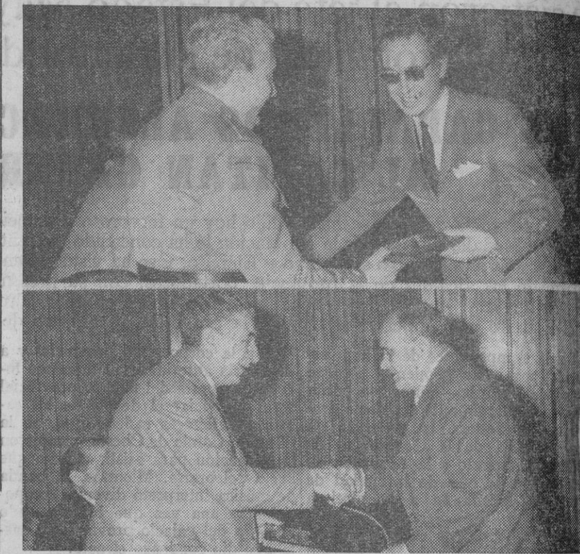
Los premiados en el concurso de guiones y en el de pintura reciben sus galardones del coronel de la Academia y del alcalde.