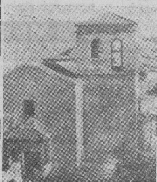
Esta es la iglesia de Valdevacas que, según la información que ayer se publicaba, está en venta...