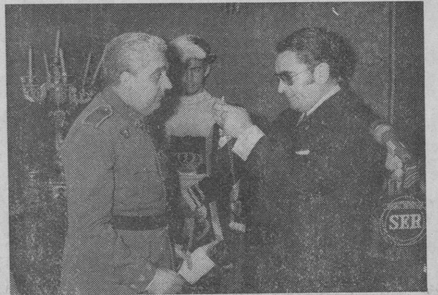
El presidente de la Diputación en el momento de imponer al coronel de la Academia la Medalla de Oro de la Provincia.