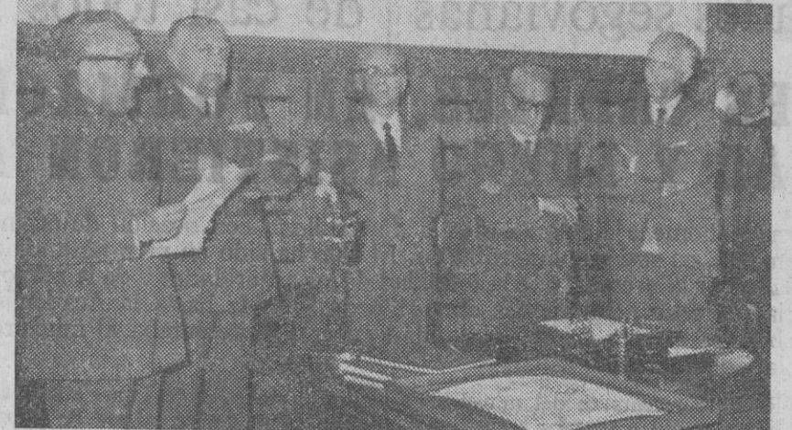
El coronel de la Academia agradece la distinción que hizo al centro la Organización Sindical, cuyo delegado había pronunciado anteriormente unas sentidas frases de dedicación.