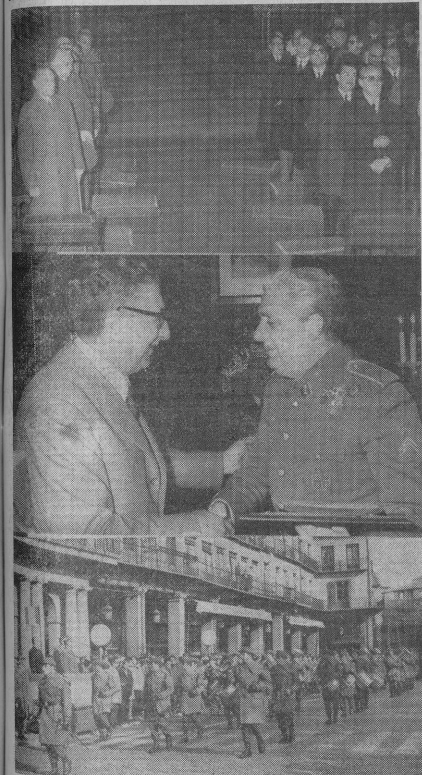
Estas fotografías, corresponden a los actos celebrados hoy con motivo del I Día de la Academia de Artillería de los que informamos ampliamente en página segunda. Arriba: las autoridades locales durante la misa en la catedral. Centro: el alcalde entrega al director de la Academia una placa conmemorativa. Abajo: desfile de la batería de honor, finalizada la misa, ante el capitán general y demás autoridades en la plaza Mayor.

A las 2,25 ha terminado la quinta reunión del pleno del Supremo relacionada con el asunto «Matesa». La reunión, por tanto, ha tenido una duración de una hora 45 minutos.—Cifra.