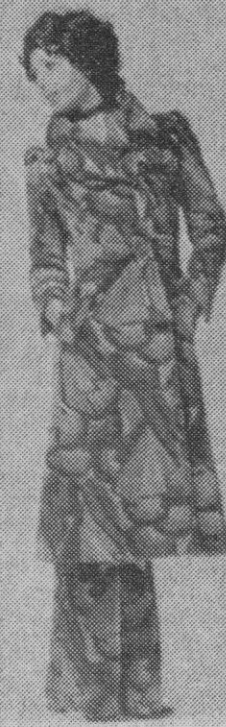
Conjunto de abrigo midi y pantalón realizado en terciopelo de puro algodón gofrado y con estampado de motivos cubistas en tonos castaño y ladrillo. Modelo GUDULE, Francia.

imaginación se ha desbordado creando bonitos dibujos laterales que producen efectos de mayor dimensión. Lo mismo ocurre con las medias normalizadas que se benefician de experiencias anteriores y permiten una extrema fantasía en el trenzado de sus hilos.