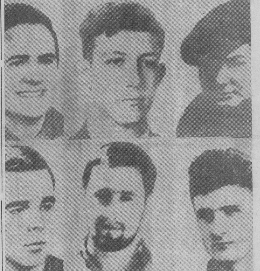
Estos son los seis de los procesados en el consejo de guerra sumarísimo en Burgos, para los que el fiscal ha pedido la pena de muerte a más de varios años de prisión. De arriba a abajo y de izquierda a derecha: Francisco Javier Izko de la Iglesia, Eduardo Uriarte Romero, Mario Onaindía Natxiondo, Joaquín Gorostidi Artola, José María Dorronsoro Zeberio y Francisco Javier Larena Martín.

Temperaturas extremas de España: 20 grados en Almería y Murcia y mínima de tres grados bajo cero en Ciudad Real.—Cifra.