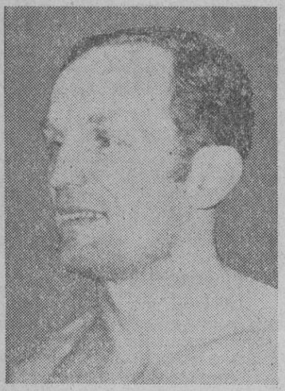
Henry Cooper, boxeador inglés, de treinta y seis años, que en su reciente combate con el español Urrain, ha reconquistado el título de campeón de Europa de los pesos pesados

Madrid, 17.—«La afluencia de votantes en toda España con motivo de las elecciones municipales ha sido muy superior a lo que teníamos previsto, ya que han acudido a las urnas del 40 al 50 por 100 del censo electoral», manifestó el ministro de la Gobernación, don Tomás Garicano Goñi, a los periodistas a primera hora de la noche, convocados para darles unas primeras impresiones sobre las elecciones municipales llevadas a cabo hoy en toda España.