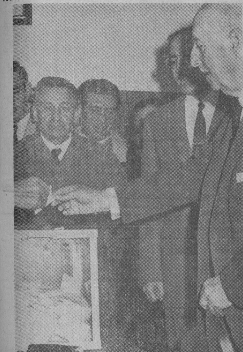
El Pardo (Madrid).—Su Excelencia el Jefe del Estado deposita su voto en el colegio electoral de El Pardo con motivo de las elecciones municipales.

Sacó las papeletas del sorteo la actriz de cine y cantante Mireille Mathieu.—Alfil.