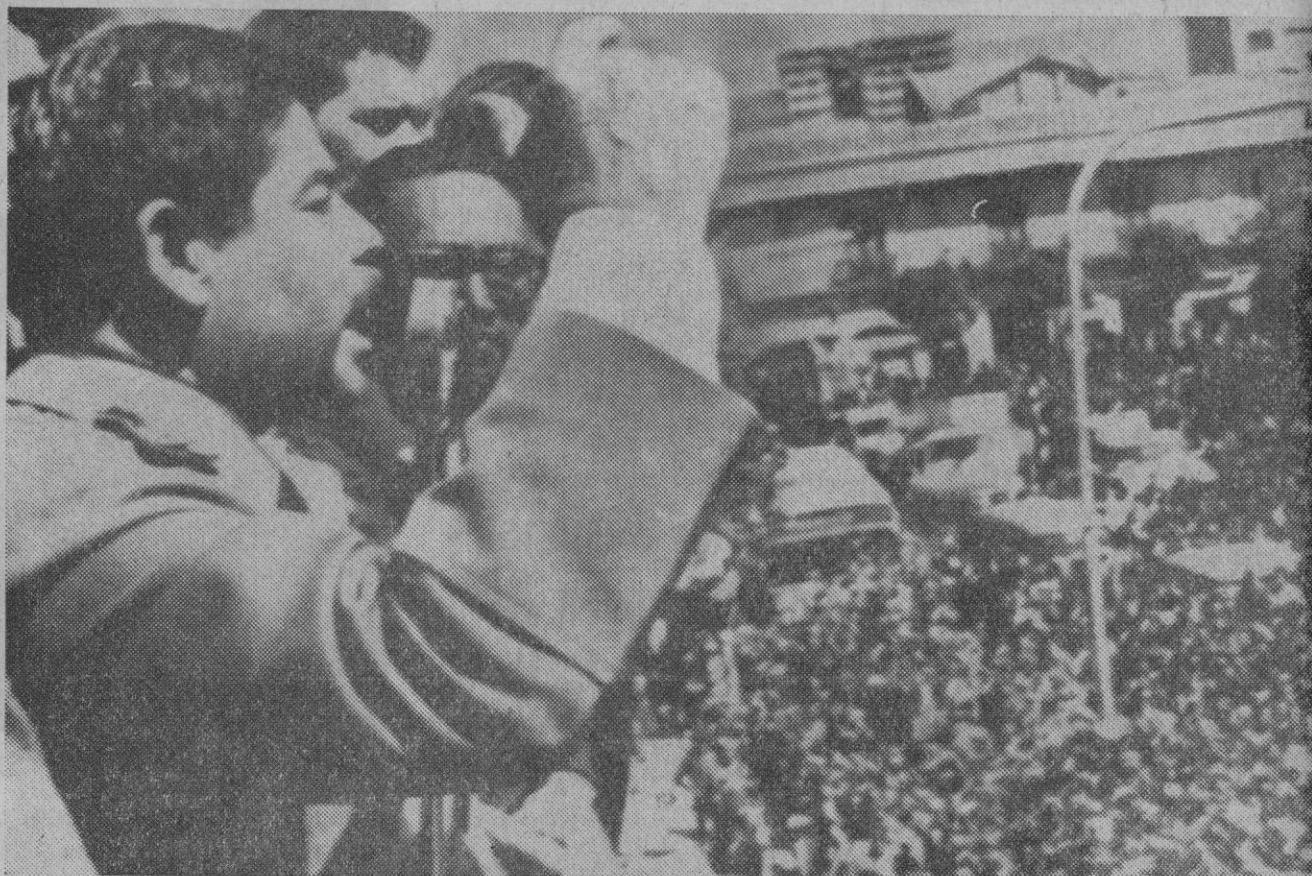
La Paz (Bolivia).—El general izquierdista Juan José Torres, con el brazo levantado, se dirige a la multitud congregada ante el palacio del Gobierno, en La Paz; poco después de haber barrido a la oposición derechista que intentaba disputarle la presidencia del país. Torres prometió a la multitud, que le aclamaba, un "gobierno nacionalista popular".

lo que corresponde a cada jornada teórica de trabajo, y se distribuirá entre los sujetos pasivos en función de las jornadas teóricas aplicables a cada uno. No obstante, en los próximos (Continúa en la página 6)