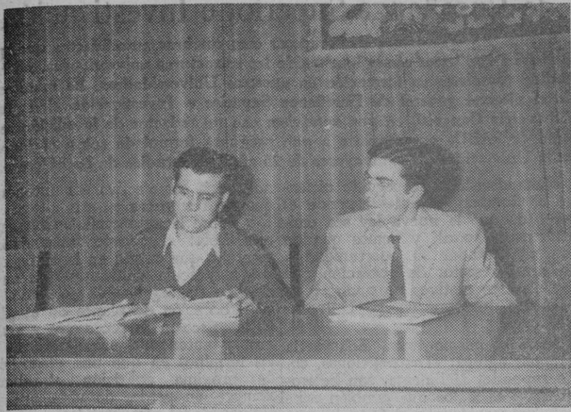
Los dos conferenciantes.

A las ocho de la tarde se celebró ayer en el salón de actos de la Caja de Ahorros la anunciada revista hablada dentro de la I Semana Cultural de Otoño, organizada por Teatro Popular de Segovia.