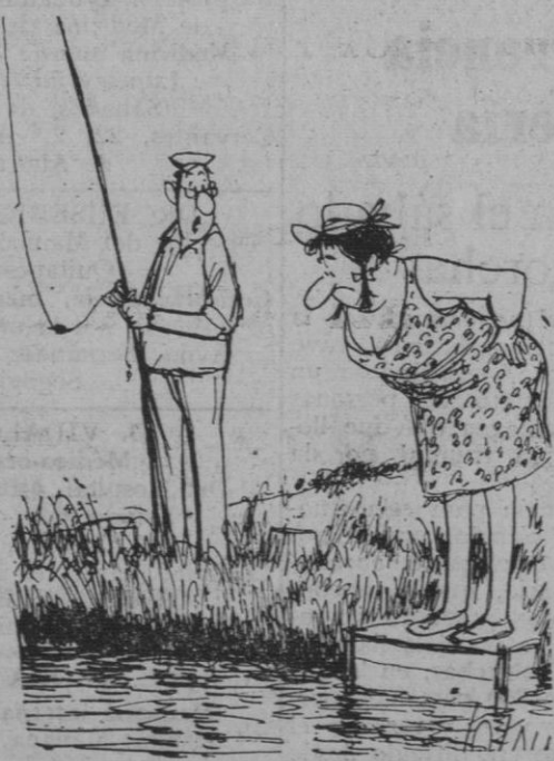
—No te asomes, les vas a asustar...

Distribuidor exclusivo: CASA SOLERA Corpus, /