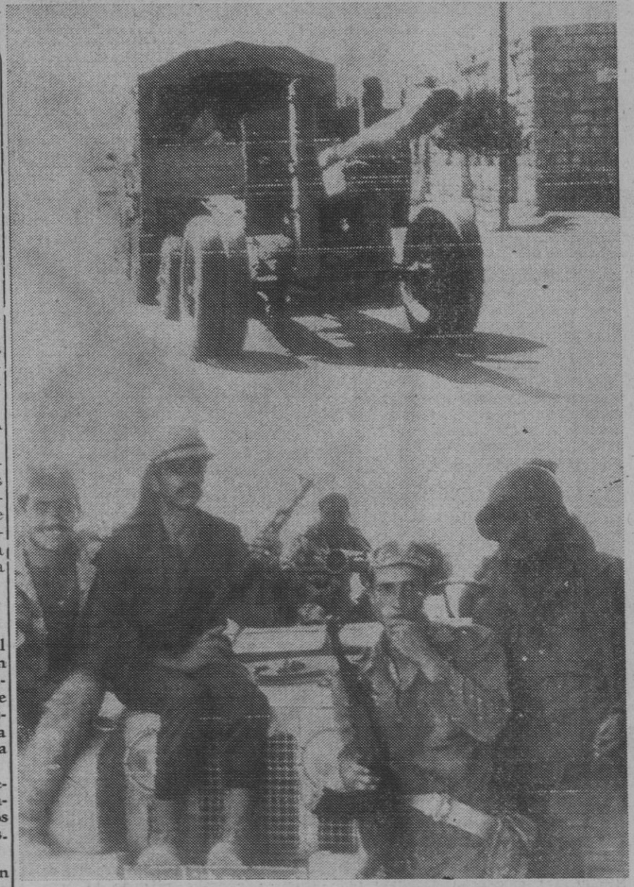
Arriba: cañones sirios son remolcados pasando la frontera sirio-jordana, hacia la ciudad de Ramtha. Tropas sirias invadieron territorio jordano para apoyar a los guerrilleros palestinos en lucha con Hussein.

«Para que las armas comiencen a callar—continúa—es necesario, ante todo, que se reconozca el derecho del pueblo palestino a la existencia. La paz está hecha de comprensión y no podría reposar sobre la asfixia y la extinción.»