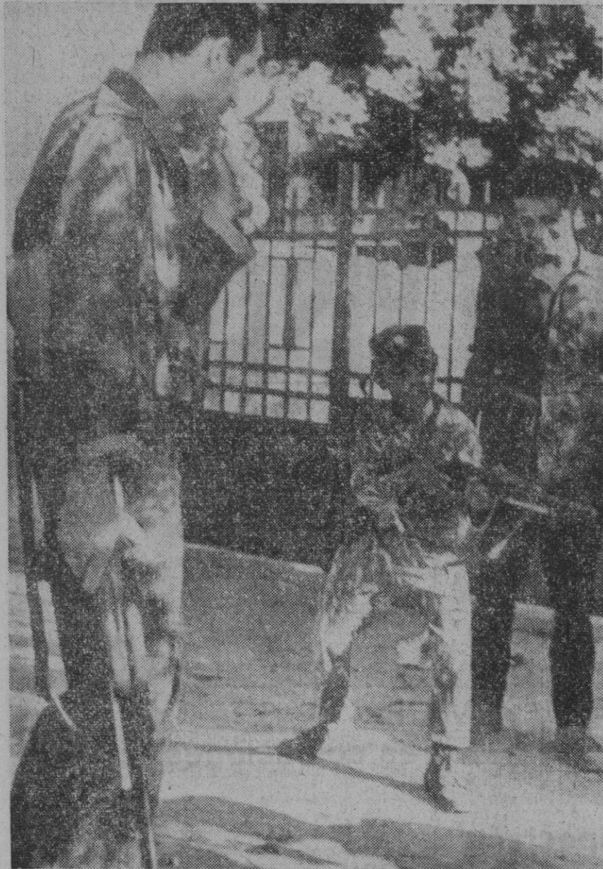
Beirut.—Un muchacho vestido con traje de guerrillero juguetea con un rifle frente a la Embajada de Jordania en esa ciudad, poco después de que el edificio fuera tomado por los estudiantes palestinos que protestan contra la política del rey Hussein y su régimen militar.

Según la agencia soviética la nave se posó a las 06,18 (hora de Madrid) "Luna 15", que precedió al "Luna 16" en viaje experimental se estrelló contra la superficie de la Luna poco después de haberse posado en la Luna el "Apolo 11" en julio del año pasado.—Efe.