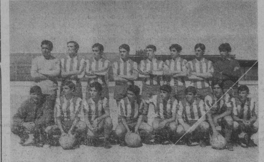
El juvenil del C. D. Acueducto.