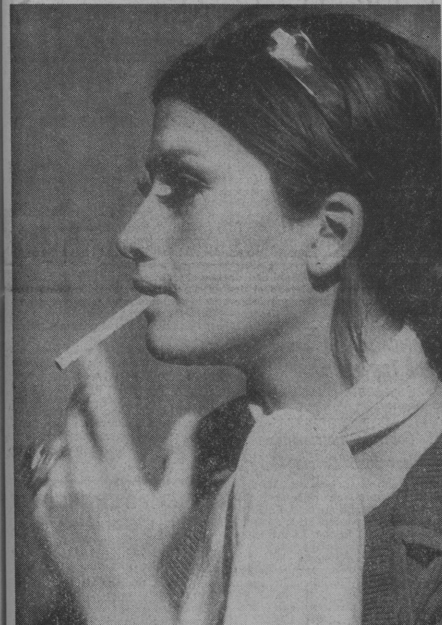
Madrid.—Nuestra bella representante en el certamen europeo, Noelia Alfonso, «Miss España 70», llegó al aeropuerto de Barajas procedente de Grecia, donde ha conquistado para España la corona de «Miss Europa 1970». ¡Bien por Noelia!