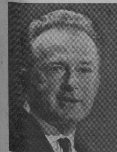
Yitzhak Rabin, embajador de Israel en Washington

El crecimiento vegetativo de la nación es aproximadamente de veinticinco mil anualmente, así como son alrededor de veinte mil los matrimonios que se celebran cada mes. Con referencia al pasado mes de febrero, las capitales que observaron un crecimiento vegetativo negativo (el número de fallecidos fue superior al de nacidos), fueron Castellón, con 54; Guadalajara, con 9; Lugo, 28; Orense, con 3, y Teruel, con 42.—Logos.