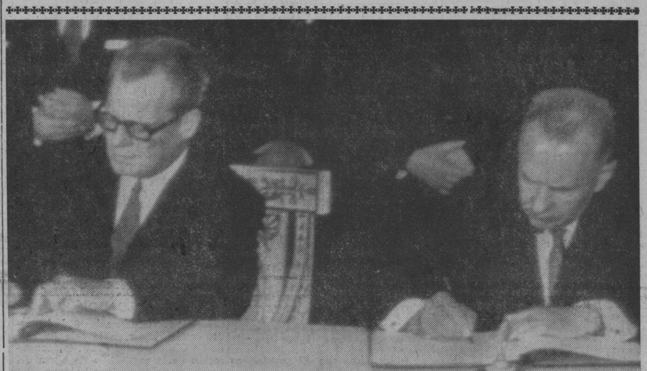
Moscú.—Alexei Kosygin, premier de la Unión Soviética, y el canciller Willy Brandt, en el momento de firmar el acuerdo germano-soviético en el Kremlin. Es un importante paso entre las relaciones de ambos países, por el cual Alemania renuncia a sus antiguas fronteras y tiene una posibilidad de reunificación del país.