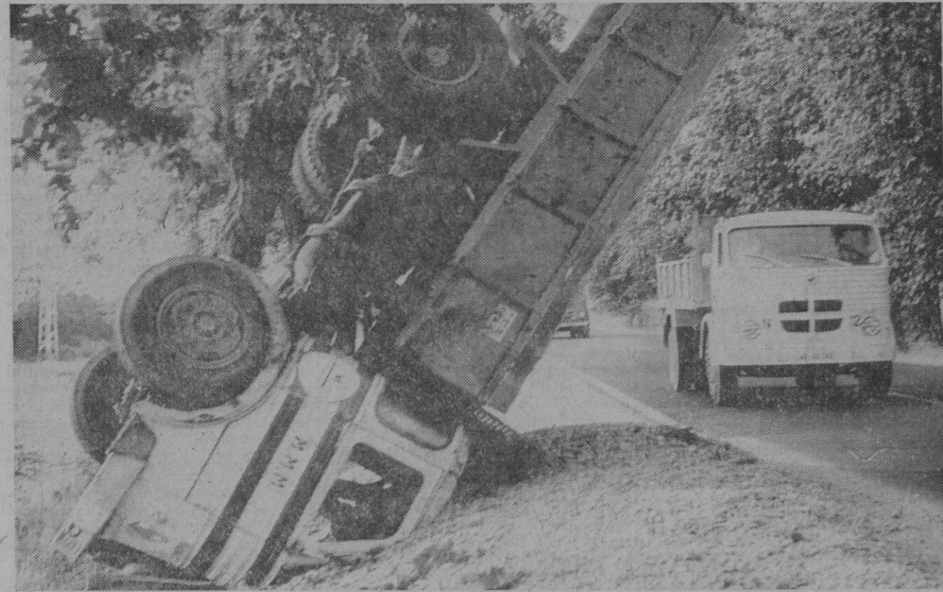
Aranjuez.—Se desconocen las causas, pero el camión derrapó a la altura del kilómetro 45 de la carretera de Andalucía, y quedó en la forma que puede apreciarse. Era el pegaso matricula M-396.641. Iba cargado de grava.

Belfast (Irlanda del Norte), 4.—La joven diputada católica Bernadette Devlin, que cumple actualmente una condena de seis meses de cárcel por su participación en los disturbios habidos en el Ulster el año pasado, piensa escribir un libro sobre su vida en prisión, según rumores recogidos hoy aquí. Las leyes británicas prohíben a los prisioneros escribir libros o tomar notas, sobre su estancia en la cárcel, mientras están cumpliendo condena, y si son descubiertos contraviniendo esta orden, pierden cualquier remisión a la que se hubieran hecho acreedores por buena conducta. Bernadette ha vendido cien mil ejemplares en el Reino Unido, y cuarenta mil en el extranjero de su autobiografía titulada "Price of my soul" ("El precio de mi alma"), y se estima que cobrará unos derechos de 10.000 libras (1.650.000 pesetas).