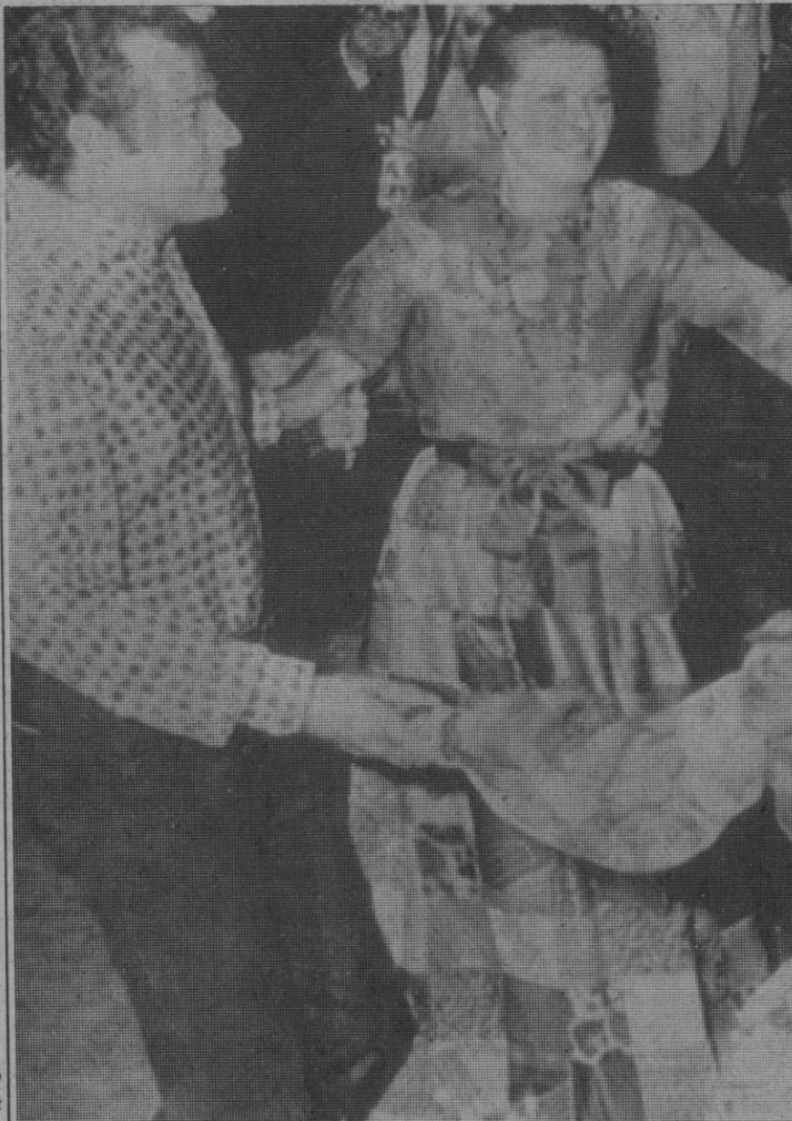
Mónaco.—La princesa Gracia de Mónaco con un modelo "gitano", última moda, bailando el "kasachok", durante una fiesta gitana dada en la piscina Beach.

Informes APIMOSA Ladreda, 10-4.º Teléfono 37-95