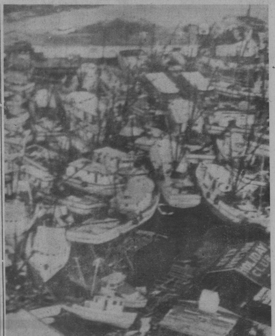
Port Aransas (Texas).—Buques de pesca aparecen embotellados en un rincón del puerto de Aransas tras haber quedado por perdidos por sus propietarios a causa del huracán "Celia", que azotó la zona. El huracán llevó vientos de 145 millas por hora y dieciocho personas, al menos, han resultado muertas.

Roma, 5.—Otros dos de los seis gemelos nacidos anoche han muerto esta mañana. Los dos supervivientes, una niña y un niño, pesan respectivamente 800 y 700 gramos. Los pequeños permanecen en la incubadora y los médicos se han reservado el pronóstico.—Efe.