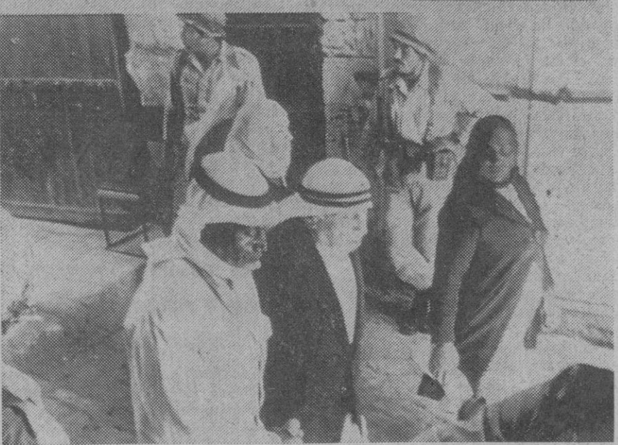
Arriba, el presidente egipcio Gamal Abdel Nasser es aclamado por la multitud a su llegada a la mezquita de Seida Zenab, donde asistió a una misa por los caídos en la guerra de los "Seis Días". Abajo, tropas israelíes, temerosas de cualquier incidente, montan guardia ante la mezquita de Al Aqsa, para evitar incidentes árabes con motivo del aniversario de la guerra de los "Seis Días".