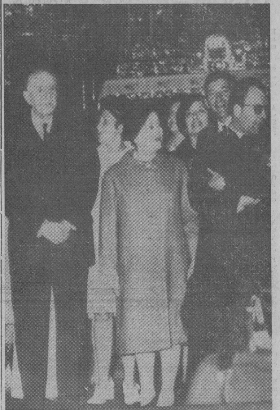
Santiago de Compostela.—El general francés Charles De Gaulle y su esposa visitaron la catedral de Santiago, en ruta hacia el parador de Cambados, donde pasarán unos días de descanso. En el templo realizaron la tradicional visita al Apóstol.—(Telefoto Europa Press.)

A las cinco de la madrugada ya estaba levantado y trabajando en sus memorias