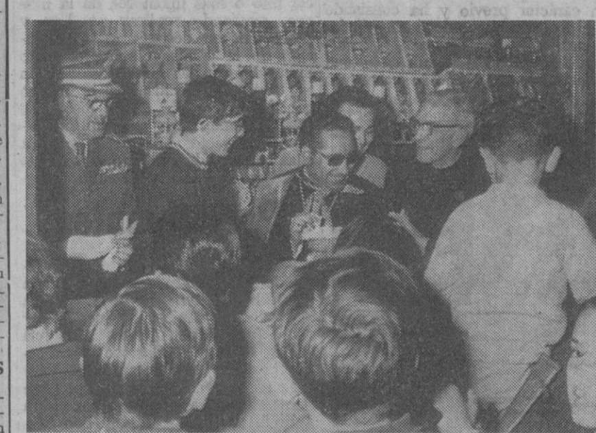
El obispo y el gobernador militar, atendiendo la demanda de boletos en el momento de inauguración de la tómbola.—(Foto Antonio)

A las ocho de la tarde de ayer fue inaugurada la Tómbola Diocesana de Caridad, que ha sido instalada, como en años anteriores, junto a las