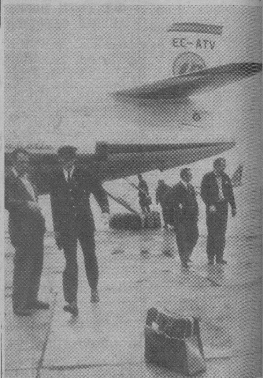
Londres.—En primer plano, el bolso de viaje separado del resto (al fondo) y que iba a ser cargado en el "Caravelle" de Iberia del vuelo OB 423, tras el robo del resto del equipaje. La Policía recurrió a artificios para que comprobasen el interior del bolso. Las precauciones fueron adoptadas a causa de una confidencia recibida por la Policía y, según la cual, un artefacto incendiario iba a ser colocado en el vuelo de "Iberia".

Hace dos días Israel anunció que pondría en libertad a los prisioneros hechos en Karameh y los devolvería a Jordania.—Efe-Reuter.