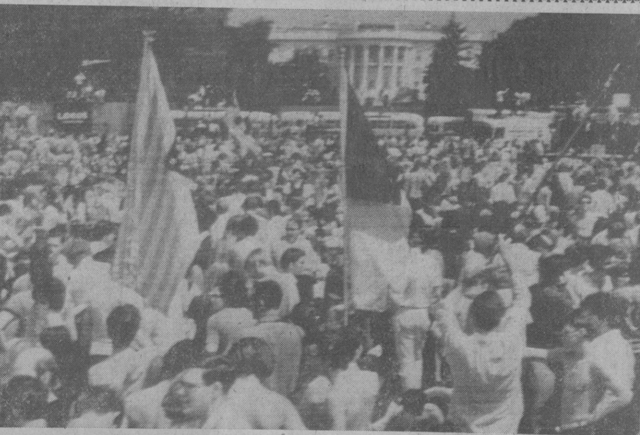
Washington.—Un aspecto parcial de la gigantesca manifestación ante la Casa Blanca, en la que cerca de doscientos mil estudiantes protestaron por la política de Nixon en el sureste asiático.—(Telefoto AP-Europa Press)

4. Agradecer a la Comisión del Grupo el acierto con que viene actuando y ratificarle su confianza para que continúe las gestiones que está realizando hasta la total solución de los problemas planteados. Cifra.