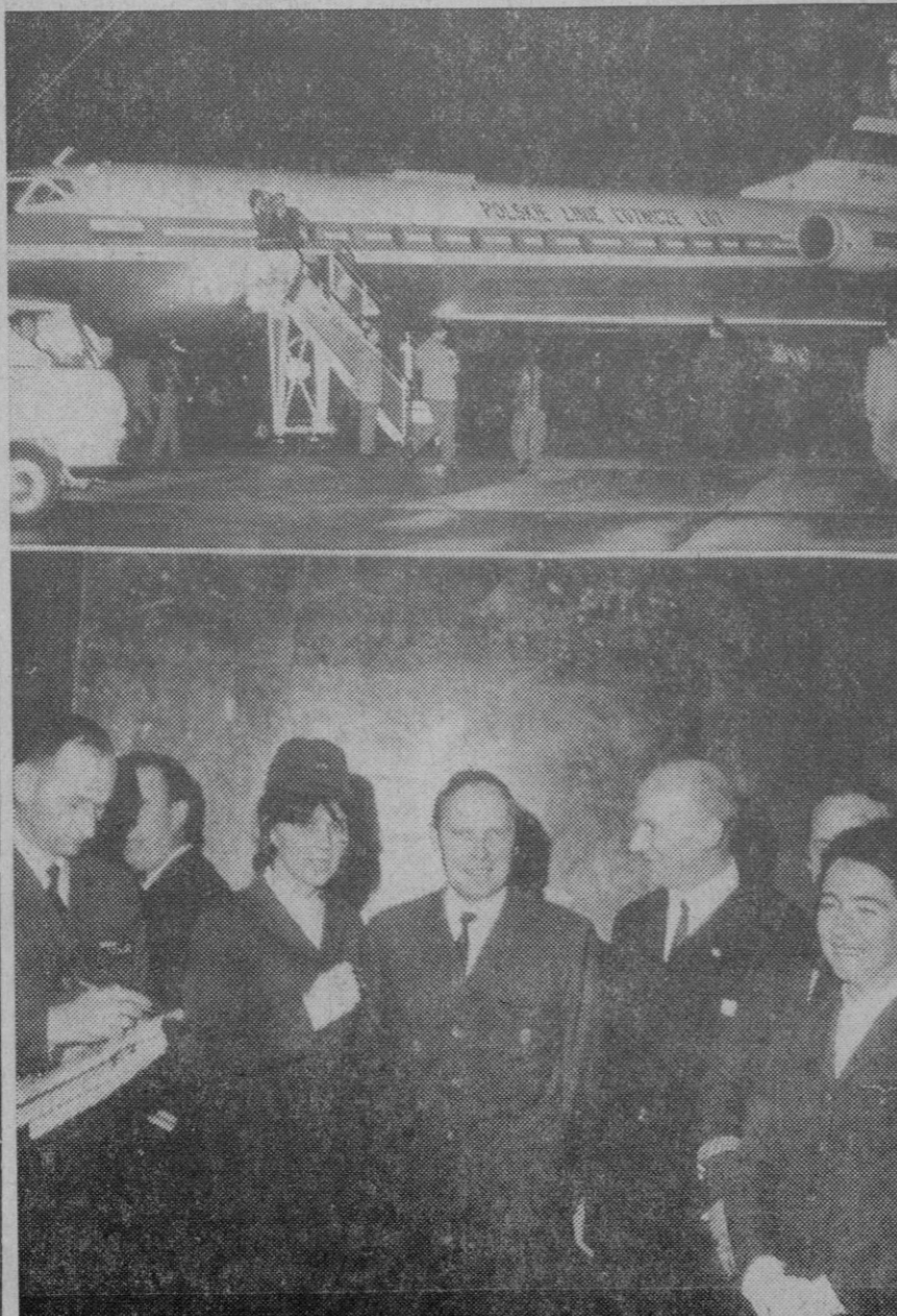
Madrid.—Arriba: el "Tupolev 134" de las Líneas Aéreas polacas "Lot", recién llegado a las pistas del aeropuerto de Madrid-Barajas en el vuelo inaugural de la línea Varsovia-Madrid. Abajo: el comandante, ayudantes de vuelo y azafatas del aparato, en las salas del aeropuerto madrileño

En todas las entidades bancarias y de ahorro de la capital y provincia se reciben donativos para las obras del Santuario de la Fuencisla.