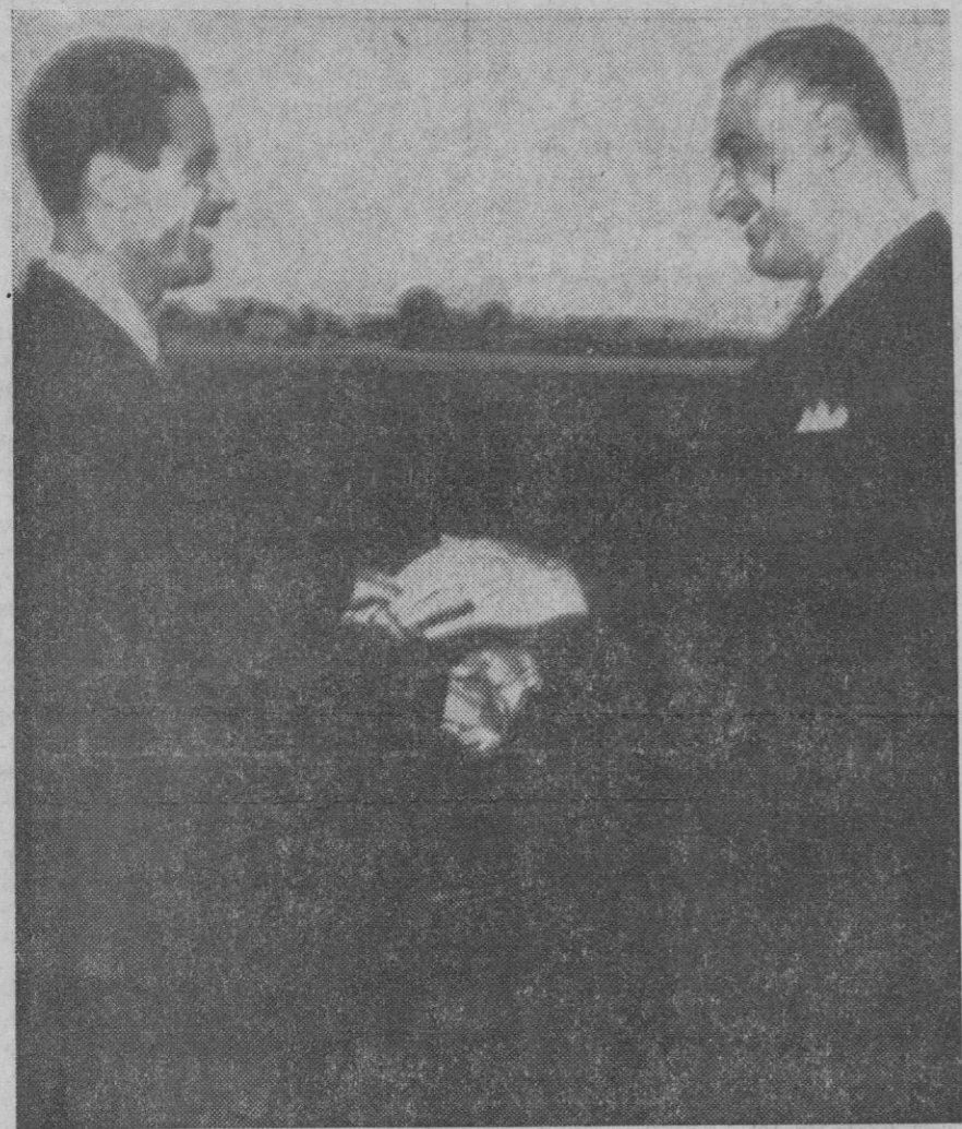
El Cairo.—El presidente Nasser de la República Árabe Unida (derecha) da la bienvenida al líder revolucionario de Libia, coronel Moamer Karafi Shake, momentos después de su llegada al aeropuerto de El Cairo (Teléfono de AP-Europa Press)

Gerona, 1.—Con la llegada de once aviones Charter, con más de mil doscientos turistas, puede decirse que ha comenzado hoy la temporada turística en el aeropuerto de Gerona-Costa Brava. Los once aviones llegados hoy, procedían todos ellos de los países nórdicos de Europa, y su pasaje estaba destinado a la Costa Brava en donde procederá sus aviones. Para mañana se anuncia la llegada de otros aviones "Charter" con turistas, esperándose que continúen en días sucesivos. Se calcula que este año llegarán a España por dicho aeropuerto unos 700.000 turistas, la mayor parte de los cuales se dirigirán a las localidades del litoral gerundense.—Cifra.