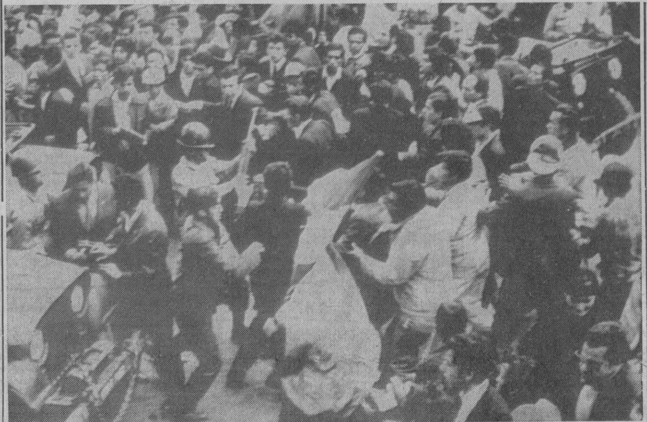
Protestando de un "fraude en el país" en las elecciones presidenciales, los seguidores del expresidente colombiano, Gustavo Rojas Pinilla, cargan contra la policía militar en Bogotá. Los manifestantes se lanzaron a las calles tras el anuncio del Gobierno negándose a nombrar a Rojas ganador, por haber declarado él mismo que era el ganador antes de conocerse el resultado de las elecciones.