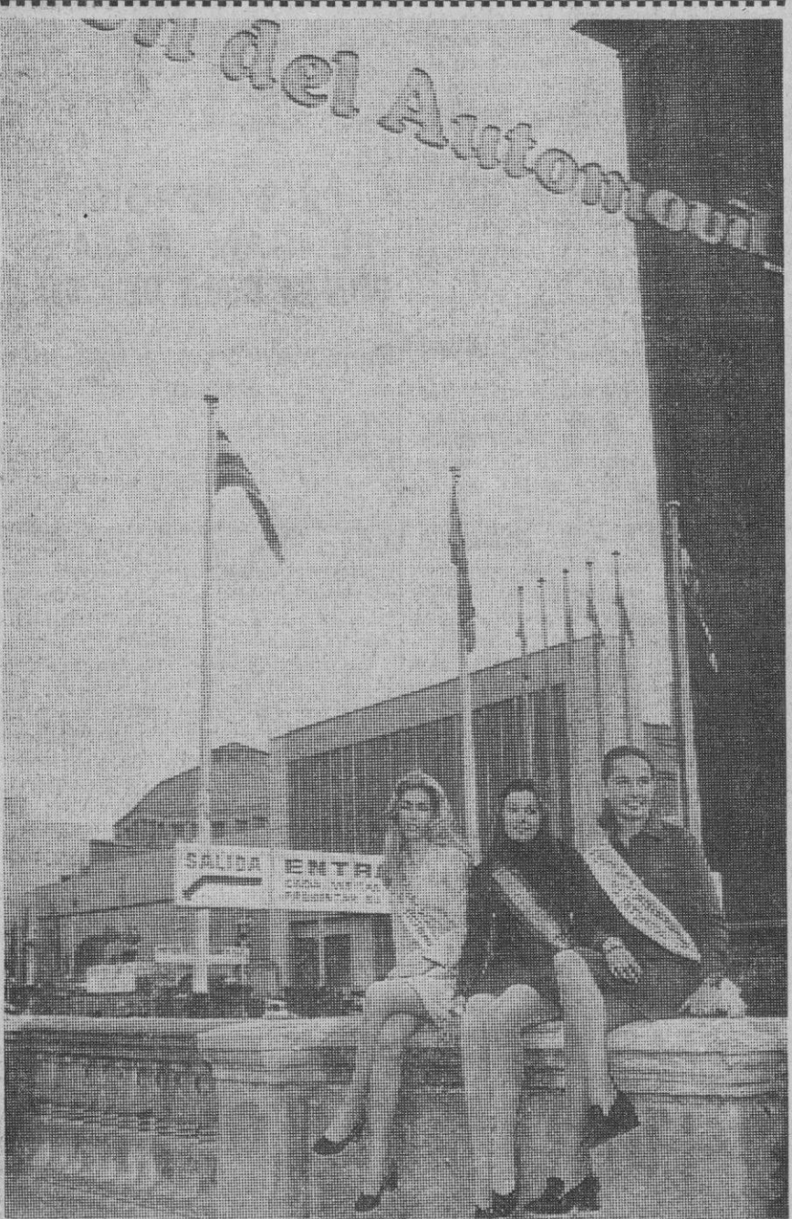
Barcelona.—Esta es la "Miss Salón del Automóvil 1970", acompañada de sus damas de honor. El Salón Internacional se ha inaugurado en Barcelona con asistencia de marcas de todo el mundo, que presentan sus últimos modelos.

Oficialmente, el departamento administrativo de Seguridad confirmó que dos disparos fueron hechos en una de las manifestaciones de parti-