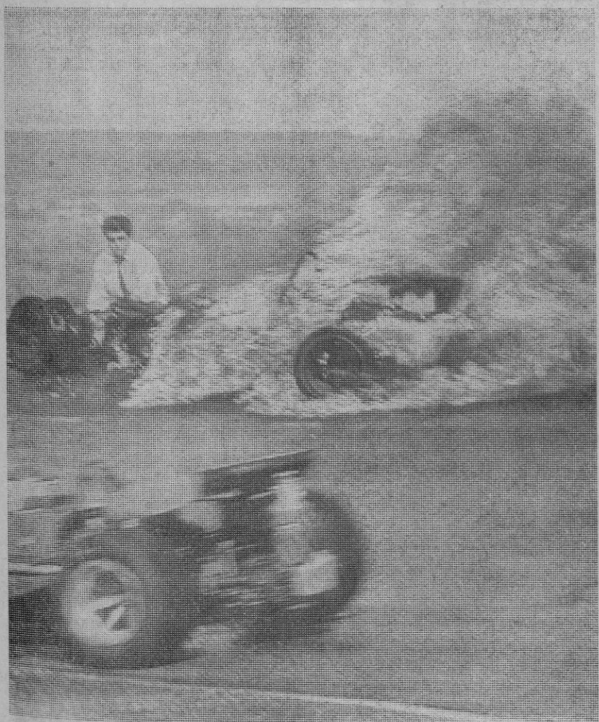
Madrid.—Entre los diversos accidentes que se produjeron en la disputa del Gran Premio de España, de fórmula 1, en el circuito del Jarama, el más grave tuvo como consecuencia el incendio de dos de los bólidos. Uno de ellos arde, al fondo, mientras en primer plano cruza otro de los participantes

EVIDENTE RIESGO DEL SISTEMA DEMOCRATICO Dice «El Espectador» que «la sor-