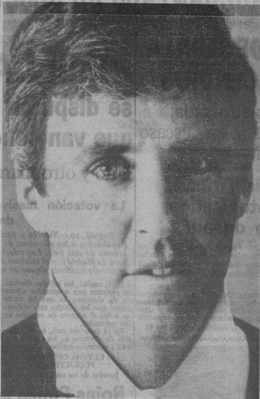
Burt Bacharach es, junto a Lennon y Mc Carney, el compositor mundial más importante de los diez últimos años. Todos los temas creados por este gran músico norteamericano han sido éxitos y además interpretados por los artistas y nombres con más categoría del mundo del disco. Tres mil intérpretes en todo el mundo han grabado en todos los idiomas sus composiciones.