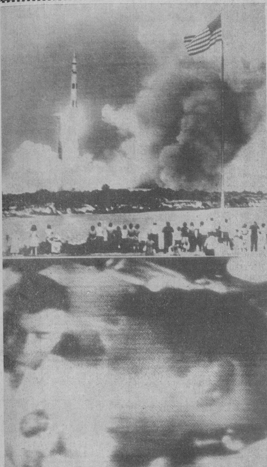
Cabo Kennedy.—Arriba: el momento en que el cohete "Saturno V" se eleva con la cápsula "Apolo" hacia la Luna. Abajo: escenas de los astronautas televisadas a la Tierra desde la cápsula ya camino de la Luna. La ruina manda hasta el momento en el tercer viaje del hombre a nuestro satélite.

Tokio, 13.—Trenes capaces de circular a más de 400 kilómetros por hora serán construidos en Japón en la próxima década, informa el presidente japonés de Ferrocarriles, Satoshi Isozaki. Manifestó durante una conferencia, a la que asistieron 300 delegados de 300 países, que los próximos expresos de gran velocidad circularán entre Tokio y Saka (Japón occidental). Japón dispone en la actualidad del «Hikari Express», que circula a 193 kilómetros por hora entre Tokio y Koto.—Efe-Reuters