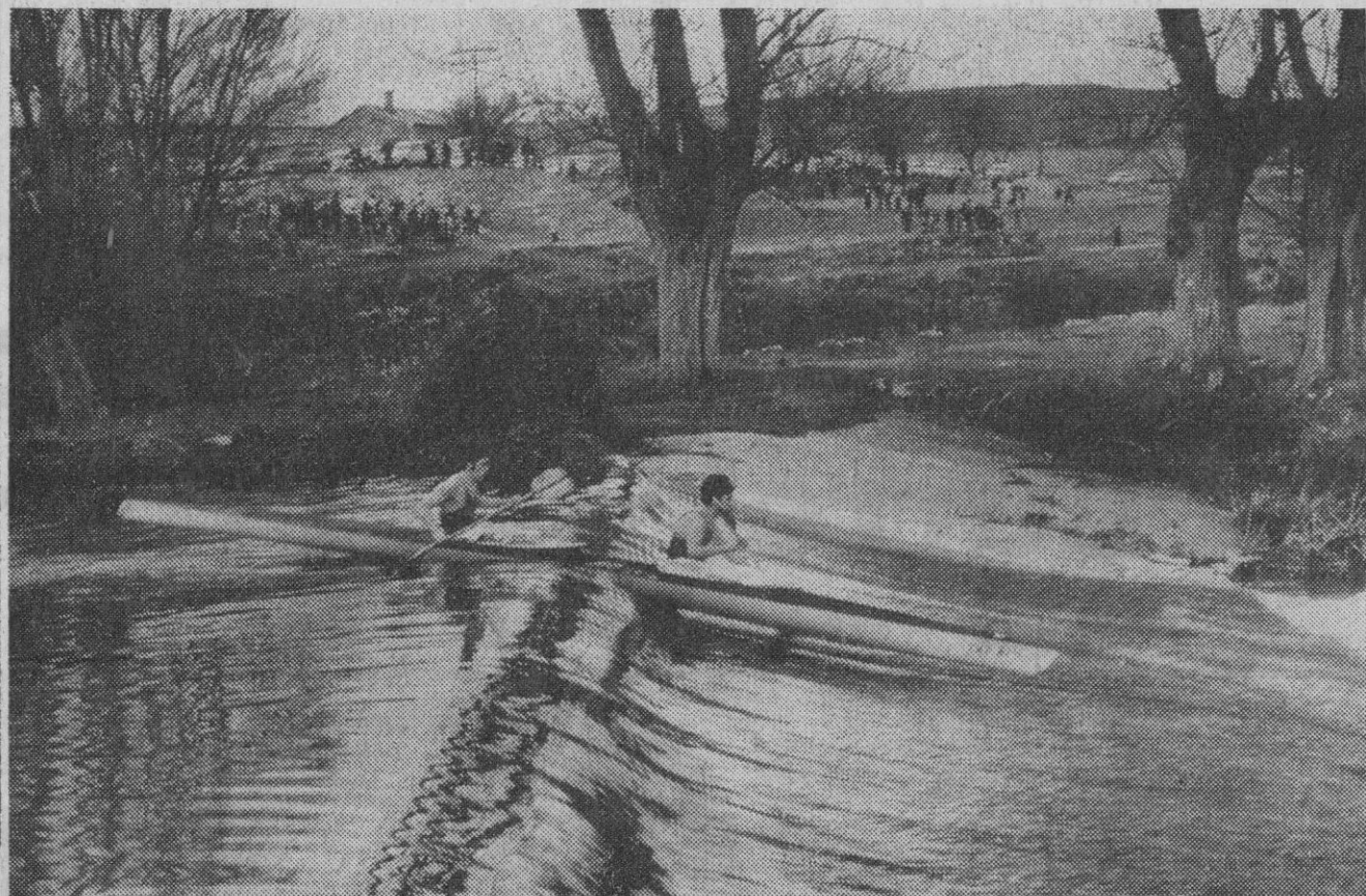
Se celebró ayer, como informamos en la sección deportiva, el II Campeonato Nacional de Piragüismo de la Guardia de Franco. En la fotografía, dos de los participantes salvando el difícil paso por la presa de San Pedro Abanto

El vuelo—indicador en dichas fuentes—sigue con toda normalidad y cumpliendo los planes previstos.