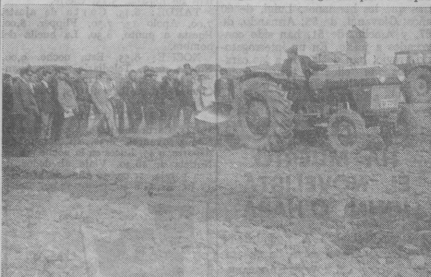
reiros para el mejor clasificado con el tractor de su marca.

El ganador de este concurso tomará parte en el regional que se dispu-