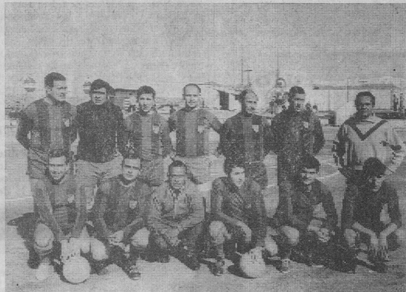
Los equipos de veteranos madrileños y segovianos.

El pasado sábado se celebró en el campo de El Peñascal el anunciado partido de fútbol entre los jugadores exgimnásticos y el equipo de Veteranos Ciudad Deportiva, compendio de internacionales madrileños que recorren, y con gran éxito por cierto, numerosos terrenos deportivos nacionales. Aun con la baja de Di Stefano, que se anunció antes de abrir las taquillas, varios miles de segovianos se dieron cita en el campo.