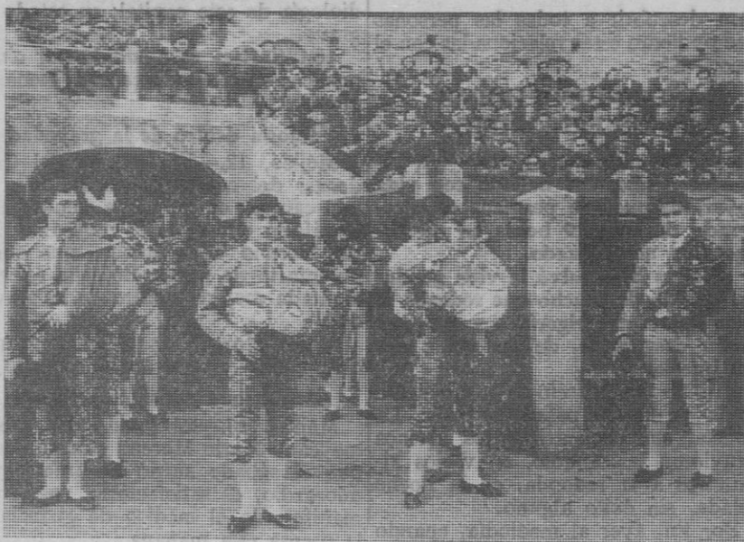
Dentro de unos segundos se va a iniciar el paseillo. Los diestros—otros mo-destos en busca de la fama—consumen la última impaciencia.