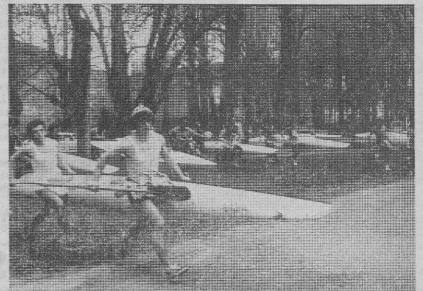
Se acaba de dar la salida y los piragüistas corren hacia el Eresma para "hacerse a la mar".

Ya en el punto de partida, la Alameda del Parral, había gran contingencia de público, esperando el momento de la salida de los palistas, que resultó, ciertamente, pintoresco.