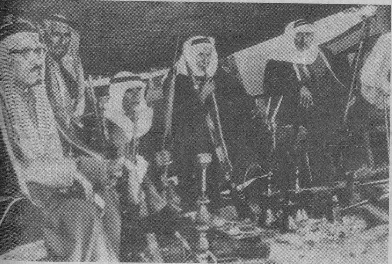
Amman (Jordania).—Los líderes de las tribus beduinas del desierto jordano, se reúnen en sus tiendas para mostrar su apoyo al rey Hussein y denunciar el anarquismo y la subversión en el país.

Madrid, 21.—Una línea de constante mejora en los resultados de las explotaciones hoteleras de la Empresa Nacional de Turismo, S. A., queda confirmada por el hecho de haberse cerrado el ejercicio correspondiente al año 1969 con unos beneficios de 27.445 pesetas. Así lo hace constar un portavoz autorizado de la Empresa, en aras—dice—de una información veraz, para señalar que las cifras que la revista «El Bar» ha manejado en un reciente trabajo, no son, en modo alguno, las exactas.—Cifra.