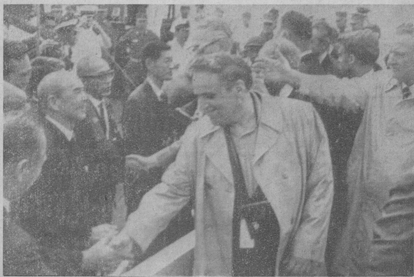
Iwo Jima.—Por primera vez desde hace veinticinco años, los supervivientes de la batalla de Iwo Jima, tanto japoneses como americanos, estrechan sus manos amistosamente a bordo del barco "Suribachi".

— En la provincia de Valencia dos obras también, la primera fase del desdoblamiento del acceso norte a Valencia, que consistirá en la ejecución de varios pasos superiores y la construcción de los caminos secundarios necesarios para llevar los existentes en los enlaces proyectados, (Continúa en la página 6)