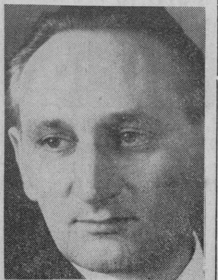
Egon Bahr, secretario de Estado de Alemania Occidental, que ha visitado Moscú con objeto de lograr un pacto de no agresión entre su país y la U. R. S. S.

tículos de calzados, bolsos y complementos ornamentales de la moda en general.—Efe.