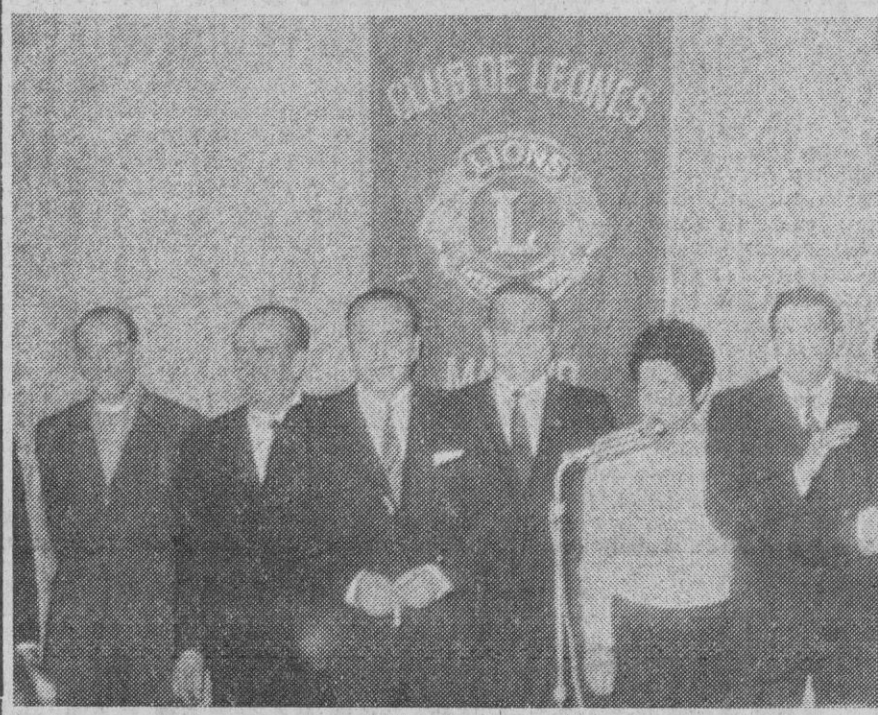
Madrid.—Este es el grupo de premiados por el Club de Los Leones de Madrid, que celebró una cena-homenaje en honor de diversas personas que se han distinguido por sus servicios a la comunidad en facetas de generosidad, amor al prójimo, etc.

Este aspecto de la cuestión, núcleo inicial del litigio y asunto en el que también había intervenido el Gobierno del Canadá, país nacional de Barcelona Traction, había llevado a que a iniciativa española se crease una comisión especial, de la que formaron parte expertos de España, Gran Bretaña y Canadá. Dicha Comisión estudió minuciosamente los antecedentes del asunto, y su informe fue elevado a las administraciones española, canadiense y británica. En 1951, los tres Gobiernos firmaron un acta, en la que, sobre la base de