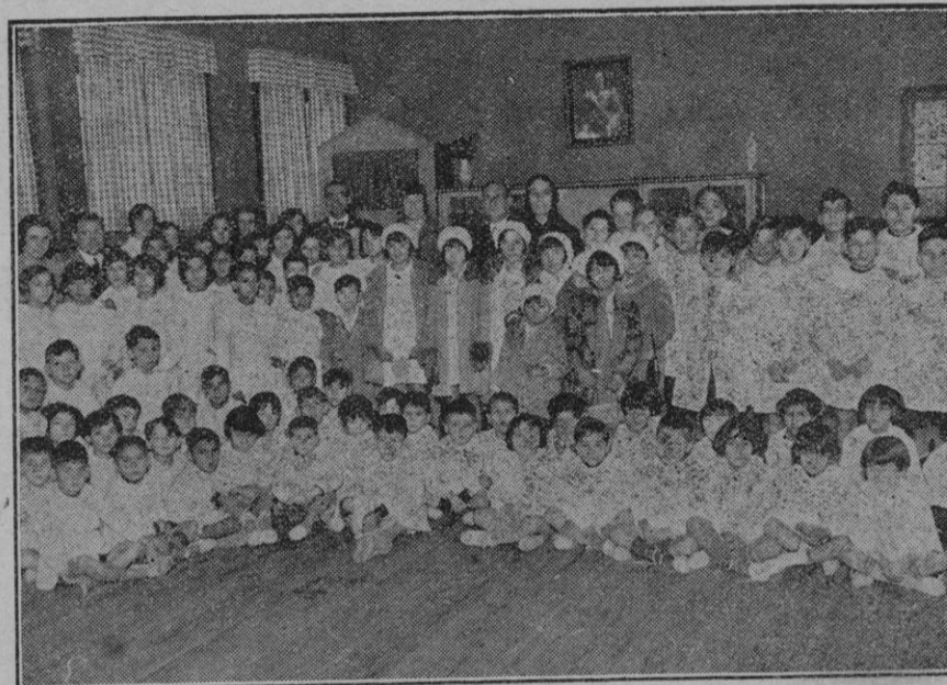
Barcelona. — Los profesores y alumnos de la escuela "Aire Libre" de Zaragoza, visitan la "Escuela de Mar".