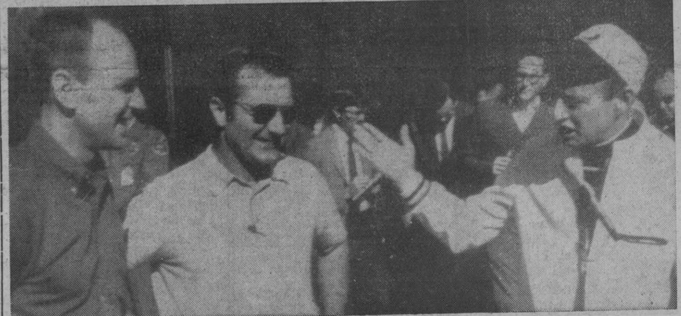
El comandante del «Apolo XII», Conrad, se dirige a sus compañeros diciéndoles en tono jocoso que «están otra vez libres». La escena, a la salida del laboratorio de Houston, del que los tres hombres fueron sacados tras los últimos exámenes médicos.

El acto inaugural concluyó con unas palabras del director general de Radiodifusión y Televisión. Tras manifestar su vinculación con esta profesión afirmó que nada de lo que allí se iba a tratar sería ajeno a él, por lo que iba a mostrar todo su apoyo especialmente a lo que hace referencia al perfeccionamiento de la profesión.