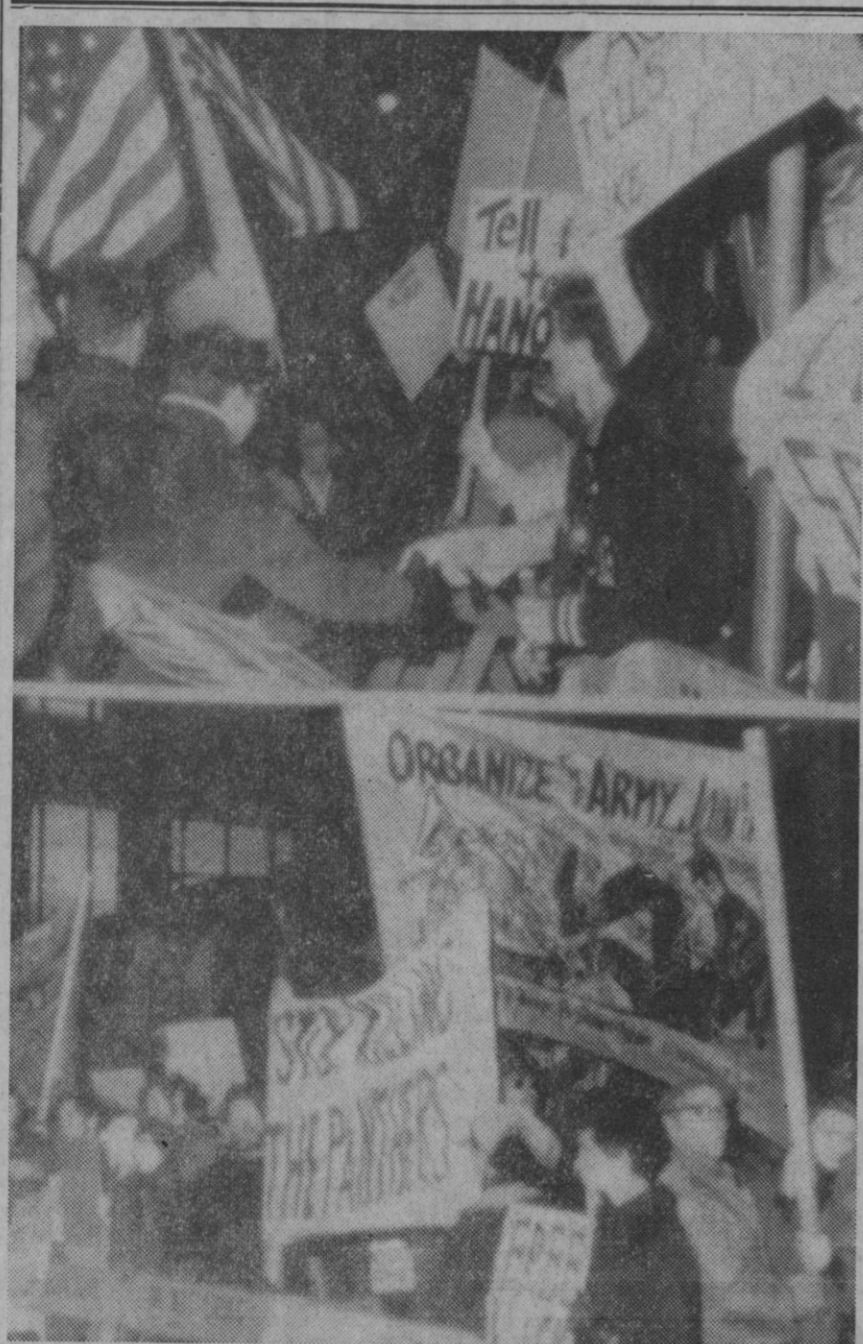
Nueva York.—Los que le apoyan y los que rechazan la política del presidente Nixon acerca de la guerra de Vietnam, se manifestaron cerca del Waldorf Astoria de Nueva York. Todos portaban pancartas, y el presidente asistió a una cena. Cincuenta apoyaban a Nixon, mil quinientos estaban contra él. Hubo más de cuarenta detenidos.

Según se comenta en círculos políticos de Madrid