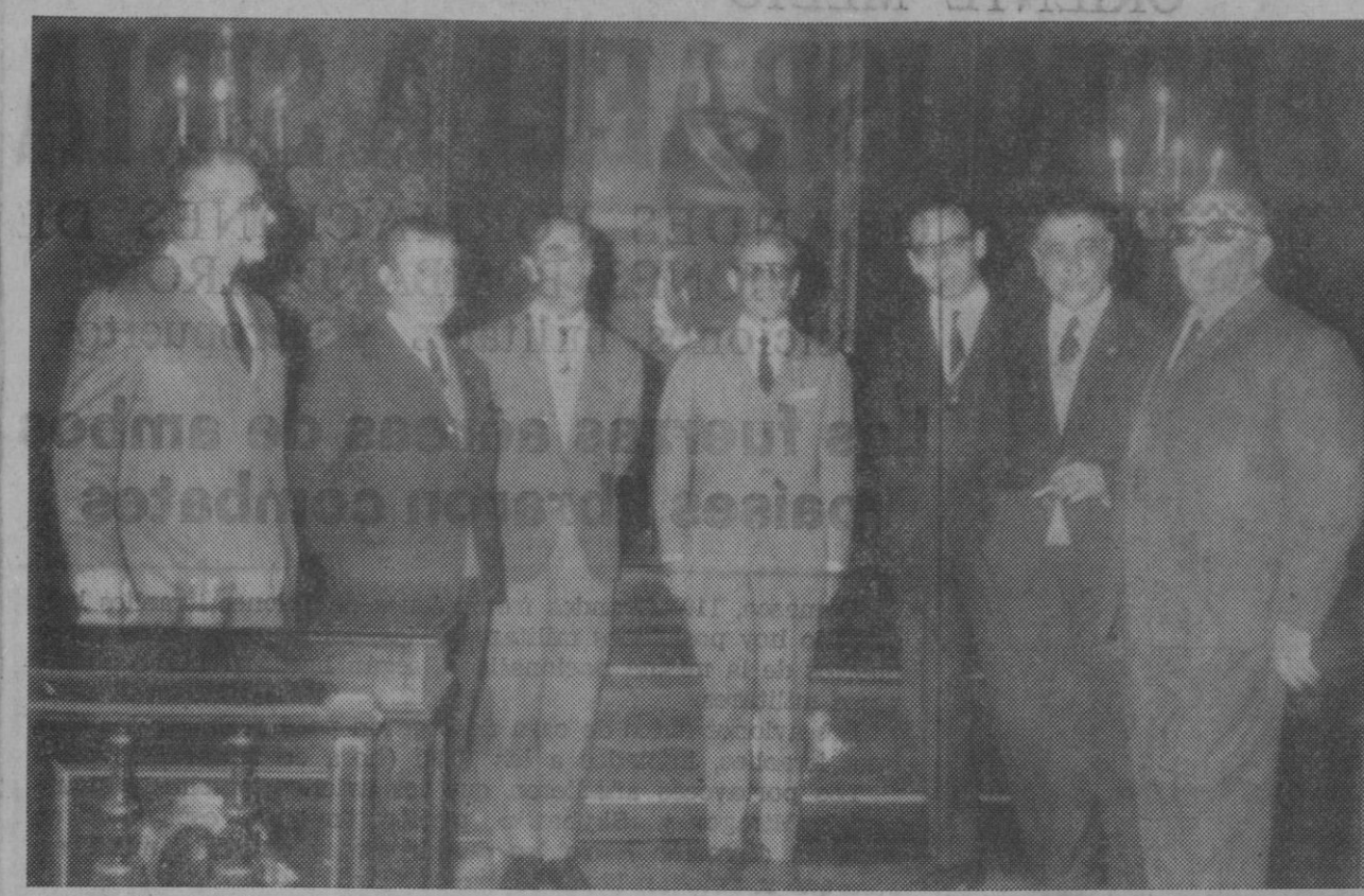
El gobernador civil posa junto al presidente y miembros de la Diputación Provincial durante la visita que efectuó en la mañana de ayer