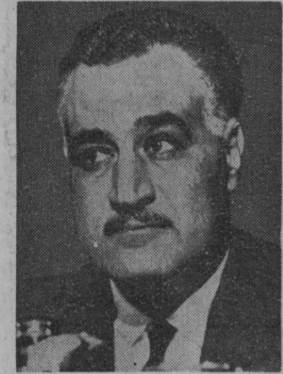
El Presidente egipcio, Nasser, decidido, al parecer, a la escalada de la guerra en Oriente Medio

La suscripción para las obras en el Santuario de la Fuencislera espera también su donativo.