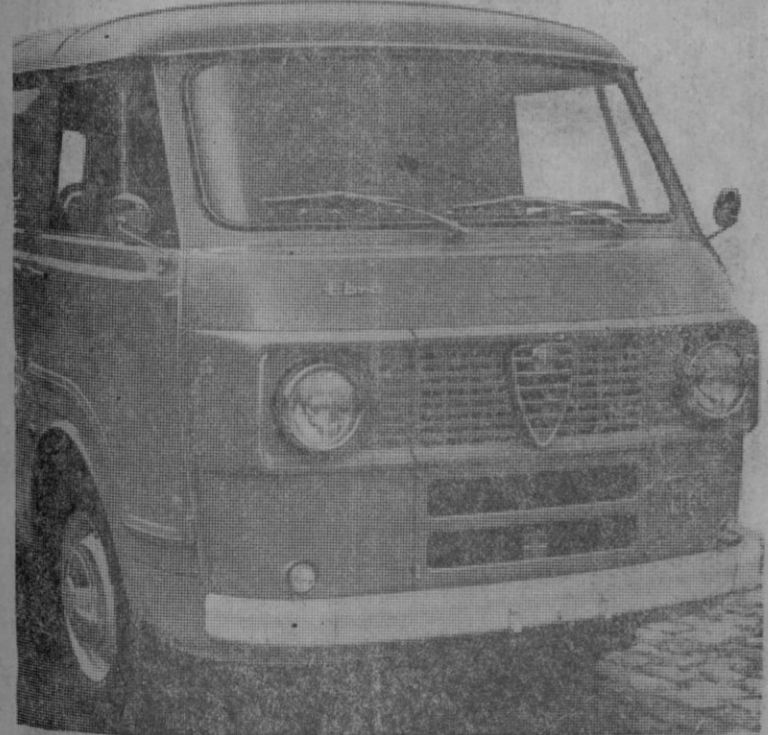
El vehículo insuperable para llevar 1.000 Kgs.

Fabricado por FADISA, con garantía y asistencia técnica EBRO en toda España.