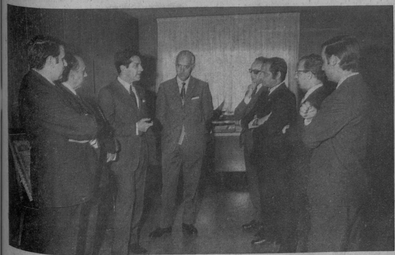
Esta mañana, según informamos en la sección de local, se ha entregado a don Adolfo Suárez González, director general de Radio y Televisión, el título de presidente de honor de la Agrupación Sindical Provincial de Radio y Televisión. A un momento de dicho acto corresponde la fotografía, en la que el señor Suárez González aparece junto al delegado de Sindicatos, presidente del Sindicato Provincial de Prensa, Radio, Televisión y Publicidad y los miembros de la Agrupación que se han desplazado a Madrid.

Madrid, 26.—A últimas horas de la tarde de ayer, y después de haber permanecido unos días en España, regresó a Roma, por vía aérea, monseñor don José María Escrivá de Balaguer, fundador del Opus Dei.