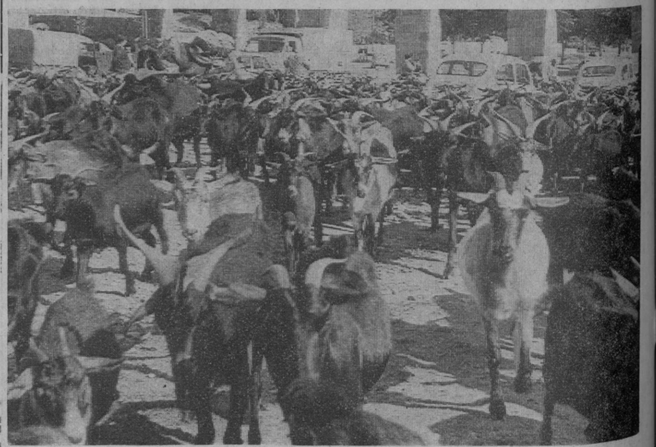
Plasencia (Cáceres).—Cerca de cien mil cabezas de ganado cabrio, procedentes de los campos de León, atraviesan las tierras de Plasencia en su paso hacia las cálidas tierras bajas extremeñas, donde pasarán el invierno en los pastos de la región.

Los cuatro integrantes de los «Beatles», Lennon, Paul McCartney, George Harrison y Ringo Starr, recibieron cada uno el M. B. E. en junio de 1965.—Efe.