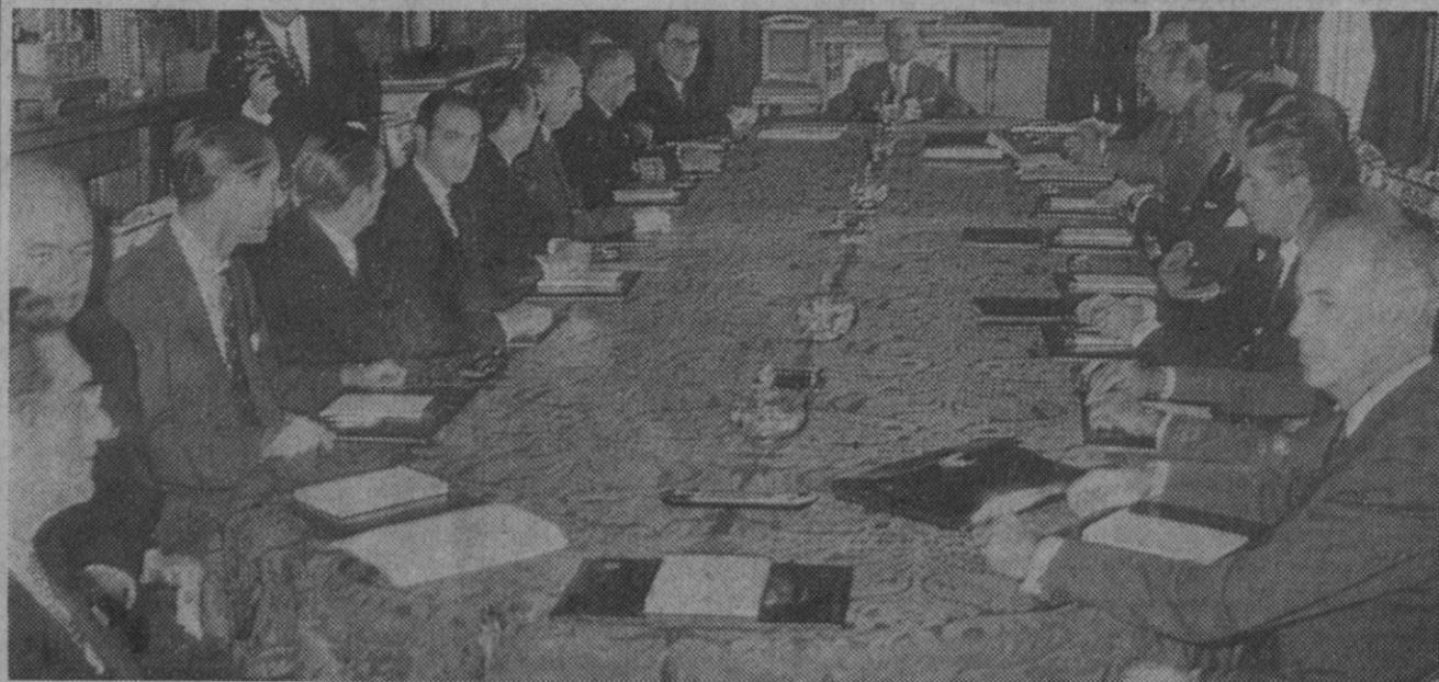
El Pardo (Madrid).—En la mañana de hoy ha tenido lugar en el palacio de El Pardo la primera reunión, tras la toma de posesión celebrada ayer, del nuevo Gobierno con el Jefe del Estado.

«Me voy porque los años pesan y los hijos me reclaman cada mañana al despertar».—Alfil.