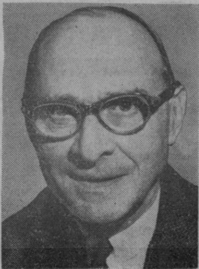
David A. Morse, secretario general de la Organización Internacional del Trabajo, organismo de la O. N. U., a la cual se ha concedido el premio Nobel de la Paz

«Menos mal para el oído humano que las chicas todavía no llevan bikini fuera de la playa», dice el doctor.—Efe.