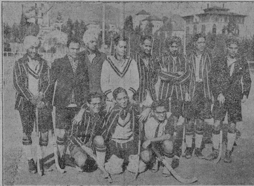
Barcelona. — Interesante grupo indio de Hockey que venció al equipo del Real Polo en el campo de éste último