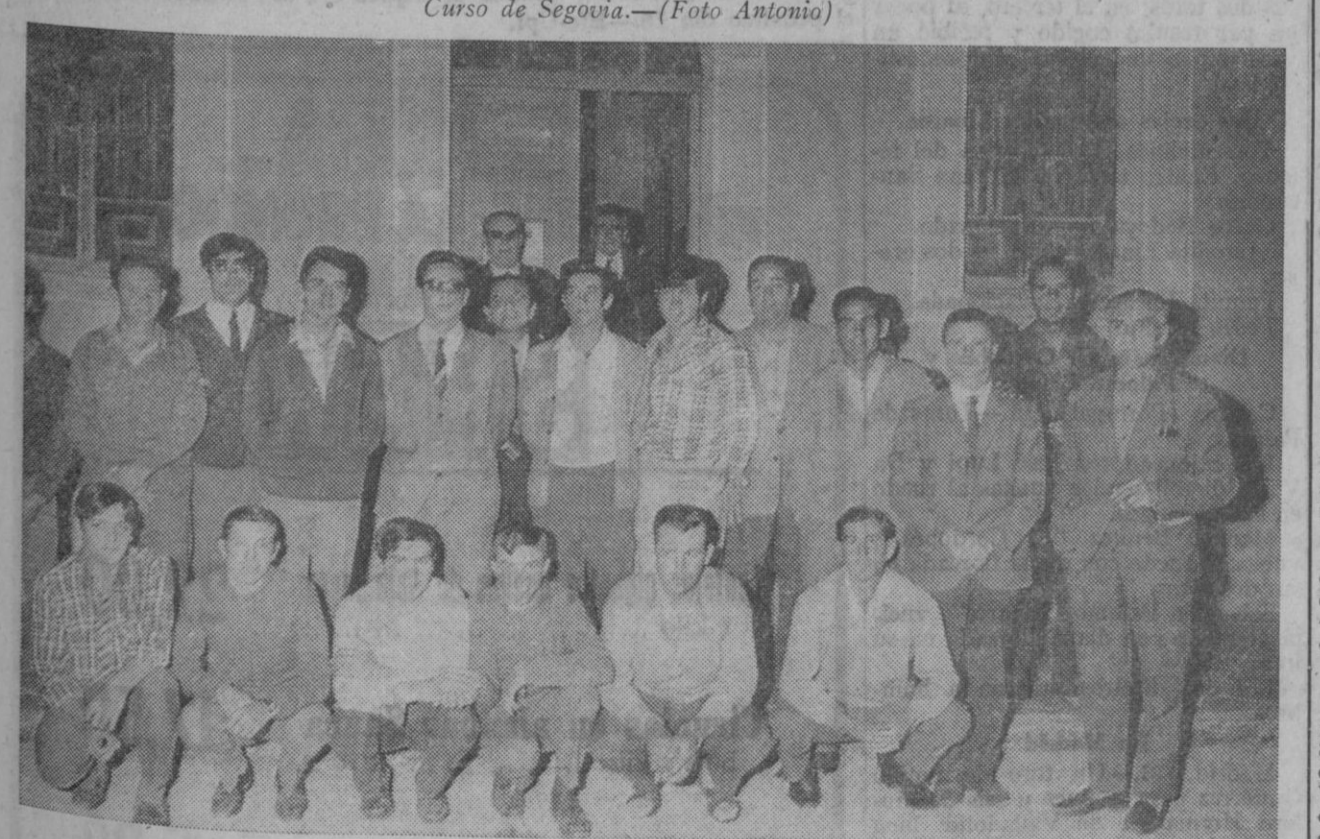
Curso de Chañe.—(Foto Antonio)

Se ha clausurado en esta capital un curso de fontanería, en el que han obtenido el correspondiente carnet 15 alumnos. El acto tuvo lugar en el local del curso y fue presidido por el delegado provincial de Trabajo y el gerente provincial del P. P. O. Comenzó con la lectura por uno de los monitores de la memoria del Curso, A continuación hizo uso de la palabra el gerente del P. P. O., que felicitó a los alumnos por su aprovechamiento, constancia y espíritu de superación, demostrado a lo largo de