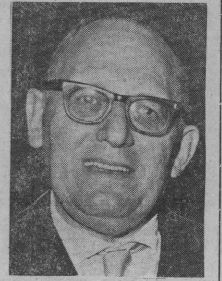
Maurice Schumann, nuevo ministro francés de Negocios Extranjeros