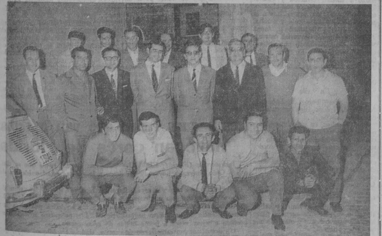
Curso de Segovia.—(Foto Antonio)