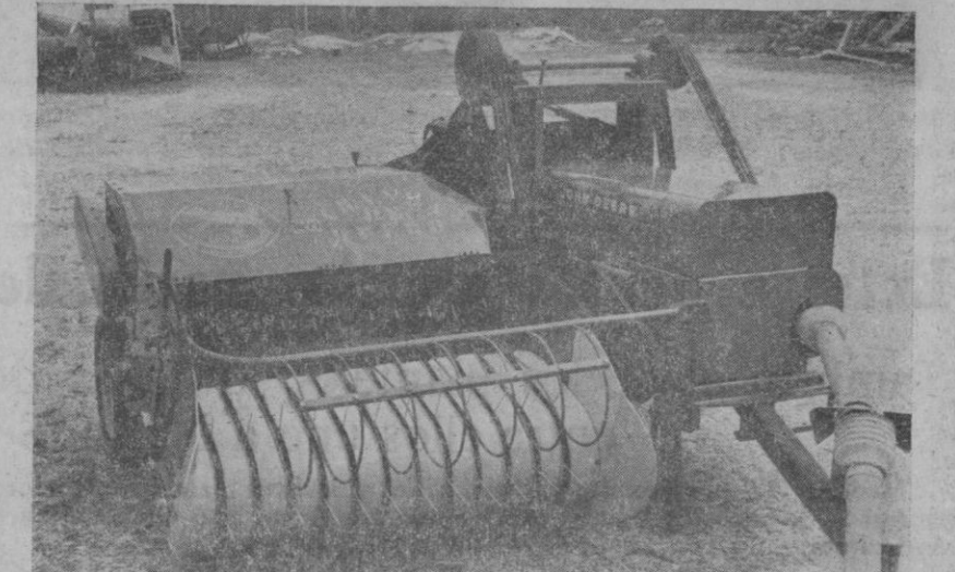
La acreditada recogedora-trilladora y cargadora de paja marca «LAGARTO».

Con el mismo trabajo y tiempo, saca las pacas de paja trilladas. El cilindro machacador marca «LAGARTO» se acopla a todo tipo y marca de empacadora.