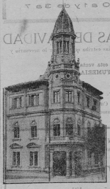
Vieh.—Perspectiva que ofrece la fachada principal de la Caja de Pensiones para la Vejez y de Andro, destinado a oficinas y biblioteca de Ayto, inauguración se celebrará en breve