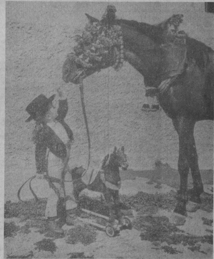
Jerez lanza la alegría de su Feria al mundo. Este es el cartel, ingenuidad y simbolismo, que pregona a su Feria, las Fiestas del Caballo, en las que todo lo hispánico tiene reflejo de conmemoración de altura y gracia

«Senador, no me gusta ser evasivo—respondió Hill—. Mi respuesta es sí.»—Efe-Upi.