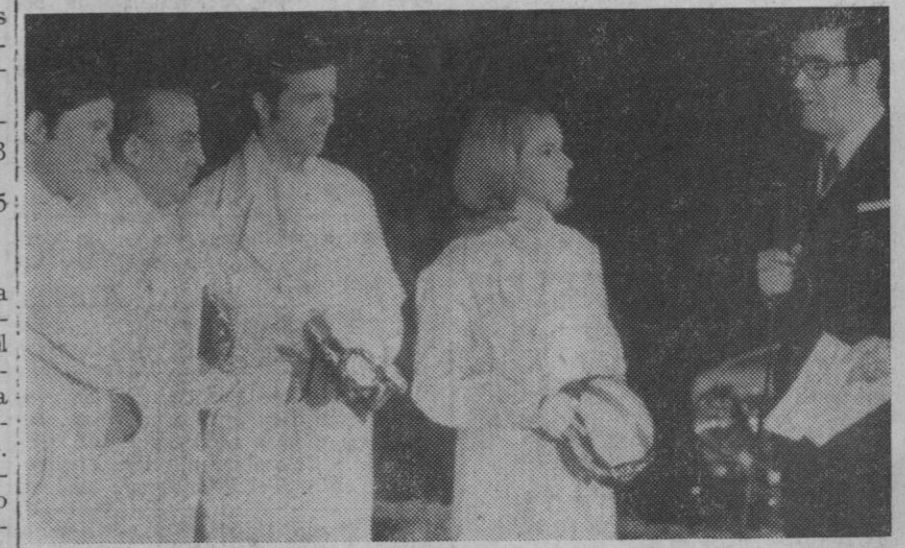
Barcelona.—Un momento del programa "Un millón para el mejor", que ha entrado en su última fase.