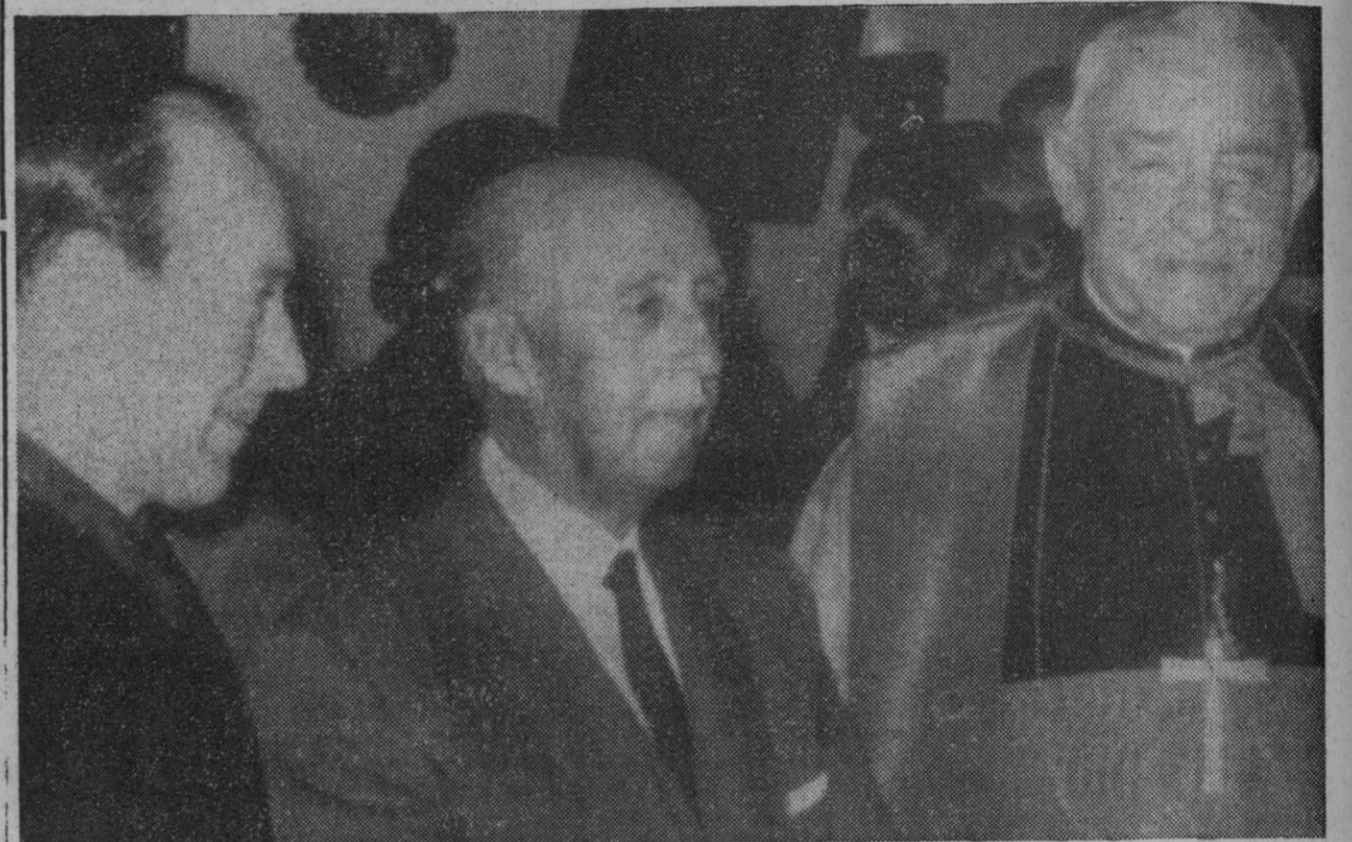
Santiago de Compostela.—Su Excelencia el Jefe del Estado, Generalísimo Franco, cumplimentado por las primeras autoridades provinciales de La Coruña a su llegada a Santiago de Compostela. A su lado el cardenal Quiro-Palacios y el gobernador civil.

Ginebra (Suiza), 1.—Suecia ha propuesto hoy un tratado de prohibición de las pruebas nucleares subterráneas en la Conferencia de desarme de Ginebra, con propuestas para las inspecciones por invitación. La señora Alva Myrdal, delegada sueca en la Conferencia ginebrina, que abarca diecisiete naciones, hizo la proposición. Este tratado prohibiría las explosiones nucleares subterráneas, excepto aquellas de construcción u otros propósitos pacíficos bajo un acuerdo internacional separado.—Efe-Reuter.