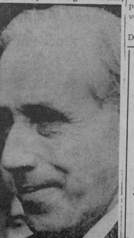
Don Julián Besteiro, el líder socialista que enjuició duramente la evolución política de la II República española.

«La república instaurada en 1931 se ha dejado arrastrar a la línea bolchevique, que es la aberración más grande que han conocido quizá los siglos». «Estamos derrotados por nuestras culpas. La reacción contra ese error de la república de dejarse arrastrar a la línea bolchevique la representan genuinamente,