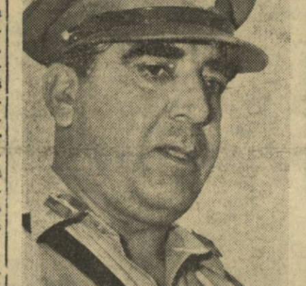
Yahya Khan, jefe del Ejército paquistaní, el cual ha tomado el poder en el país tras la dimisión del presidente Ayub Khan

Rawalpindi, 31.—El general Yahya Khan, el oficial de carrera que ha gobernado Pakistán desde que el mariscal de campo Mohammed Ayub Khan presentó su dimisión hace seis días, se ha hecho cargo esta noche de la Presidencia.