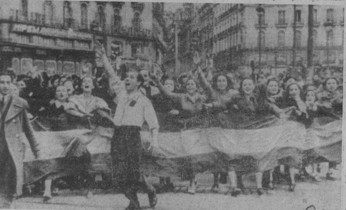
El pueblo madrileño de hace treinta años pasea su entusiasmo por las calles de la capital de España, rubricando con su gozo la terminación de nuestra guerra de liberación.

«La ayuda de Rusia a España es la necesaria para que haya evitado».