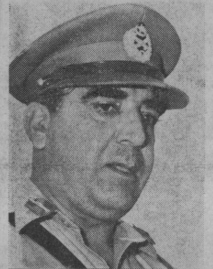
Yahya Khan, jefe del Ejército pakistani, el cual ha tomado el poder en el país tras la dimisión del presidente Ayub Khan

YAHYA KHAN se hace cargo de la Presidencia del Pakistán