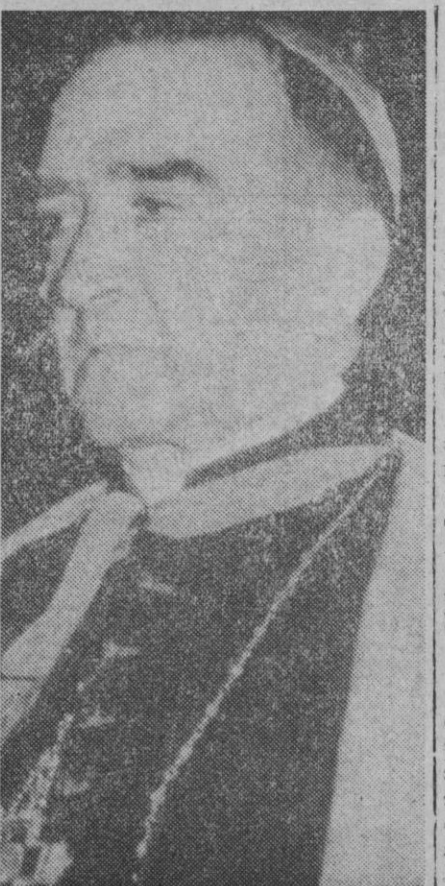
El arzobispo de Madrid-Alcalá, doctor don Casimiro Morcillo, elegido recientemente nuevo presidente de la Asamblea Episcopal Española.

Las condenas, sin embargo, no han sido anunciadas por el radio de Bagdad.—Efe-Upi.