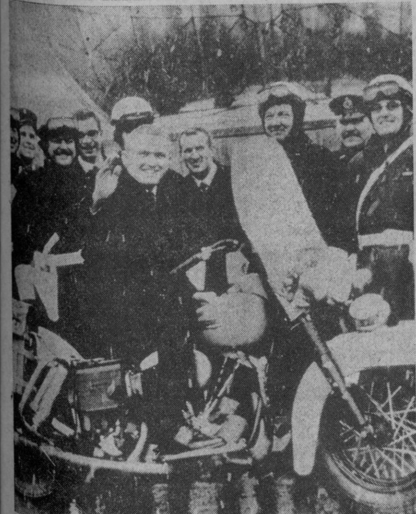
Bruselas.—Frank Borman durante su estancia en Bruselas efectuó una visita al "Atomium" y aquí le vemos bajo la nieve, con los gendarmes y subido en una de las motos de servicio de éstos.