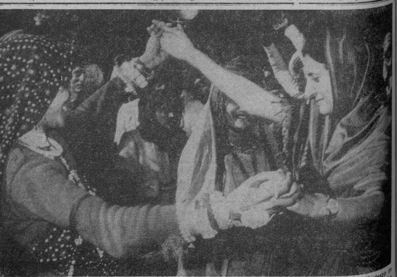
Nueva Delhi.—La primer ministro de la India, la señora Indira Gandhi, danza con toda su destreza en una celebración en Nueva Delhi, durante el congreso de danzas folklóricas de Teon Murti, que se celebra estos años en esta ciudad.

Madrid, 11.—La Comisión de Educación y Ciencia de las Cortes se reunirá a las seis y media de la tarde de hoy. En el orden del día figura la intervención del ministro de Educación y Ciencia, señor Villar Palasí, que presentará el «Libro Blanco» de la educación en España.