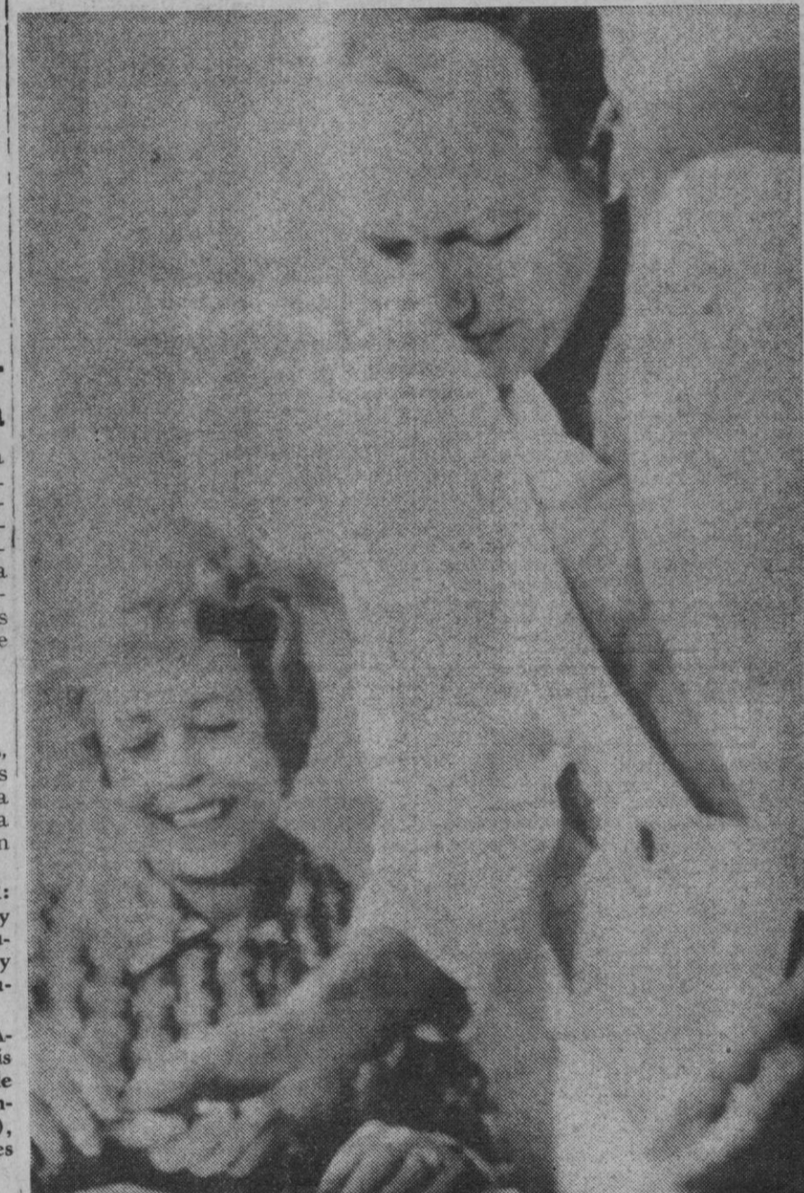
Houston.—El doctor Denton Cooley, de Houston, recoge de manos de la señora Karsten la pluma con que ha firmado como fundadora de un "banco de vida", en el que se cederán órganos para futuros trasplantes. El doctor Cooley, el cirujano que mayor número de trasplantes ha realizado en el mundo, firmó un documento en el que se comprometía a donar su cuerpo para estudios, a su muerte.

Bombay, 12.—Más de 500 heridos y lesionados han sido trasladados en ambulancias y atendidos en servicios médicos como resultado de las violencias registradas ayer en los suburbios de Bombay en las que la Policía se ha visto obligada a abrir fuego. Aunque no se conocen aún las muertes producidas en los últimos disturbios si se sabe que al menos 39 personas han perecido en el curso de los últimos cuatro días de violencias registradas en Bombay. En Andheri, a unos 20 kilómetros de Bombay, algunos grupos que trataron de incendiar dos fábricas hu-