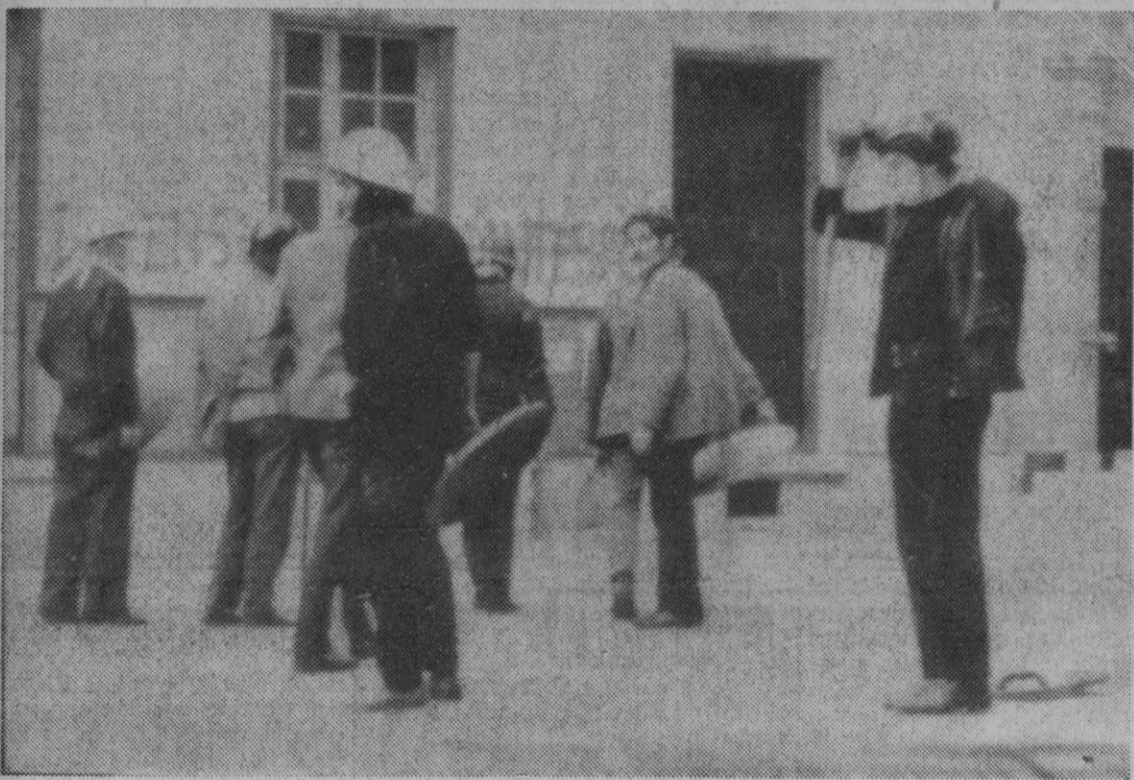
París.—Este grupo, conocido con el nombre de «katangués», aparecen ante la Universidad de La Sorbona, de la que han sido expulsados por los propios estudiantes tras decidirse que la Universidad debe ser temporalmente evacuada para que puedan limpiarla.

Para facilitar su operación, el ladrón penetró en el museo con una silla de aluminio plegable y la extendió a la puerta de la sala donde se exhibía la piedra preciosa para evitar que entrase nadie.