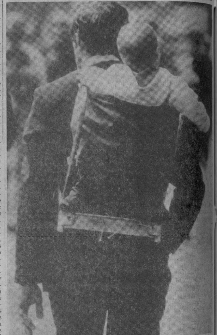
Copenhague.—Con estas sofisticadas silletas que pueden ponerse a la espalda, hasta el más quisquilloso de los padres puede llevar cómodamente a su pequeño sin sentirse demasiado molesto ni saber qué hace con él.

Según dichas informaciones, el Gobierno haitiano ha enviado fuerzas para rechazar a un grupo armado compuesto de haitianos exiliados y mercenarios cubanos y europeos. Las informaciones añaden que el grupo procede de la provincia cubana de Oriente.—Efe-Reuters.